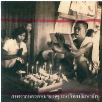
ภาพจากหอจดหมายเหตุ มหาวิทยาลัยพายัพ

...ผู้ใดเกิดปีกดสะง่า (ปีมะเมีย) มัดศอกงูมา ปีเต่าสะง่าจีสำภามา ปีกาบสะง่าท่านจีหมามา ปีระวายสะง่าถือการะปิด (ตาระปีตร) มาจีหมากางร่มมา ปีเป็กสะง่าถือคากางร่มมา งูงวดถือไม้เท้า จากดินแดนมา มีสติปัญญา มักสอนท่าน พระยาภูริศาสตร์ป็นเป้า ถือแดนพ่อหลงหล่อ ธาตุไฟใจรี ไม่กลัวใคร มีตัวไม่หมดไมโส มักเป็นแผล ให้ส่งไปหาพ่อแม่ มีเบี้ย ๑,๐๐๐ ฟ้าย ๑,๐๐๐ เกลือก้อนหนึ่ง ไก่สองตัว เป็ดตัวหนึ่ง ปลาตัวหนึ่ง ส่งเสีย จักมีข้าวของสมบัติ อายุได้ ๒๕ ปี จักได้หนีเจ้าที่อยู่ ๒๗ ปีหนหนึ่ง ๕๐ ปีจักตาย ดังได้ส่งเสีย ก็จักอายุยืน ไปอีก ๑๐ ปี ถ้าไปนั้นก็อยู่ด้วยบุญแล... 2