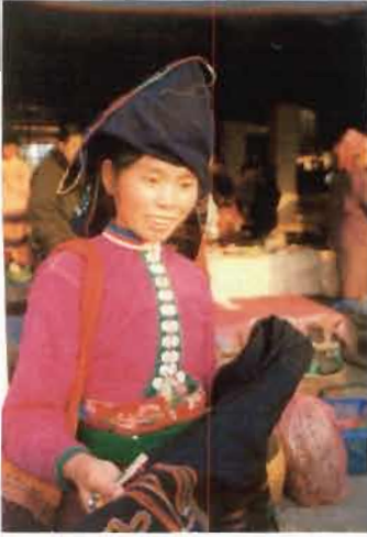
รูปไทดำเมืองสิง หลวงน้ำทา ลาว

ดังเช่นพิธีกรรมตามความเชื่อผี ที่มักร้องขอประโยชน์ทางวัตถุ แต่จะเน้นการบรรลุถึงนิพพานตามคคิของพุทธ