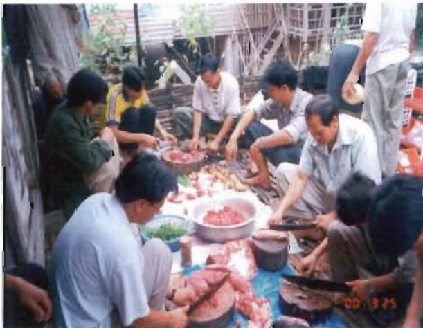
รูปการเตรียมอาหารในพิธีเสนเฮือน

คติความเชื่อถือผีได้สร้างความเป็นอันหนึ่งอันเดียวกัน ในชุมชนตั้งแต่ระดับครอบครัวขึ้นไป จนถึงระดับหมู่บ้านและเมือง เป็นภาระหน้าที่ตามอุดมการณ์และหน้าที่ทางสังคมซึ่งถือว่าเป็นส่วนหนึ่งของภาระหน้าที่ต่อชุมชนที่จะละเลยไม่ได้ โดยเฉพาะอย่างยิ่งสังคมเกษตรกรรม คือ