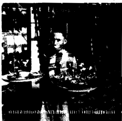
ภาพลูกหลานของชาวย่านบ้านแม่โพธิ์ อำเภอเมืองน่าน

คติความเชื่อถือผีเกิดจากสภาพความเป็นอยู่ที่ใกล้ชิดหรือพึ่งพาธรรมชาติ เกิดจากการที่คนไม่สามารถเอาชนะหรือควบคุมธรรมชาติได้ ไม่สามารถให้คำตอบเกี่ยวกับปรากฏการณ์-