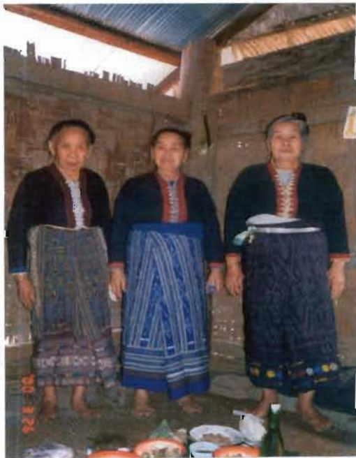
รูปแม่เต่าไทดำจากสิบสองจุไทย

โครงสร้างทางสังคมและการเมืองของไทยดำและลื้อสนับสนุนอำนาจของชุมชนท้องถิ่น แม้จะมีการสถาปนาอำนาจของชนชั้นปกครอง แต่ผู้ปกครองก็ยังไม่สามารถมีอำนาจเด็ดขาด