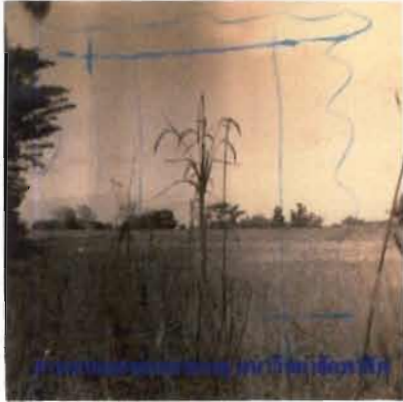
รูปกอข้าวแฮกในล้านนา

แหลวปักสี่มุมนา เป็นเครื่องหมายป้องกันภัยอันตรายอันจะเกิดกับต้นข้าวในช่วงเวลาดำนา 1 คำกล่าวแฮกนาของไทดำขอให้ต้นข้าวงามดีว่า “...ขวบปีมียาม สะปะปกلامซำดี เพื่อมันจั้น ชังป่าเหล่าเตงนา ชังป่าซ่าน ปางงว่าแดงเฮือน มานน้อย เหือด้อมานเลา มานเป่า เหือมันด้อมานกำ เตื่อ...” 2