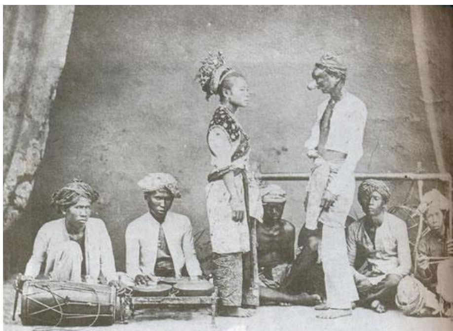
ภาพประกอบ ๑ การแสดงมะโย่งจังหวัดปัตตานี ในสมัยพระบาทสมเด็จพระจุลเกล้าอยู่หัว (รัชกาลที่ ๕)