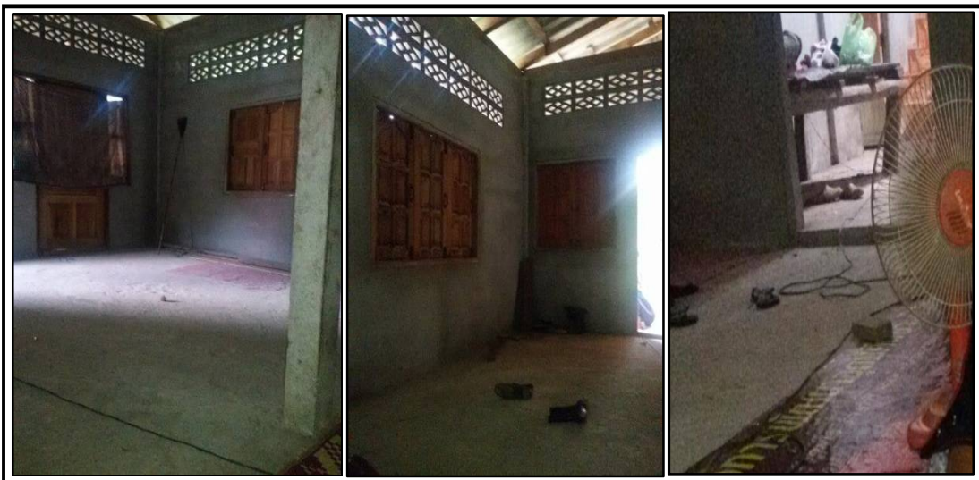
ภาพประกอบที่ ๑๑ แสดงสภาพบ้านที่ยังสร้างไม่เสร็จสมบูรณ์

คนในชุมชนโสร่งจะมีทรัพย์สินที่เป็นที่ดิน ไร่ นา สวนผลไม้ และสวนยางพารา และเป็นมรดกตกทอดสู่ลูกหลานหลายรุ่นด้วยกัน รุ่นลูกหลานบางคนที่ยังไม่มีบ้านเรือนอาศัยจะขายทรัพย์สินที่ก่อให้เกิดรายได้ โดยส่วนใหญ่ คือ สวนยางพารา เพราะขายง่าย มีราคาสูง เพื่อเป็นทุนในการสร้างบ้านที่อยู่อาศัย ทำให้ไม่มีแหล่งทำมาหากินเป็นของตนเอง ต้องรับจ้างกรีดยางในสวนยางพาราของคนอื่น และทำการเกษตรโดยปลูกพืชไร่ต่างๆในที่ดินของคนในชุมชนที่ใจบุญและหวังที่จะให้ความช่วยเหลือเพื่อเป็นทาน ทำให้พอมีรายได้เพื่อจุนเจือครอบครัวอยู่บ้าง แต่ไม่เพียงพอ ความผิดพลาดที่เกิดขึ้นนอกจากการขายทรัพย์สินที่ก่อให้เกิดรายได้เพื่อสร้างทรัพย์สินใหม่ที่ไม่ก่อให้เกิดรายได้แล้วซึ่งหมายถึงบ้าน ยังมีความผิดพลาดในเรื่องการให้ความสำคัญหรือการเน้นสัดส่วนของทรัพย์สินที่ไม่เกิดรายได้มากกว่า โดยมีการสร้างบ้านที่มีขนาดใหญ่เกินความจำเป็น จนทำให้งบประมาณในการสร้างบ้านไม่เพียงพอและไม่สามารถสร้างบ้านให้เสร็จสมบูรณ์ได้ ซึ่งพื้นบ้านอยู่ในสภาพที่ยังไม่เรียบร้อยไม่สามารถใช้สอยพื้นที่ได้อย่างสะดวกสบาย สายไฟฟ้ายังไม่สามารถเดินได้ทั่วบ้าน หลอดไฟฟ้าติดตั้งและใช้ได้บางส่วนที่บ้านเท่านั้น