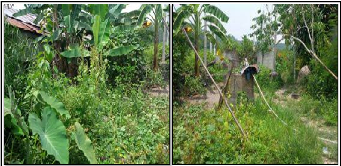
ภาพประกอบที่ ๙ แสดงที่ดินที่รกร้างสามารถทำการเกษตรได้

งานรับจ้างกรีดยางที่ประเทศมาเลเซียทั้งครอบครัว ซึ่งไปยังที่มีญาติพี่น้องและคนรู้จักจากเมืองไทยไปรับจ้างกรีดยาง โดยใช้เอกสารการเดินทาง คือหนังสือผ่านแดน (Border Pass) ในการเข้าประเทศมาเลเซีย โดยสามารถเข้าได้เฉพาะบางรัฐที่อยู่ใกล้กับประเทศไทยเท่านั้น แต่ก็ประสบปัญหาเช่นเดียวกัน คือ กลุ่มบุคคลที่ยึดอาชีพรับจ้างกรีดยางมีจำนวนมากและมากกว่าจำนวนที่เจ้าของสวนยางจะจ้างให้กรีดยาง เมื่อไม่ได้งานก็กลับบ้านและว่างงานเช่นเดิม นอกจากนี้แล้วช่วงเวลาในการทำงานกรีดยางอยู่ในช่วงเช้าโดยจะเริ่มต้นในเวลาประมาณ ๓ นาฬิกาหรือช่วงเช้าตรู่จนถึงเวลา ๗.๐๐ น. ซึ่งใช้เวลาประมาณ ๓-๔ ชั่วโมงต่อวัน เวลาที่เหลือบางคนก็จะไปปลูกพืชผักสวนครัวซึ่งเป็นการทำการเกษตรแบบยังชีพ (Subsistence Farming) เน้นผลผลิตเพียงเพื่อพอกินเป็นสำคัญ ไม่ใช่เพื่อการค้า ช่วงเวลานอกเหนือจากนี้ส่วนมากก็ได้ทำกิจกรรมอื่นใดที่ก่อให้เกิดรายได้ ซึ่งอาชีพหลักเป็นอาชีพที่ทำให้เกิดการว่างงานอยู่บ่อยๆ และยังปราศจากอาชีพเสริมอีกด้วย กล่าวคือใช้แรงงานไม่เต็มศักยภาพ โดยจากการลงพื้นที่และสังเกตการณ์ พบว่ามีการปล่อยให้ที่ดินของตนเองที่มีบ้างบริเวณหลังบ้านและสามารถสร้างรายได้ได้ให้กร้าง และไม่มีการพัฒนาใดๆ