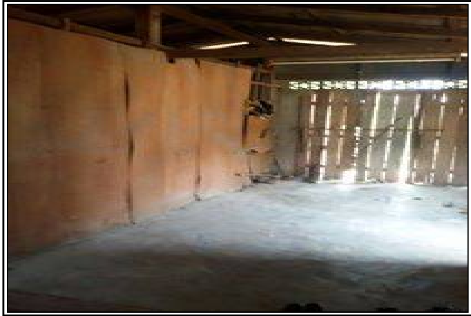
ภาพประกอบที่ ๑๐ แสดงการแบ่งสัดส่วนของบ้าน

ยากจนนั้นจะอยู่รวมกันในบ้านหลังเดียวกันโดยไม่มีทางเลือกอื่น เพราะยากจนและไม่มีบ้านที่อยู่อาศัยที่จะสามารถแยกครอบครัวออกต่างหากได้ จึงมาอาศัยรวมกันในบ้านเล็กๆที่มีพื้นที่น้อย บางครอบครัวได้แยกออกไปเช่าบ้านอยู่ แต่สุดท้ายแล้วมีรายได้ไม่เพียงพอและไม่สามารถจ่ายค่าเช่าบ้านได้ จึงกลับมาอยู่รวมกันในบ้านหลังเดียวกันโดยแบ่งสัดส่วนกันชัดเจน และไม่มีประตูเชื่อมต่อกัน