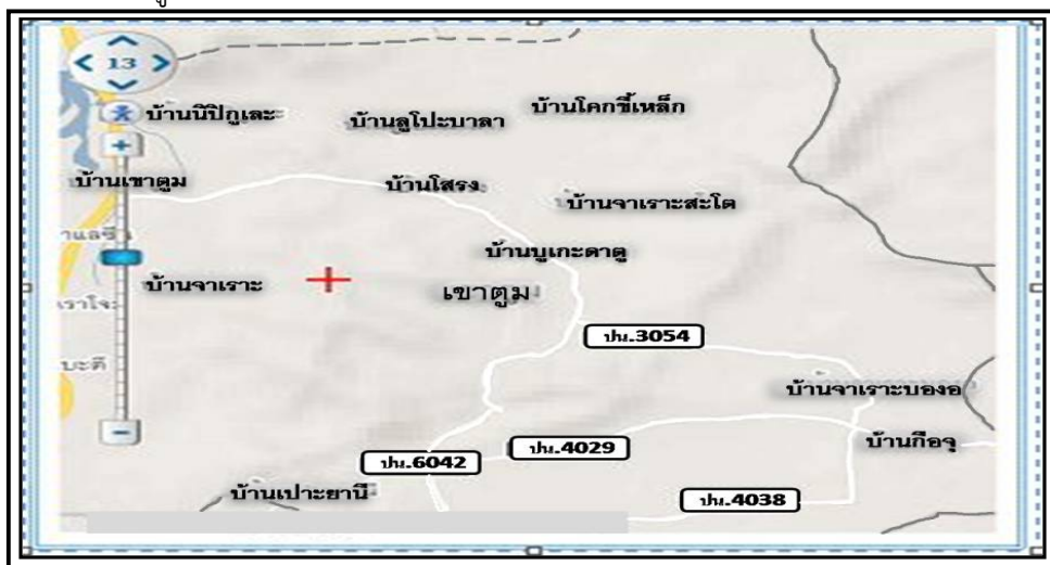
ภาพประกอบที่ ๑ แสดงแผนที่และที่ตั้งบ้านโสร่ง

ชุมชนโสร่งเป็นหมู่บ้านที่ตั้งอยู่หมู่ที่ ๓ ตำบลเขาตุ้ม อำเภอยะรัง จังหวัดปัตตานี ทำเลที่ตั้งของชุมชนโสร่งทิศเหนือจรดหมู่ ๔ บ้านจาเราะสโตร์ และหมู่ ๗ บ้านนิปีกูและ ทิศใต้จรดค่ายสิรินธร ทิศตะวันตกจรดหมู่ ๒ บ้านจาเราะ และหมู่ ๗ บ้านนิปีกูและ และทิศตะวันออก จรดหมู่ ๔ บ้านจาเราะสโตร์ และหมู่ ๕ บ้านจาเราะบองอ