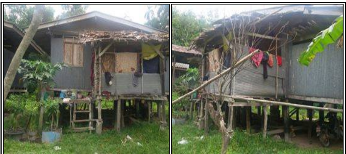
ภาพประกอบที่ ๕ แสดงสภาพบ้านที่อยู่อาศัยของคนจนในชุมชนโสร่ง (ภาพ: ผู้วิจัย)

โดยทั่วไปคนในชุมชนโสร่งรวมถึงคนจนด้วยจะมีบ้าน ที่อยู่อาศัยและที่ดินเป็นของตนเอง ถึงแม้ว่าสภาพบ้านเรือนของคนจนจะทรุดโทรม และไม่มั่นคงเท่าที่ควรก็ตาม เพราะเป็นบ้านที่สร้างด้วยไม้และสังกะสีซึ่งผุกร่อนไปตามกาลเวลา เป็นบ้านที่สร้างขึ้นมาเป็นระยะประมาณ ๑๕-๓๐ ปี โดยไม่มีการต่อเติมตัวบ้าน และการซ่อมแซมแต่อย่างใด