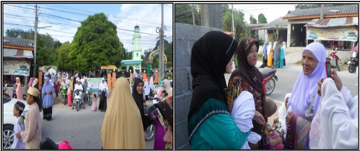
ภาพประกอบที่ ๒ แสดงบรรยากาศหลังละหมาดวันรายอ

สำหรับการศึกษาของคนในชุมชนนั้น เด็กและเยาวชนได้รับการศึกษาภาคบังคับทุกคน หมู่บ้านโสร่งยังเป็นที่ตั้งของมหาวิทยาลัยฟาฏอนี ซึ่งเป็นสถาบันอุดมศึกษาแห่งเดียวของอำเภอยะรัง และประชาชนบ้านโสร่งมีความปลอดภัยในชีวิตและทรัพย์สิน เนื่องจากมีโรงพักตั้งอยู่ภายในหมู่บ้าน มีองค์การบริหารส่วนตำบลตั้งอยู่ในพื้นที่หมู่ที่ ๓ บ้านโสร่งด้วย ทำให้ประชาชนมีความใกล้ชิดกับหน่วยงานของรัฐภาคท้องถิ่นมากขึ้น ส่วนครัวเรือนในหมู่บ้านโสร่งเป็นสมาชิกกลุ่มที่จัดตั้งขึ้นในหมู่บ้าน และมีส่วนร่วมในการแสดงความคิดเห็นเพื่อประโยชน์ของชุมชน และประชาชนบ้านโสร่งมีสุขภาพดี มีการไปตรวจสุขภาพอยู่เสมอ