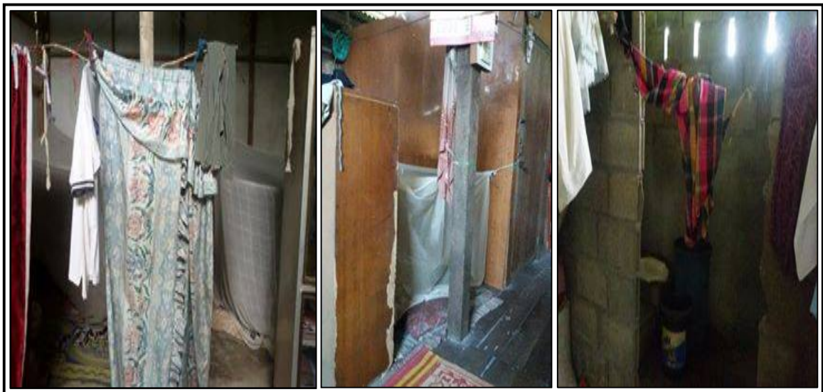
ภาพประกอบที่ ๖ แสดงสภาพภายในบ้านที่อยู่อาศัยของคนจนในชุมชนโสธร

ยกเว้นบางกรณีที่ได้รับการช่วยเหลือจากอาจารย์และนักศึกษาจากมหาวิทยาลัยฟาฏอนี เนื่องจากเป็นครอบครัวที่ขาดแคลนปัจจัยในการดำรงชีวิตเป็นอย่างมากและหลายด้านด้วยกันรวมทั้งด้านที่อยู่อาศัยด้วย เพื่อให้บ้านมีความมั่นคงมากขึ้น โดยทำการรื้อผนังและพื้นบ้านที่ผุพังออกแล้วก่ออิฐขึ้นมาแทนที่ เนื่องจากเดิมที่บ้านมีลักษณะยกพื้นทำด้วยไม้ ผุกร่อน ใกล้เคียงพังลงมา และไม่สามารถอาศัยอยู่ต่อไปได้ สำหรับบ้านของคนจนบางคนอยู่ในสภาพที่ดีแต่เป็นบ้านที่สร้างยังไม่เสร็จสมบูรณ์เนื่องจากเงินทุนไม่เพียงพอ ลักษณะภายในบ้านไม่มีการแบ่งสัดส่วนหรือกั้นเป็นห้องๆอย่างถาวร โดยเฉพาะห้องนอน ซึ่งเป็นการกั้นด้วยตุ้ หรือด้วยผ้ามา่าน และจะใช้ผ้ามา่านแทนประตู แม้กระทั่งห้องน้ำก็ไม่มีการประตู จะใช้ผ้ามา่านแทน