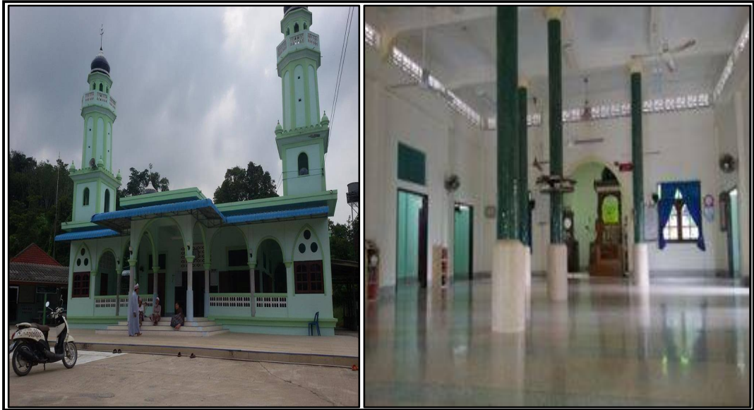
ภาพประกอบที่ ๓ แสดงภายนอกและภายในมัสยิดดารุลอามาน