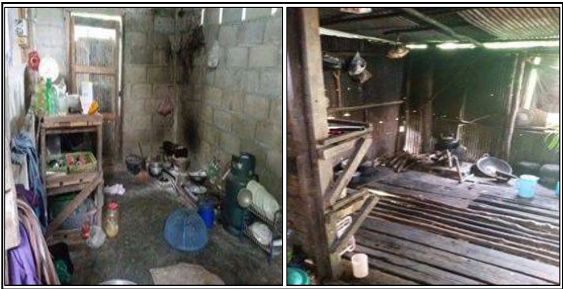
ภาพประกอบที่ ๗ แสดงสภาพภายในบ้านที่อยู่อาศัยของคนจนในชุมชนโสร่ง

ใช้เตาที่ใช้ไม้ฟืน ไม่ใช่เตาแก๊ส หม้อหุงข้าวไฟฟ้า และเครื่องใช้ไฟฟ้าแต่อย่างใด อย่างไรก็ตาม ส่วนใหญ่บ้านของคนจนในชุมชนโสร่งนั้นจะมีโทรทัศน์แม้ว่าไม่มีเตาแก๊ส หม้อหุงข้าวไฟฟ้าก็ตาม