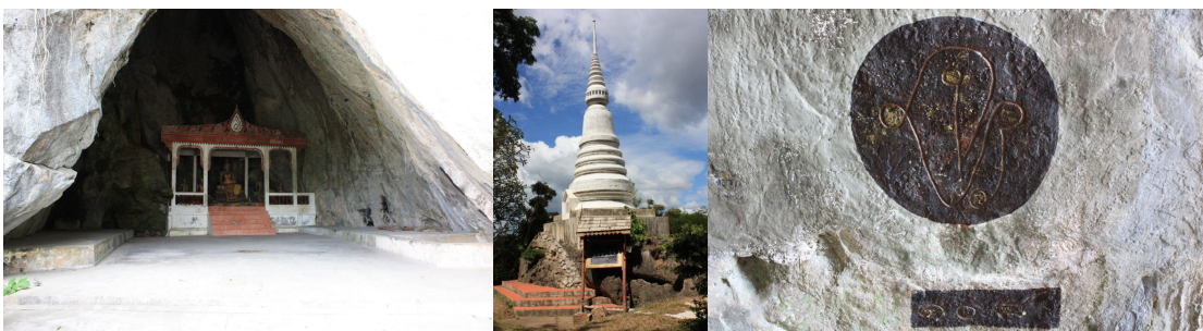
ภาพ ๒ สถานที่ท่องเที่ยวบริเวณถ้ำเขาเงิน

ถ้ำเขาเงิน อยู่ในบริเวณเดียวกับสวนสมเด็จพระศรีนครินทร์ นับเป็นโบราณสถานที่สำคัญ แห่งหนึ่งของจังหวัดชุมพร หน้าถ้ำมีเจดีย์ซึ่งรัชกาลที่ ๕ ทรงโปรดเกล้าฯ ให้สร้างขึ้นเมื่อครั้งเสด็จประพาส อำเภอลำสวนในปี ๒๔๓๒ บนผนังถ้ำมีพระปรมาภิไธยย่อ จ.ป.ร ระบุว่า "๑๐๘" ซึ่งหมายถึงปีที่เสด็จประพาส มลายู ภายในบริเวณถ้ำมีลักษณะเป็นห้องโถงคล้ายกระโจมขนาดใหญ่ที่มีปล่องทะลุถึงด้านบน ซึ่งเป็นด้านหลัง ของถ้ำรอยควายและเป็นที่ประดิษฐานพระบรมรูปจำลองของสมเด็จพระศรีนครินทราบรมราชชนนี สถานที่ แห่งนี้นับเป็นสถานที่สำคัญเชิงประวัติศาสตร์อีกแห่งหนึ่งที่นักท่องเที่ยวชอบไปเที่ยวชม ทั้งนี้เพราะหน่วยงาน ราชการและเอกชนได้ร่วมกันตกแต่งอาณาบริเวณไว้อย่างสวยงาม เมื่อมองจากในถ้ำเขาเงินก็จะเห็นพระเจดีย์ องค์ใหญ่ที่พระบาทสมเด็จพระจุลจอมเกล้าเจ้าอยู่หัวได้ทรงพระกรุณาโปรดเกล้าฯ ให้สร้างขึ้นเมื่อคราวเสด็จ ประพาสเมืองลำสวน ปัจจุบันได้รับการดูแลจากองค์การบริหารส่วนตำบลท่ามะปลา ควบคุมไปกับสวนสมเด็จพระ ศรีนครินทร์ ชุมพร ซึ่งอยู่ในบริเวณเดียวกัน นอกจากนี้เมื่อถึงวันแรม ๑ ค่ำ เดือน ๕ ทุกปี จะมีประเพณี ขึ้นถ้ำเขาเงิน ประชาชนในอำเภอลำสวนจะไปร่วมกันทำบุญที่บริเวณด้านหน้าของถ้ำเขาเงิน โดยนำอาหาร คาวหวานไปถวายพระ หลังจากนั้นจะมีพิธีปิดทองรดน้ำพระพุทธรูปและรดน้ำผู้สูงอายุ หลังเสร็จพิธีก็จะเป็น เวลาเที่ยวพอดิ ประชาชนจะไปหาสถานที่ที่มีร่มเงาบริเวณสวนสมเด็จพระศรีนครินทร์ ชุมพร เพื่อหาที่นั่ง รับประทานอาหารร่วมกัน นับว่าเป็นบรรยากาศที่สนุกสนานและประทับใจสำหรับประชาชนที่มาร่วมงาน