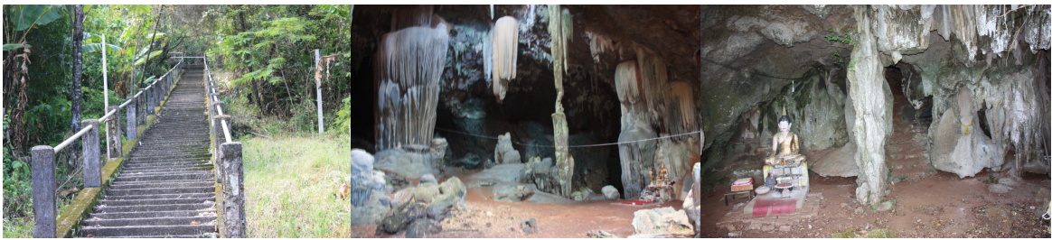
ภาพ ๓ สถานที่ท่องเที่ยวบริเวณถ้ำเขาเกรียบ

ถ้ำเขาเกรียบ ตั้งอยู่หมู่ที่ ๔ ตำบลบ้านควน เป็นถ้ำอีกหนึ่งถ้ำที่สวยงามที่สุดในภาคใต้ จากตัวเมืองชุมพรไปตามทางหลวงหมายเลข ๔ (ชุมพร-หลังสวน) ประมาณ ๘๕ กิโลเมตร หรือประมาณ ๒๒ กิโลเมตรจากอำเภอหลังสวน จากนั้นเลี้ยวซ้ายเข้าไปอีกประมาณ ๒ กิโลเมตร มีสำนักสงฆ์ถ้ำเขาเกรียบอยู่บริเวณเชิงเขาโดยมีบันไดขึ้นสู่ยอดเขาจำนวน ๓๗๐ ชั้น บริเวณยอดเขาเหมาะสำหรับเป็นที่ชมทัศนียภาพเมืองหลังสวน ส่วนภายในถ้ำมีพระพุทธรูปที่ผุดขึ้นมา มีหินงอกและหินย้อยสวยงามมาก มีซอกหลืบหลายช่องทาง บางแห่งทะลุขึ้นสู่ยอดเขา บางแห่งลึกลงสู่เบื้องล่างจนถึงพื้นน้ำของบริเวณเชิงเขาแห่งนี้