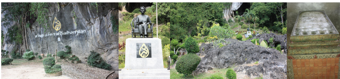
ภาพ ๑ สถานที่ท่องเที่ยวบริเวณสวนสมเด็จพระศรีนครินทร์ ชุมพร

สวนสมเด็จพระศรีนครินทร์ ชุมพร ตั้งอยู่หมู่ที่ ๗ ตำบลท่ามะปลา ห่างจากที่ว่าการอำเภอหลังสวนประมาณ ๗ กิโลเมตร ถ้ามาจากตัวเมืองชุมพรไปตามถนนเพชรเกษม ประมาณ ๖๒ กิโลเมตรถึงสี่แยกอำเภอหลังสวนเลี้ยวซ้ายตรงเข้าไปอีกประมาณ ๓ กิโลเมตร สวนสมเด็จพระศรีนครินทร์ ชุมพร สร้างขึ้นในปีพุทธศักราช ๒๕๒๓ ซึ่งเป็นปีที่สมเด็จพระศรีนครินทราบรมราชชนนี ทรงมีพระชนมพรรษา ครบ ๘๐ พรรษา เป็นสวนที่ตกแต่งด้วยไม้ดอกไม้ประดับได้อย่างสวยงามล้อมรอบถ้าเขาเงิน บริเวณทางเข้าปากถ้ามีพระปารมาภิไธยย่อ "สว" ของสมเด็จพระศรีนครินทราบรมราชชนนี ประดิษฐานอยู่ มีศาลาสร้างขึ้นเพื่อเป็นที่ประทับของสมเด็จพระศรีนครินทราบรมราชชนนี เมื่อเสด็จมาเยือนอำเภอหลังสวน บริเวณนี้จะมีฝูงลิงลงมาจากภูเขาและมีชาวบ้านนำเอาข้าวและกล้วยลงมาให้กิน ลิงไม่เคยทำอันตรายใครเพราะคุ้นเคยกับคน กินอิ่มแล้วก็กลับไปนั่งหรือโหนต้นไม้เล่นบนภูเขา เป็นที่ถูกใจของเด็กๆ มาก มีแม่น้ำหลังสวนซึ่งใสและสะอาดไหลผ่านฝั่งขวาของสวน ในฤดูแล้งปริมาณน้ำลดลงทำให้เกิดหาดทรายกว้างไกลสวยงามสะดุดตา ประชาชนนิยมนำครอบครัวไปพักผ่อน โดยนำอาหารที่เตรียมจากบ้านไปนั่งรับประทาน หลังจากนั้นก็จะลงเล่นน้ำกันอย่างสนุกสนาน