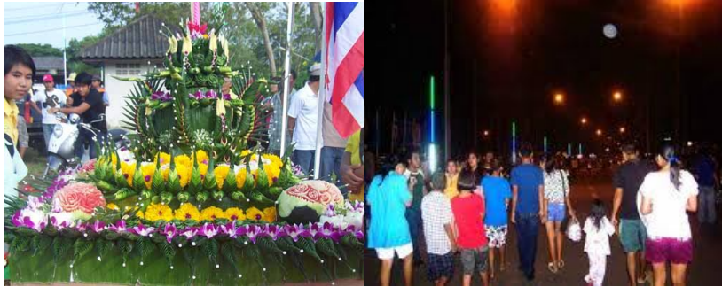
ภาพ ๑๑ บรรยากาศงานประเพณีลอยกระทงของอำเภอหลังสวน

ประเพณีลอยกระทงของอำเภอหลังสวน จัดขึ้นบริเวณริมฝั่งแม่น้ำหลังสวน ซึ่งมีหลายแห่งที่สำคัญได้แก่ บริเวณหลังเทศบาลเมืองหลังสวน วัดชลธารวดี วัดราชบูรณะ เทศบาลปากน้ำหลังสวน โดยมีกิจกรรมที่น่าสนใจ เช่น ขบวนแห่ทางบก ขบวนแห่ทางน้ำ การปิดเมืองกินฟรี การแสดงภาคกลางคืน การประกวดกระทง การประกวดนางนพมาศ เป็นต้น บรรยากาศของงานเต็มไปด้วยความสนุกสนาน