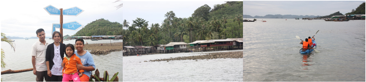
ภาพ ๕ สถานที่ท่องเที่ยวบริเวณเกาะพิทักษ์

เกาะพิทักษ์ ตั้งอยู่ตำบลบางน้ำจืด เป็นเกาะขนาดเล็ก ที่มีโขดหินสวยงามและมีหมู่บ้านชาวประมงกระจายอยู่รอบเกาะ ในอดีตชาวบ้านเรียกว่า "เกาะผีทัก" มีเรื่องเล่าต่อกันมาว่า มีเรือประมงลอยเรือหาปลาไปยังเกาะพิทักษ์และมองเห็นชาวบ้านบนเกาะกักมือเรียก แต่พอเข้าไปยังเกาะกลับไม่มีชาวบ้านอาศัยอยู่บนเกาะเลยแม้แต่คนเดียว ทางทิศตะวันออกมีหาดทรายขนาดเล็ก ด้านหลังเกาะมีจุดชมวิวสูงประมาณ ๒๐๐ เมตร หากวันนี้น้ำทะเลลดระดับสามารถเดินทางข้ามฟากมายังเกาะได้หรือเลือกโดยสารเรือจากท่าเรืออ่าวท้องครกข้ามมายังเกาะก็เป็นอีกวิธีหนึ่งที่สะดวก ชาวบ้านบนเกาะได้จัดกิจกรรมท่องเที่ยวแบบโฮมสเตย์เป็นการท่องเที่ยวเชิงอนุรักษ์ไว้คอยบริการ นอกจากนี้ในช่วงเดือนมิถุนายนของทุกปีจะมีงานวิ่งแหวกทะเลสู่เกาะพิทักษ์โดยการวิ่งลุยน้ำแหวกทะเลเข้าเส้นชัยบนเกาะพิทักษ์ ซึ่งแต่ละปีจะมีนักท่องเที่ยวชาวต่างชาติมาร่วมวิ่งเป็นจำนวนมาก