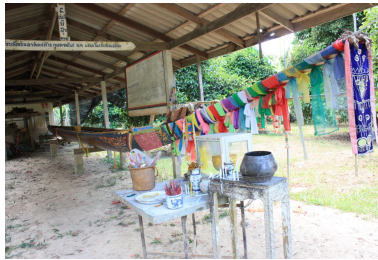
ภาพ ๑๓ เรือนางลำภู

โดยมีฝีพายเป็นชาวบางหมาก อำเภอเมือง จังหวัดชุมพร ต่อจากนั้น ชาวบางลำพูเป็นผู้พายเอง ตั้งแต่ปี พ.ศ. ๒๕๑๑-๒๕๑๕ เรือนางลำภูสามารถครองโล่พระราชทาน ๖ ปีติดต่อกัน หลังจากก็ไม่ได้ส่งเข้าแข่งขันเป็นเวลา ๑๐ ปี จนถึงปี พ.ศ. ๒๕๒๗ เป็นต้นมา จึงได้ส่งเข้าทำการแข่งขัน สำหรับชื่อนางลำภูนั้น จอมพลประภาส จารุเสถียร อดีตผู้บัญชาการทหารบก เป็นผู้ตั้งให้