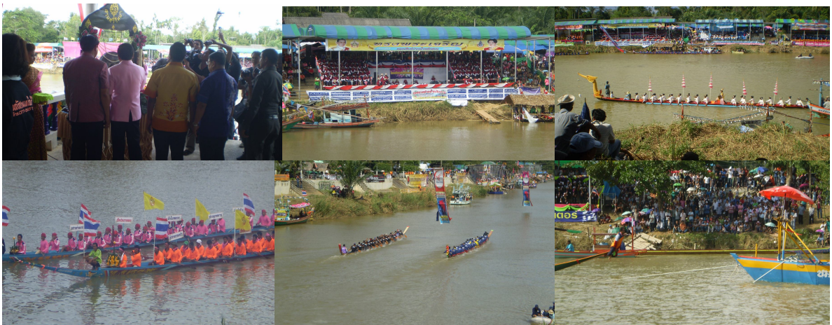
ภาพ ๑๖ บรรยากาศกิจกรรมแข่งเรือ

ในแต่ละวันของงานประเพณีแห่พระแข่งเรือยาว อำเภอหลังสวน จังหวัดชุมพร สองฟากฝั่งของแม่น้ำหลังสวนจะเนืองแน่นไปด้วยผู้คนจนแทบจะไม่มีที่ว่างให้เปียดแทรก ทั้งจากต่างอำเภอและต่างจังหวัดเพื่อมาร่วมชมการแข่งขันเรือยาวอันเป็นเอกลักษณ์ทางวัฒนธรรมของอำเภอหลังสวน