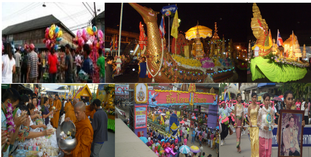
ภาพ ๑๕ บรรยากาศกิจกรรมทางบก

(ในบางปี คณะกรรมการจัดงานได้จัดให้มีงานเปิดเมืองกินฟรี ในเย็นวันขึ้น ๑๕ ค่ำ เดือน ๑๑ โดยจะมีประชาชน ร้านค้า บริษัทห้างร้าน ในอำเภอหลังสวน จะจัดทำอาหารคาวหวาน นำออกมาตั้งเป็นซุ้มอาหารสองข้างถนนในย่านธุรกิจการค้า ตั้งแต่บริเวณตลาดสดเทศบาลเมืองหลังสวน ไปจนถึงที่ทำการไปรษณีย์หลังสวน ระยะทางประมาณ ๑.๒ กิโลเมตร พร้อมมีเวทีการแสดงเป็นระยะๆ กิจกรรมนี้เริ่มมีครั้งแรกในปี พ.ศ. ๒๕๔๗)