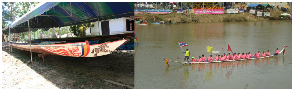
ภาพ ๑๒ เรือมะเขือย่า