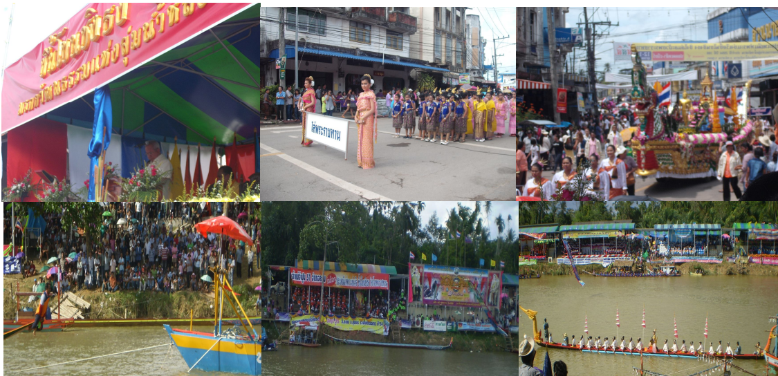
ภาพ ๘ กิจกรรมต่างๆ ในงานประเพณีแห่พระแข่งเรือยาวอำเภอหลังสวน

การแข่งขันเรือยาวของอำเภอหลังสวน จังหวัดชุมพร นับว่าเป็นการแข่งขันที่มีความตื่นเต้นเร้าใจเป็นเอกลักษณ์เฉพาะตัว เรือที่ครองชนะเลิศ นอกจากจะมาจากความพร้อมเพรียงของฝีพายแล้ว ยังขึ้นอยู่กับความสามารถของ “นายท้ายเรือ” และ “นายหัวเรือ” อีกด้วย นายท้ายเรือจะต้องถือท้ายเรือให้ตรงเพื่อให้ นายหัวเรือ “ขึ้นโขนชิงธง” ที่ทุ่นเส้นชัย แม้ว่าเรือลำใดจะนำหน้าอยู่ก็ตาม หากนายหัวเรือขึ้นโขนแล้วคว่ำธงผิด หรือความธงได้ แต่ตกน้ำ หรือเรือล่มก่อนที่ท้ายเรือจะพ้นปากกระบอกธงชัย ก็จะต้องเป็นแพ้ ความเร็วของเรือ จึงไม่ใช่ปัจจัยชี้ขาดของความเป็น ผู้ชนะแต่อย่างใด นายหัวเรือจะต้องกะจังหวะขึ้นโขน และจะต้องขึ้นไปให้สุดปลายโขน เพื่อความได้เปรียบในการจับธงนายหัวเรือลำใดจับธงได้ เรือลำนั้นเป็นผู้ชนะในเที่ยวนั้น แต่ถ้าความเร็วของเรือคู่กัน นายหัวเรือจับธงพร้อมกัน และสามารถดึงธงไปได้คนละท่อน ถือว่าเสมอกัน และถ้าจับธงไม่ได้ก็จะถือว่าแพ้ ดังนั้นจะเห็นได้ว่า การขึ้นโขนชิงธงจึงเป็นทั้ง “ศาสตร์” และ “ศิลป์” ที่จะหาจุดได้เฉพาะที่สนามแข่งเรือ ณ แม่น้ำหลังสวน อำเภอหลังสวน จังหวัดชุมพร เพียงแห่งเดียวในประเทศไทย