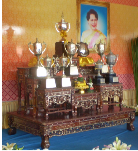
ภาพ ๑๔ โล่และถ้วยพระราชทาน

๗. พระเจ้าหลานเธอพระองค์เจ้าทีปังกรรัศมีโชติ ประทานถ้วยรางวัล “ชนะเลิศกองเชียร์ริมฝั่ง (พลังมวลชน)”