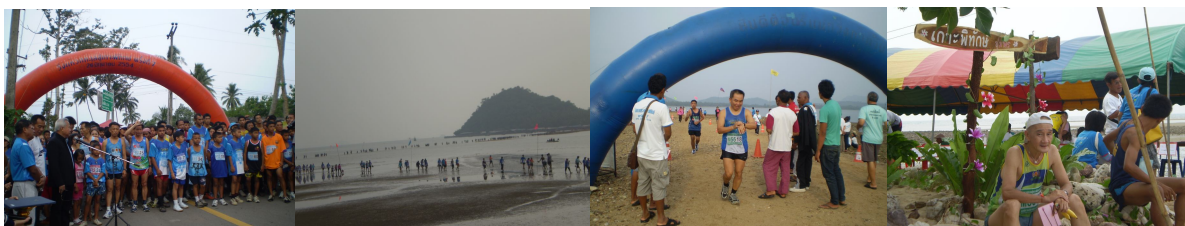
ภาพ ๑๐ บรรยากาศการแข่งขันวิ่งแหวกทะเลสู่เกาะพิทักษ์

การแข่งขันวิ่งแหวกทะเลสู่เกาะพิทักษ์ "หนึ่งในสยาม ..ลุยน้ำแหวกทะเลเข้าสู่เส้นชัยบนเกาะพิทักษ์" จัดขึ้นในช่วงเดือนมิถุนายน ของทุกปี โดยจัดแข่งขัน ๒ ประเภท ได้แก่ วิ่งมินิมาราธอน ๑๐.๐ กิโลเมตร และเดิน-วิ่ง Fun Run ๒.๕ กิโลเมตร การแข่งขันแบ่งเป็นหลายช่วงอายุ และแยกประเภทหญิง ชาย สถานที่แข่งขัน เริ่มต้นจากเรือจำลองจักรีนฤเบศร ปากน้ำหลังสวน ถึง เกาะพิทักษ์ ตำบลบางน้ำจืด (เส้นทางถนนลาดยางเลียบบายทะเล) ในแต่ละปีมีนักท่องเที่ยวทั้งคนไทยและชาวต่างชาติมาร่วมแข่งขันเป็นจำนวนมาก เอกลักษณ์ของการวิ่งแหวกทะเลสู่เกาะพิทักษ์ต่างจากการวิ่งมินิมาราธอนทั่วไปตรงที่ เป็นการวิ่งลงไปในทะเลเพื่อมุ่งสู่เกาะพิทักษ์ซึ่งเกาะขนาดเล็ก ที่มีโขดหินสวยงามและมีหมู่บ้านชาวประมงกระจายอยู่รอบเกาะ ในแต่ละปีผู้ที่กำหนดวันจัดงานจะต้องคำนวณน้ำขึ้นน้ำลงให้ดีเพื่อให้ทั้งวิ่งสามารถวิ่งแหวกทะเลไปได้โดยไม่จมน้ำ กิจกรรมเริ่มตั้งแต่เช้าตรู่ ประมาณ ๐๕.๐๐ น. มีพิธีเปิดและพิธีปล่อยตัวนักวิ่ง ๒ จุด คือ จุดวิ่งมินิมาราธอน ๑๐.๐ กิโลเมตร เริ่มต้นจากเรือจำลองจักรีนฤเบศร ปากน้ำหลังสวน ถึง เกาะพิทักษ์ ตำบลบางน้ำจืด และจุดเดิน-วิ่ง Fun Run ๒.๕ กิโลเมตร เริ่มต้นจากบริเวณสามแยกบ้านท้องครก ถึง เกาะพิทักษ์ เมื่อถึงเกาะพิทักษ์นักวิ่งจะได้รับประทานอาหารกลางวันฟรี หลังจากนั้นก็จะเป็นพิธีมอบโล่รางวัลให้แก่ักวิ่งที่ชนะเลิศในประเภทต่างๆ