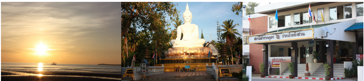
ภาพ ๔ สถานที่ท่องเที่ยวบริเวณหาดแหลมสน

หาดแหลมสนตั้งอยู่หมู่ที่ ๓ ตำบลปากน้ำ อยู่ห่างจากที่ว่าการอำเภอหลังสวนประมาณ ๑๓ กิโลเมตร เป็นถนนลาดยางสามารถเดินทางได้สะดวกสบาย สำหรับนักท่องเที่ยวที่มาเที่ยวเป็นกลุ่มทัวร์สามารถเดินทางมาได้ทุกฤดู หาดแหลมสนนับว่าเป็นชายหาดทางฝั่งตะวันออกของอ่าวไทยที่มีวิวทิวทัศน์สวยงาม มีหาดทรายสีขาวและที่นี่ยังเหมาะอย่างยิ่งที่จะตั้งแคมป์สำหรับดูนก เพราะเป็นแหล่งที่อยู่อาศัยของนกนานาชนิด ในบริเวณหาดแหลมสน มีวัดแหลมสนซึ่งเป็นวัดเล็กๆ ที่เก่าแก่และสำคัญของชาวพุทธในแถบชายทะเลปากน้ำหลังสวน เมื่อมีเทศกาลต่างๆ หรือวันสำคัญในพระพุทธศาสนาก็จะเป็นที่ปฏิบัติธรรมของผู้ที่สนใจในพระพุทธศาสนา นอกจากนี้ยังเป็นที่ตั้งของสถานีตำรวจภูธรปากน้ำหลังสวนคอยอำนวยความสะดวกและความปลอดภัยแก่ประชาชนและนักท่องเที่ยว