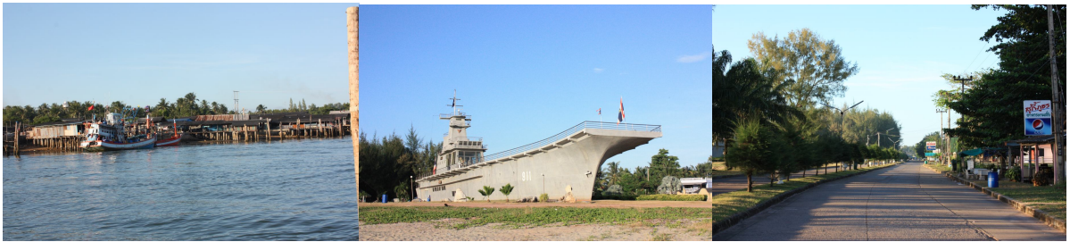
ภาพ ๗ สถานที่ท่องเที่ยวบริเวณปากน้ำหลังสวน

ปากน้ำหลังสวน ตั้งอยู่ตำบลปากน้ำและเป็นที่ตั้งของเทศบาลปากน้ำหลังสวน ห่างจากที่ว่าการอำเภอหลังสวนไปประมาณ ๑๑ กิโลเมตร เป็นหมู่บ้านชาวประมง เมื่อถึงตลาดปากน้ำหลังสวนจะมีถนนตัดเลียบชายหาดไปตลอดจนถึงตำบลบางน้ำจืด มีชายหาดทอดเป็นแนวยาวหลายกิโลเมตรซึ่งเป็นที่ตั้งของเรือจำลองจักรีนฤเบศร์ ด้านบนเป็นที่ประดิษฐานพระบรมรูปจำลองเสด็จกรมหลวงชุมพรเขตอุดมศักดิ์ บริเวณใต้ท้องเรือเป็นที่ตั้งของสำนักงานเพื่อดูแลสถานที่สำคัญแห่งนี้ พระบรมรูปจำลองเสด็จกรมหลวงชุมพรเขตอุดมศักดิ์ เป็นที่เคารพนับถือของประชาชนในอำเภอหลังสวนและประชาชนทั่วไป นับได้ว่าสถานที่แห่งนี้ช่วยยึดเหนี่ยวจิตใจของคนในรุ่นปัจจุบันให้มีความรักและเทิดทูนบูชาต่อบรรพบุรุษซึ่งได้ทำคุณประโยชน์ไว้ให้แก่แผ่นดินมากมาย นอกจากนี้ ริมชายหาดมีรีสอร์ตและร้านอาหารทะเลตั้งอยู่เป็นระยะ ปากน้ำหลังสวนเป็นแหล่งร้านอาหารทะเลที่อร่อยและราคาอย่างเอร็ดอร่อย เป็นที่ตั้งของแหล่งรับซื้ออาหารทะเลจากชาวประมง มีผลผลิตจากทะเลที่มีชื่อเสียง เช่น กะปิ ปลาเค็ม กุ้งแห้ง เป็นต้น นักท่องเที่ยวสามารถพักผ่อนและทำกิจกรรมท่องเที่ยวได้หลายอย่างเช่น เล่นน้ำ ปั่นจักรยานเที่ยวตลาดน้ำ เช่าเรือเที่ยวเกาะพิทักษ์ และที่นี่ยังมีรีสอร์ตพร้อมสิ่งอำนวยความสะดวกให้แก่แก่นักท่องเที่ยวมากมาย