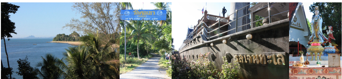
ภาพ ๖ สถานที่ท่องเที่ยวบริเวณหาดคอเขา

หาดคอเขา ตั้งอยู่ที่ตำบลนาพญา อำเภอหลังสวน ตามถนนเลียบชายหาดจากปากน้ำหลังสวนไปอำเภอละแมประมาณ ๑๐ กิโลเมตร เป็นหาดทรายยาวกว้างขวาง สวยงาม สะอาด และเงียบสงบเหมาะสำหรับนักท่องเที่ยวที่ชอบธรรมชาติและทะเล หาดทรายกว้างเล่นน้ำได้ยาวไปจนถึงเนินเขา ที่เชิงเขาริมทะเลเป็นโขดหิน ถัดจากหาดเป็นภูเขาที่ปกคลุมด้วยต้นไม้ใหญ่ มีศาลกรมหลวงชุมพรเขตอุดมศักดิ์สร้างบนเรือรบหลวงเจนทะเล ซึ่งเป็นเรือจำลอง นอกจากนี้ยังมีวัดคอเขาเป็นที่ประดิษฐานรูปปั้นพระโพธิสัตว์กวนอิมขนาดใหญ่