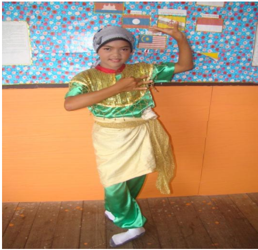
ภาพที่ ๓ ร่ายรำทำอินทรีย์(แลลาแย)