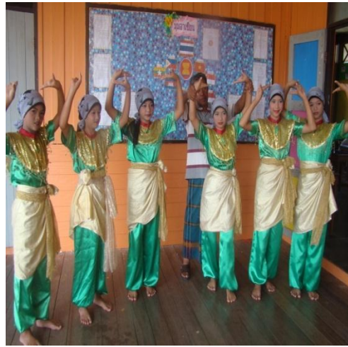
ภาพที่ ๔ ร่ายรำทำพระรามณ์เดิน(สฆามอ)