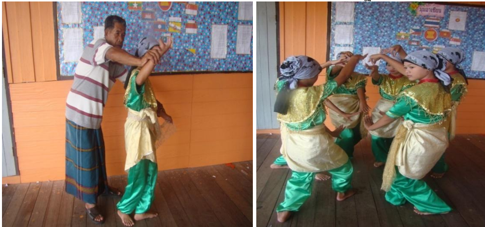
ภาพที่ ๒ (สตายม) หรือ ทำร้ายมาตรฐาน

และสำหรับเครื่องแต่งกายนักดนตรีประกอบด้วย ชุดนักดนตรีสลิเนน หรือผ้าพันรอบเอวมวกคลุมเข็มขัดผ้ารัดเอว ส่วนวิธีการรำจะประกอบด้วย การไหว้ครู มีลักษณะ ๒แบบ ด้วยกัน คือการไหว้ครูแบบยาวและแบบสั้นรำรำทำเป็นรูปวงกลม (สตายม)