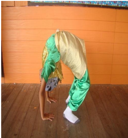
ภาพที่ ๗ สะพานโค้ง