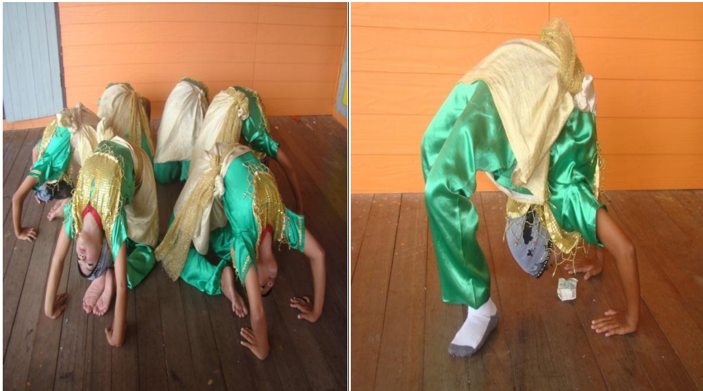
ภาพที่ ๑๓ การทำท่าสะพานโค้งหยิบเหรียญและธนบัตร

สำหรับที่มาที่ไปตารีอีนาเริ่มแรกมาจากเจ้าสาวให้ใส่ “เฮนน่า” แล้วอยู่บนบันลั้งก์ ให้คนมารำ “ตารี” รอบบันลั้งก์ จึงมีการเรียก “ตารีอีนา”