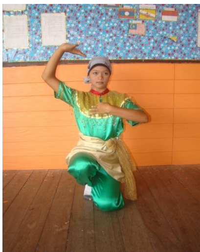
ภาพที่ ๑๑ ตารีแล