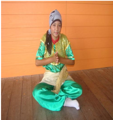
ภาพที่ ๙ ลาเกาะชือเมาะ