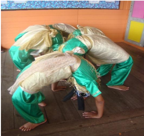
ภาพที่ ๕ (ตารี่ฆาฆะ) หรือ ตั้งหลักทำยีน