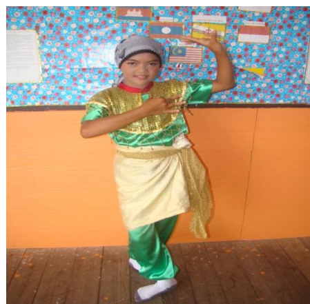
ภาพที่ ๖ (สือรามอ)ทำพญาหงส์