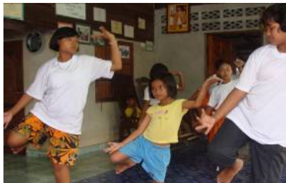
ภาพที่ ๑๘ การแสดงของคณะนักแสดงก่อนการพัฒนา

๒.๔ ปัญหาด้านทุนทรัพย์ในการจัดหาเครื่องแต่งกายสำหรับใส่แสดง เนื่องจากเครื่องแต่งกายมโนราห์แต่ละชุดมีราคาสูง คือประมาณ ๑๒,๐๐๐ บาท เนื่องจากชุดมโนราห์มีองค์ประกอบหลายชิ้นส่วน ซึ่งต้องทำด้วยวัสดุที่มีราคาสูง เช่น เสื้อต้องร้อยด้วยลูกบิดหลากสี ซึ่งถึงแม้ว่านักแสดงหรือพ่อแม่ผู้ปกครองยินดีให้บุตรหลานที่เป็นนักแสดงใส่ชุดมโนราห์สำหรับรับแสดง ก็ยังคงประสบปัญหาด้านการจัดหางบประมาณสำหรับจัดให้กับคณะผู้แสดง