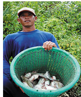
ภาพที่ ๑๐ การทำประมงแบบพื้นบ้านในการจับสัตว์น้ำ