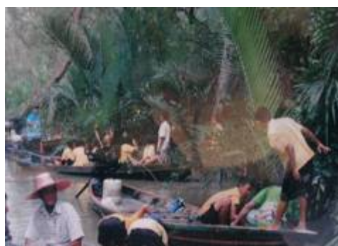
ภาพที่ ๑๓ กลุ่มผู้ศึกษาดูงานจากชุมชนอื่น

ซึ่งหากพิจารณาในแง่ของจำนวนนักท่องเที่ยวแล้ว นับได้ว่ากลุ่มชุมชนลิเล็ดนำเที่ยว เพื่อการอนุรักษ์ ประสบความสำเร็จเป็นอย่างดี ทั้งนี้ เนื่องจากการที่นักท่องเที่ยวจากสถานที่ต่าง ๆ ได้มาสัมผัสความเป็นตำบลลิเล็ดในแง่มุมต่าง ๆ แล้วเกิดความประทับใจในหลายด้าน โดยเห็นได้จาก บันทึกที่นักท่องเที่ยวได้เขียนไว้ในสมุดการบันทึกความรู้สึกลงในการเข้าพัก “โฮมสเตย์”