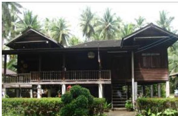
ภาพที่ ๑๑ บ้านพักแบบโฮมสเตย์และป้ายรับรองมาตรฐาน