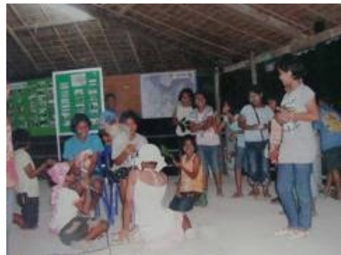
ภาพที่ ๑๖ การแสดง และฝึกหัดมโนราห์และลิเกป่าของเยาวชนตำบลลีเล็ด