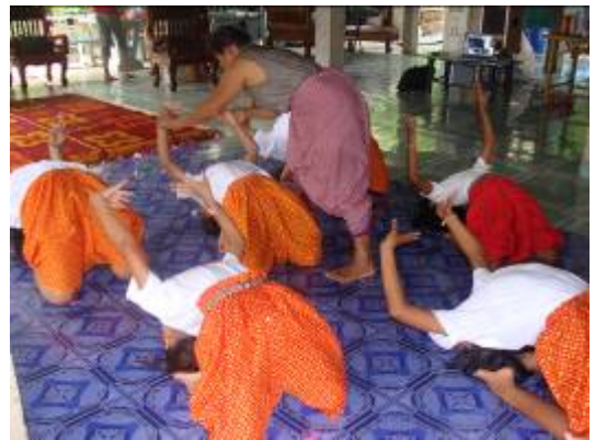
ภาพที่ ๒๒ วิทยากรที่เชิญมาให้ความรู้

๑.๓ การหัดรำมนโนราห์ทำมาตรฐาน โดยวิทยากรได้ให้คณะนักแสดงที่แสดงเป็นอยู่แล้ว แสดงการรำให้วิทยากรดูหลังจากนั้น วิทยากรได้เริ่มให้ผู้เข้ารับการอบรมหัดรำแต่ละท่ามาตรฐานทีละท่าให้มีความถูกต้อง สวยงาม ตามแบบฉบับของการแสดงมโนราห์ที่ถ่ายทอดมาตั้งแต่โบราณ เมื่อผู้เข้ารับการอบรมเริ่มรำได้อย่างสวยงาม และพร้อมเพรียงขึ้น วิทยากรได้ให้นักแสดงเปลี่ยนเป็นชุดที่สำนักงานวัฒนธรรมจังหวัดได้จัดเตรียมให้ และแต่งหน้าให้สวยงาม และให้รำเหมือนกับการแสดงจริง นักแสดงแต่ละคนมีความตั้งใจในการรำมาก และสามารถรำได้อย่างสวยงามและพร้อมเพรียงกัน ซึ่งวิทยากรได้ชี้แจงให้ทุกคนทราบว่า การแต่งชุดเป็นสิ่งสำคัญเนื่องจากการที่ผู้แสดงได้แต่งชุด จะมีความรู้สึกร่วมกับชุดที่ใส่ เสมือนสวมวิญญาณของชุดที่ใส่ไว้ ซึ่งจะทำให้มีความตั้งใจในการแสดงมากขึ้น