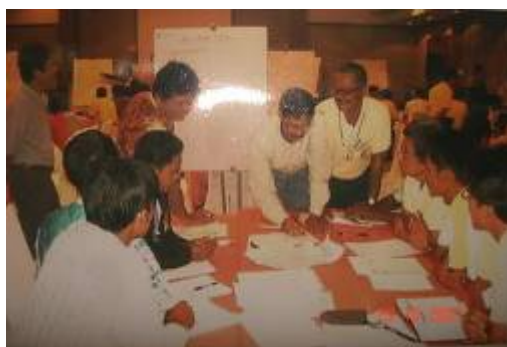
ภาพที่ ๗ การจัดทำแผนแม่บทชุมชน ของกลุ่มแกนนำ