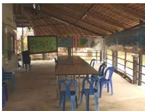
ภาพที่ ๘ ที่ทำการกลุ่มชุมชนลีเล็ดนำเที่ยวเพื่อการอนุรักษ์