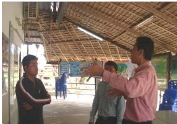
ภาพที่ ๔ คณะวิจัยลงพื้นที่สอบถามข้อมูลจากประธานกลุ่มชุมชนลิเล็ดนำเที่ยวเพื่อการอนุรักษ์