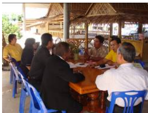
ภาพที่ ๑๕ คณะวิจัยร่วมหารือกับผู้เกี่ยวข้องเพื่อกำหนดแนวทางการพัฒนา

ผลการระดมความคิดเห็นปรากฏว่าผู้เกี่ยวข้องได้กำหนดแนวทางในการพัฒนาการนำสื่อมโนราห์มาใช้ส่งเสริมการจัดการท่องเที่ยว เป็น ๓ ระยะ ประกอบด้วย