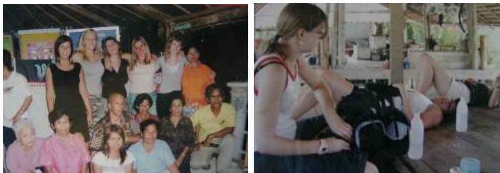
ภาพที่ ๑๒ นักท่องเที่ยวที่เดินทางมาท่องเที่ยวในตำบลลิเล็ด

๒) กลุ่มนักศึกษาด้านนิเวศวิทยา และสังคมศาสตร์ ซึ่งมีนักศึกษาทั้งต่างชาติ จากกลุ่มสหภาพยุโรป และกลุ่มนักศึกษาในประเทศที่ต้องการศึกษาข้อมูลเกี่ยวกับการจัดการป่าชายเลน และการจัดการชุมชน ซึ่งจะเดินทางเข้ามาพักครั้งละหลายวัน