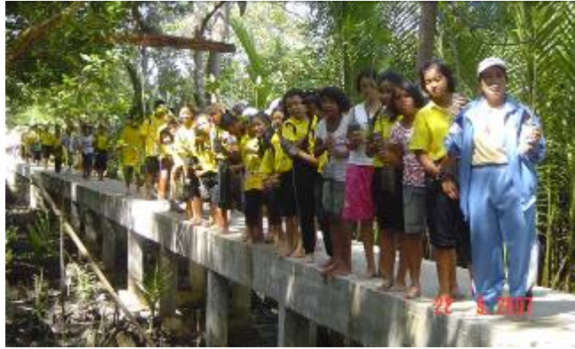
ภาพที่ ๑๔ เส้นทางการศึกษาธรรมชาติที่ได้รับงบประมาณสนับสนุน

๓.๔ ด้านการจัดการทรัพยากรชายฝั่ง การดำเนินการของชุมชนลีเล็ด สามารถแก้ไขปัญหาการทำลายทรัพยากรชายฝั่งได้เป็นอย่างดี เนื่องจากสามารถสร้างความตระหนักและการมีส่วนร่วมโดยใช้กระบวนการจัดการท่องเที่ยว เพื่อเป็นรายได้เสริมให้คนในชุมชนอีกทางหนึ่ง การจัดการท่องเที่ยวโดยชุมชนจึงกลายเป็นส่วนผสมที่ลงตัวของการบูรณาการ และจัดการอนุรักษ์ทรัพยากรชายฝั่งที่ลงตัวเป็นอย่างยิ่ง ผลจากการดำเนินการซึ่งเห็นเป็นรูปธรรมอย่างชัดเจนในช่วงระยะเวลา ๑ ปี ที่ผ่านมา ปรากฏผลอย่างเป็นรูปธรรม คือ