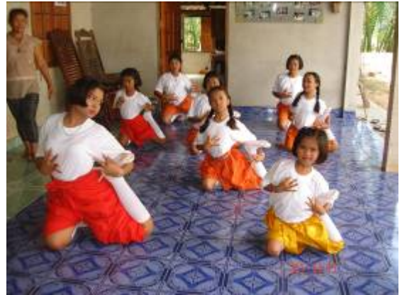
ภาพที่ ๒๓ การฝึกกรรมโนราห์ก่อนเสร็จสิ้นการอบรม

๒. ด้านข้อเท็จจริงที่เกิดขึ้นจากการอบรม คณะผู้วิจัยได้ใช้แบบสังเกตรวบรวมข้อมูล ผลการจัดอบรมปรากฏผลดังนี้