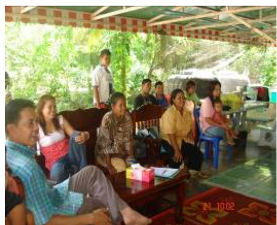
ภาพที่ ๒๑ ผู้ปกครองและผู้เกี่ยวข้องที่ร่วมการจัดกิจกรรม