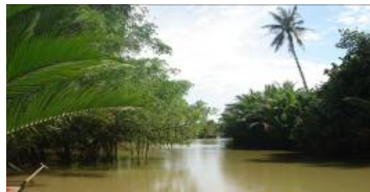
ภาพที่ ๕ สภาพลำบางในตำบลลีเล็ด

- การทำประมงแบบพื้นบ้าน เนื่องจากอาชีพการประมงดั้งเดิม เป็นการประมงที่ไม่ทำลายธรรมชาติ และปัจจุบันมีผู้ทำประมงแบบพื้นบ้านน้อย ผู้คนจากที่อื่นไม่เคยเห็น จึงเป็นที่น่าสนใจของนักท่องเที่ยว เช่น การวางเบ็ดราว วางราไว แร้วปู ขุดปู ทอดแหลูกสา ถีบกระดานหา หอย ฯลฯ ซึ่งเครื่องมือเหล่านี้ ยังสามารถจับสัตว์น้ำได้ เนื่องจากความอุดมสมบูรณ์ของสายน้ำ ในพื้นที่แห่งนี้ยังมีอยู่ การออกจับสัตว์น้ำใช้เรือแจวและเรือพาย