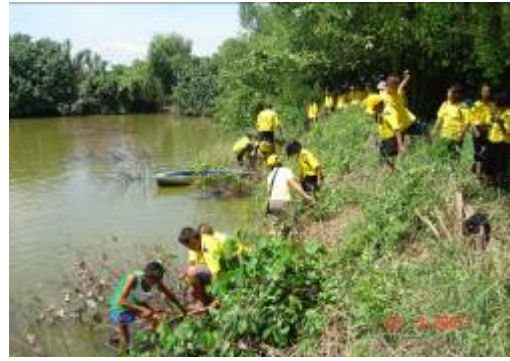
ภาพที่ ๑๕ การจัดอบรมเยาวชนในพื้นที่ของกลุ่มลีเล็ดนำเที่ยวเพื่อการอนุรักษ์

๓.๖ การเพิ่มขึ้นของรายได้ ผลจากการที่ชุมชนสามารถร่วมกันอนุรักษ์ทรัพยากรชายฝั่ง และสามารถพัฒนาชุมชนให้เป็นแหล่งท่องเที่ยว ส่งผลให้ประชาชนในพื้นที่มีรายได้เพิ่มขึ้นจากจับสัตว์น้ำ เนื่องจากสภาพแวดล้อมมีความอุดมสมบูรณ์ขึ้น ส่งผลให้สัตว์น้ำขยายพันธุ์ และเจริญเติบโตดีขึ้น นอกจากนี้เป็นรายได้จากการจัดการท่องเที่ยว ทั้งรายได้จากการจัดที่พัก อาหาร และการจำหน่ายผลิตภัณฑ์ในชุมชน