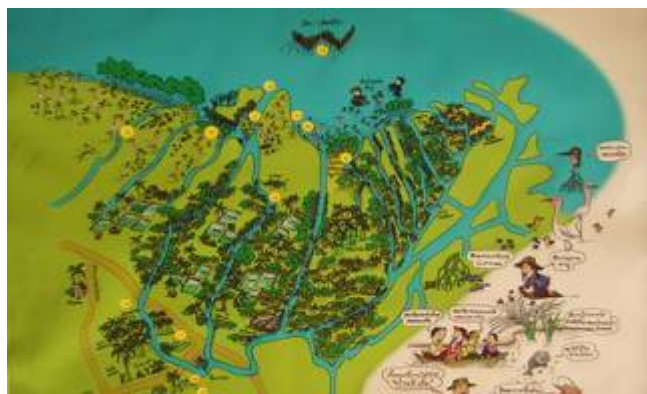
ภาพที่ ๕ แผนที่แสดงสภาพพื้นที่ของตำบลลิเล็ด

๑.๑ ปัญหาที่นำไปสู่การเปลี่ยนแปลงทางสิ่งแวดล้อม ตำบลลิเล็ดตั้งอยู่ในพื้นที่ซึ่งมีความอุดมสมบูรณ์หลายด้าน เนื่องจากเป็นพื้นที่ราบชายฝั่งมีลำคลอง ลำบาง จำนวนมากไหลผ่านส่งผลให้มีพื้นที่ที่มีความอุดมสมบูรณ์ เหมาะสมกับการเพาะปลูก และจับสัตว์น้ำสำหรับเป็นอาหารและสร้างรายได้ให้กับประชากรในพื้นที่