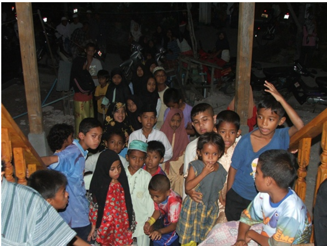
บรรยากาศของเด็กๆ ที่มาร่วมงาน