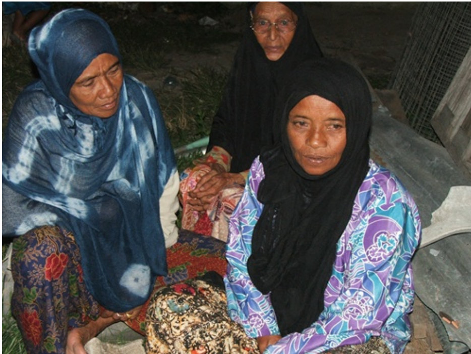
กลุ่มแม่บ้านและผู้สูงอายุในชุมชนที่มาร่วมงาน