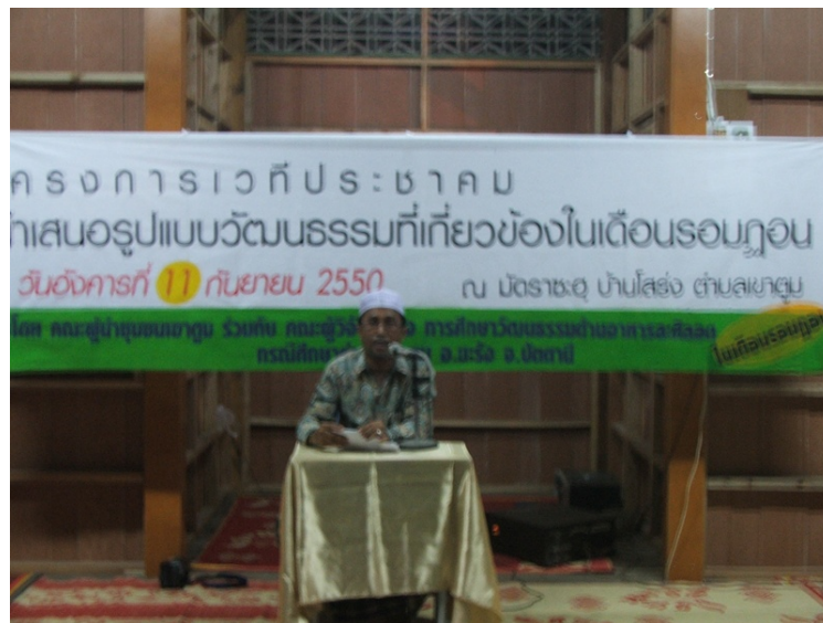
กล่าวเปิดเวทีประชาคมโดยกำนันตำบลเขาตุ้ม