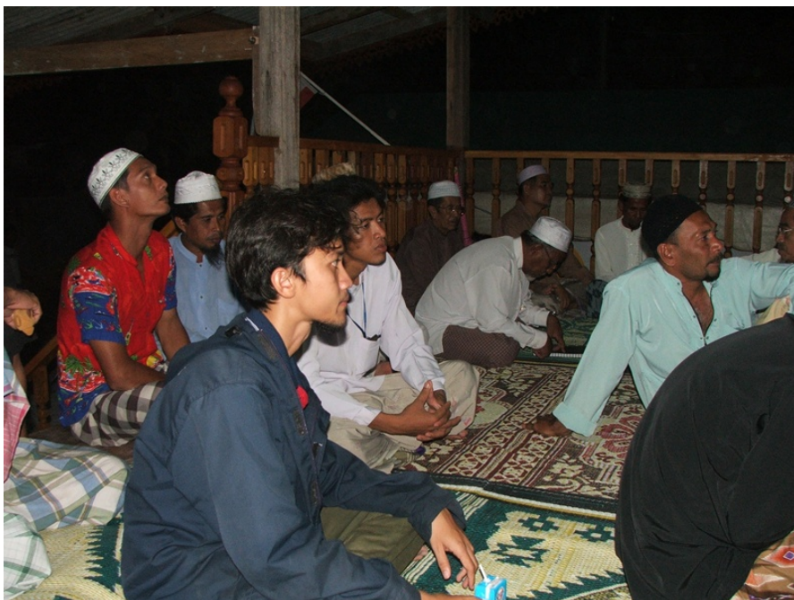
ภาพบรรยากาศผู้เข้าร่วม