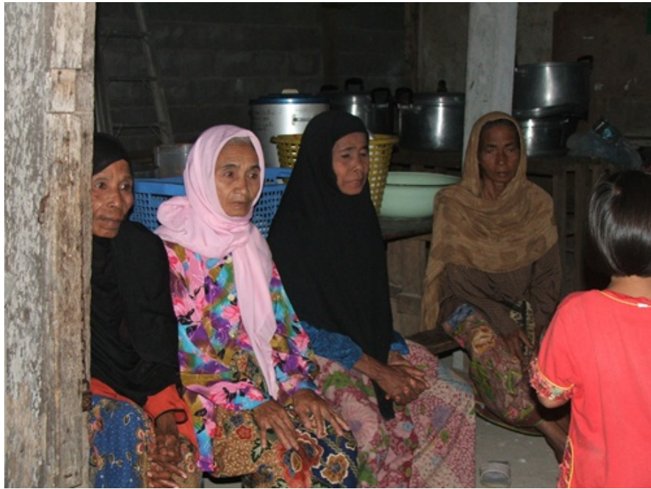
กลุ่มแม่บ้านและผู้สูงอายุในชุมชนที่มาร่วมงาน