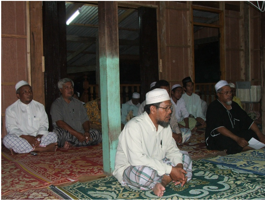
ภาพบรรยากาศผู้เข้าร่วม