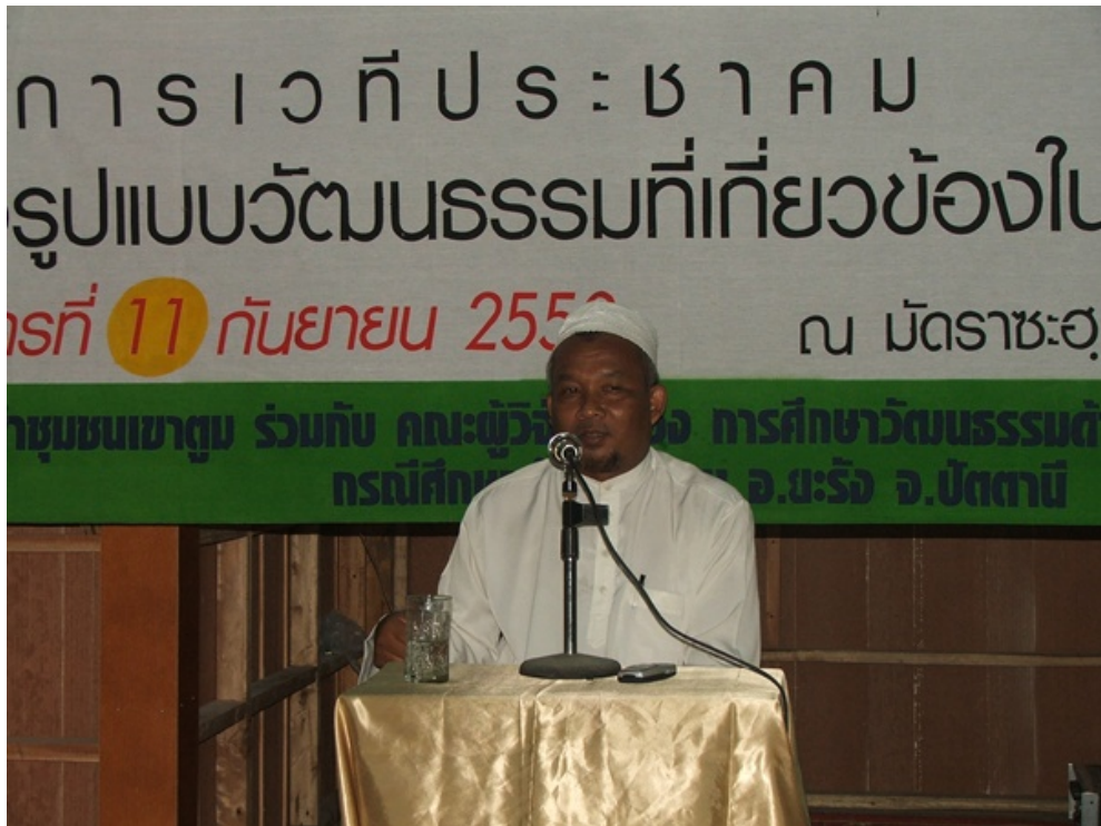
ตัวแทนทีมวิจัยชี้แจงโครงการและรับฟังข้อเสนอแนะจากผู้เข้าร่วม