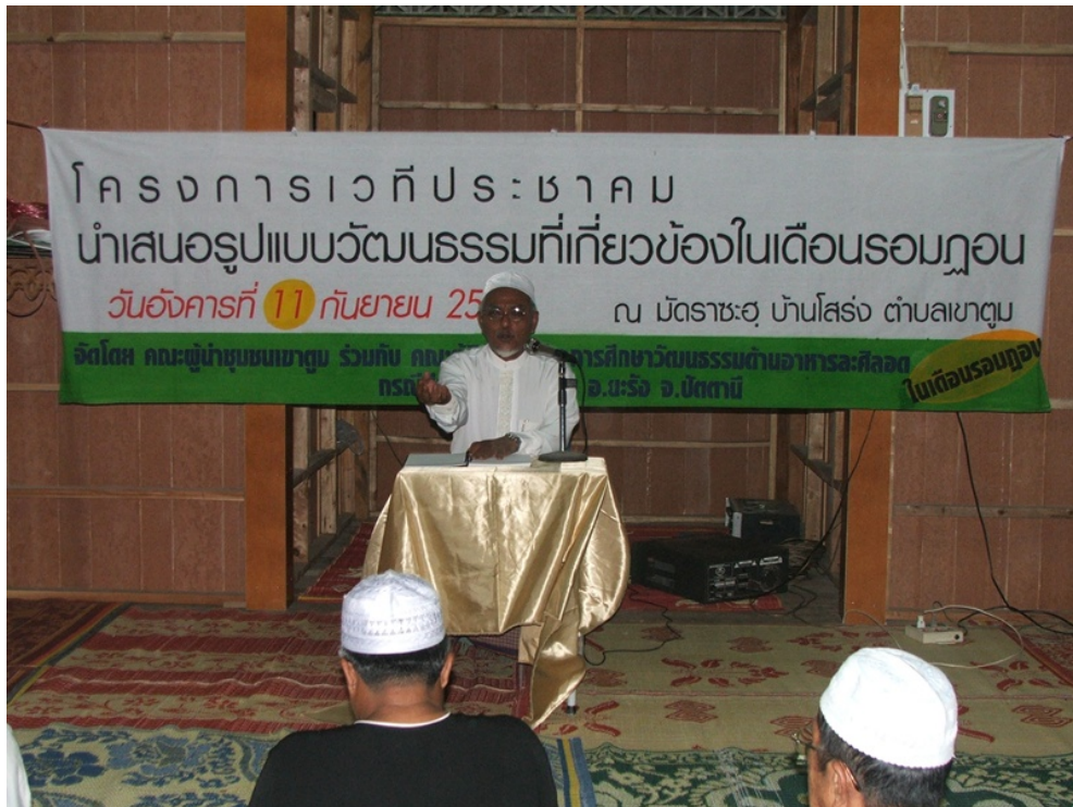
ผู้ทรงคุณวุฒิบรรยายให้ความรู้