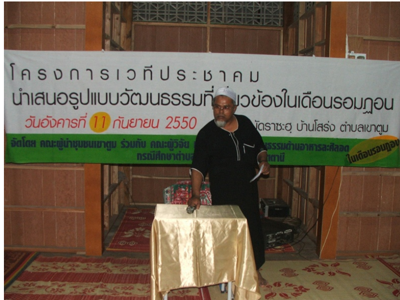
การดำเนินรายการเวทีประชาคม