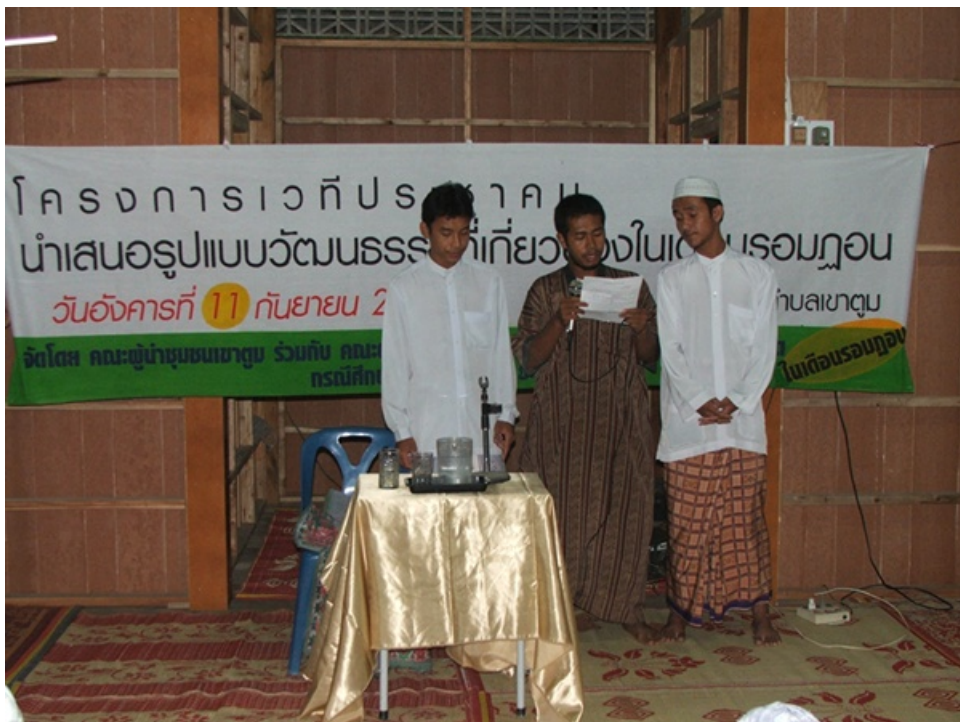
กิจกรรมอานาชีต คั่นรายการ