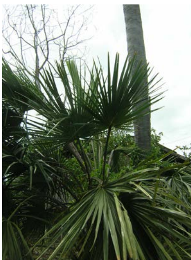
ภาพที่ ๕ ลักษณะของยอดลานที่เหมาะสมแก่การตัด

๔.๒.๑ การตัดยอดลาน ผู้ตัดจะต้องเลือกดูต้นลานที่มียอดอ่อนที่ยังไม่คลี่ใบต้นลานที่เจริญเติบโตสมบูรณ์ต้นหนึ่งจะแทงยอดอ่อนออกพร้อมกัน ๓-๔ ยอดลักษณะของการตัดยอดลานมี ๒ วิธี คือ