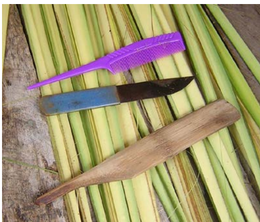
ภาพที่ ๔ วัสดุอุปกรณ์ในการผลิตงานหัตถกรรมหางอวน (ใบลาน)

วัสดุอุปกรณ์ที่นำมาใช้ในการผลิตหัตถกรรมหางอวน เป็นสิ่งของที่หาได้ง่ายๆระดับพื้นบ้านซึ่งชาวบ้านในท้องถิ่นยึดถือปฏิบัติและสืบทอดกันมาตั้งแต่บรรพบุรุษตลอดจนการพัฒนาปรับปรุงขึ้นมาใหม่ เพื่อให้เหมาะสมกับงานระดับอุตสาหกรรมในครอบครัวสำหรับประชากรในท้องถิ่น วัสดุอุปกรณ์ในการผลิตงานหัตถกรรมหางอวน แบ่งได้เป็น ๒ ส่วน คือ ส่วนของการทำใบลานให้เป็นเส้นหางอวน และในส่วนของการแปรรูปเป็นผลิตภัณฑ์ ซึ่งจะขอกกล่าวโดยรวมกับการนำเสนอขั้นตอนกรรมวิธีการผลิตงานหัตถกรรมจากหางอวน ดังนี้