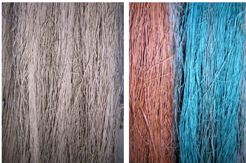
ภาพที่ ๑๓ เส้นลานที่ไม่ย้อมสีและเส้นลานที่ย้อมสีแล้ว