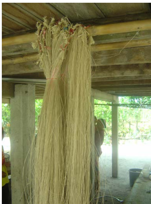
ภาพที่ ๑๔ เส้นลานที่เตรียมไว้เพื่อทำเส้นยีนและเส้นฟุง

๔.๒.๘ การเตรียมเส้นลานเพื่อทำเส้นยีนและเส้นฟุง นำมัดเส้นลานที่ตากแห้งดีแล้ว มาตัดจุกที่ผูกไว้ออกแล้วสอดเส้นลานทั้งมัดไว้ได้เข้าพับแล้วนั่งทับลงไว้