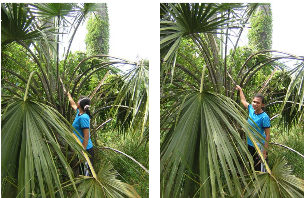
ภาพที่ ๖ การใช้มีดตัดยอดลาน

๔.๒.๑.๑ ใช้มีดตัด มีดที่ชาวบ้านใช้ตัดยอดลานเป็นมีดอีโต้หัวตัด ซึ่งใช้งานได้สารพัดอย่างตั้งแต่ถ่างหญ้า ตัดฟืน ฯลฯ ในการตัดผู้ตัดจะต้องสวมรองเท้าให้รัดกุม เพื่อป้องกันหนามลานที่โคนก้านใบเวลาป็นขึ้นไปบนต้นลาน ขณะที่กำลังตัดยอดลานจะต้องยืนให้สูงกว่ายอดและเล็งดูว่ายอดลานเอนไปทางทิศใด เพื่อเลือกทิศทางการตัดให้ถูกต้องควรตัดตามทิศทางที่ยอดลานเอนไป การตัดใช้มีดฟันที่ใต้ท้องโคนยอดลานก่อนไม่ให้ขาดทันที แล้วกลับมาฟันด้านบนอีกครั้งทั้งนี้เพื่อป้องกันไม่ให้ยอดลานที่ตัดแล้วพุ่งเข้าหาตัวผู้ตัดภายหลังผู้ตัดยอดลานจึงต้องมีความชำนาญมาก การตัดต้นหนึ่งบางครั้งจะได้พร้อมกัน ๒-๓ ยอด