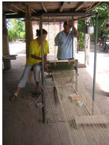
ภาพที่ ๑๖ ที่พื้นเมืองชนิด ๒ ตะกรอ