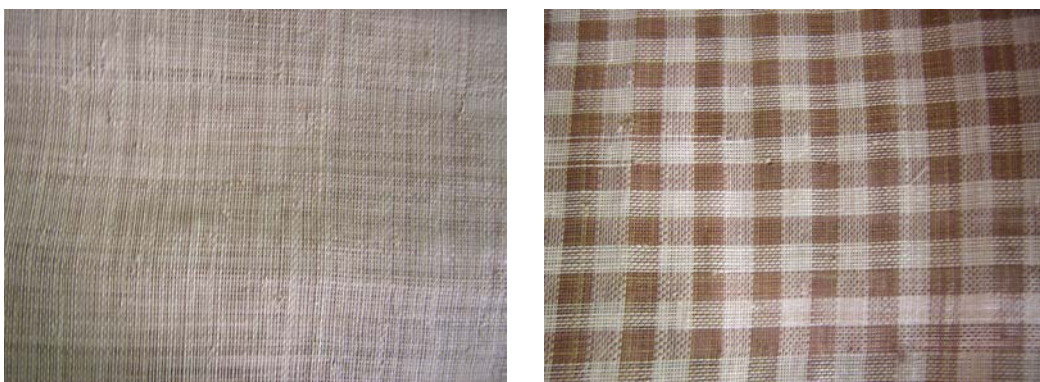
ภาพที่ ๒๐ ลวดลายหางอวนที่ทอเป็นผืน

๔.๓.๑ รูปแบบดั้งเดิม รูปแบบดั้งเดิมคือแบบที่ทอเป็นผืน สมัยก่อนนั้นทอชาวบ้านจะทอเพื่อใช้เป็นอุปกรณ์ในการหาปลา ปัจจุบันวิถีชีวิตการประมงของชาวบ้านเปลี่ยนไป หางอวนเป็นผืนจึงมีการใช้งานที่เปลี่ยนไปด้วย ที่พบเห็น จะมีทั้งที่เป็นสีธรรมชาติของหางอวน และแบบที่ผ่านการย้อมสีและมีลวดลายการทอเป็นตารางหมากรุก ราคาจะอยู่ที่เมตรละ ๑๒๐ บาท ผู้ที่สนใจก็จะซื้อเพื่อนำไปแปรรูปเป็นผลิตภัณฑ์ตามที่ต้องการ