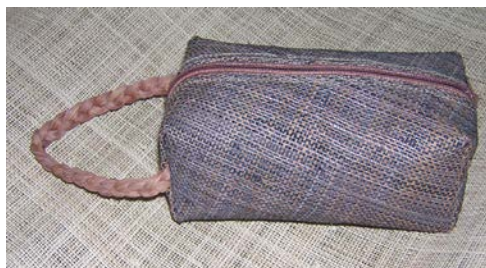
ภาพที่ ๒๔ ผลิตภัณฑ์กระเป๋าจากหางอวนในรูปแบบต่างๆ