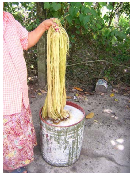
ภาพที่ ๑๒ แช่น้ำอีกครั้งเพื่อให้เส้นลานั้นมีความขาว