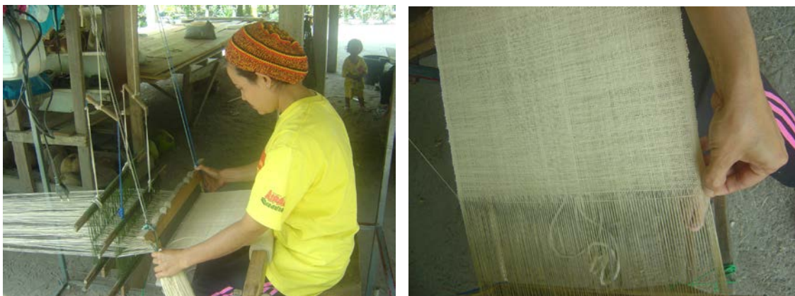
ภาพที่ ๑๘ การทอเส้นลาน (วะ)