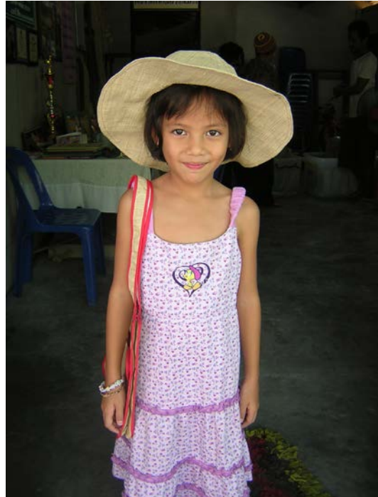
ภาพที่ ๒๕ ผลิตภัณฑ์หมวกจากหางอวนในรูปแบบต่างๆ