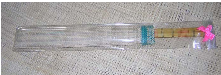
ภาพที่ ๒๒ ซอ่งใส่ตะเกียบจากหางอวน

๔.๓.๒ รูปแบบที่ได้รับการส่งเสริมและพัฒนา หลังจากที่ได้รับการสนับสนุนจากหน่วยงานต่างๆ เช่น ศูนย์บริการการศึกษาออกโรงเรียนอำเภอท่าศาลา พัฒนาชุมชน ในด้านงบประมาณ ระบบการผลิต การบริหารจัดการ การตลาดและจัดอบรมวิชาชีพแล้วนั้น รูปแบบของผลิตภัณฑ์ก็มีการพัฒนาโดยการนำหางอวนที่เป็นผืนไปแปรรูปเป็นผลิตภัณฑ์ต่างๆ ดังนี้