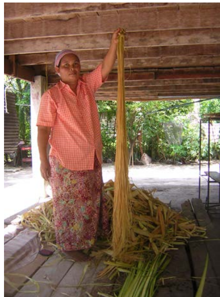
ภาพที่ ๑๑ การทอสีงไบลาน