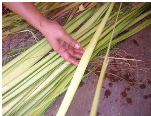
ภาพที่ ๑๐ การแยกไบลานออกเป็นสองส่วน