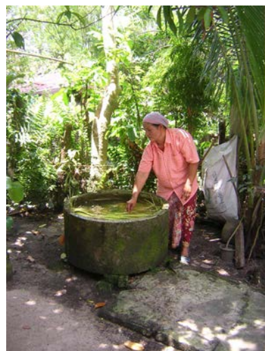
ภาพที่ ๙ การนำไบลานไปแช่น้ำ