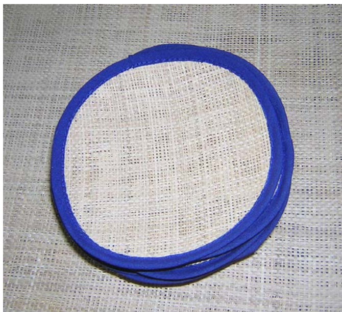
ภาพที่ ๒๓ ที่รองแก้วจากหางอวน