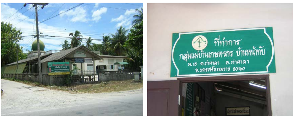
ภาพที่ ๒ กลุ่มแม่บ้านเกษตรกรชุมชนอิสลามบ้านหน้าทับ

ประมงมาตั้งแต่เดิม และได้ใช้ยอดตลานที่มีอยู่ในท้องถิ่นมาทำเป็นเส้น แล้วตากแห้ง จากนั้นนำมาทอเพื่อใช้เป็นอุปกรณ์ในการหาปลา สมัยก่อนการทอจะค่อนข้างหายาก ใช้ลากกุ้งเคย ปูปลา เพื่อแลกรผลไม้ ของกิน รุ่งนุ่นย่าตายาย ลักษณะการเย็บจะเย็บเป็นถุงแล้วลาก โดยใช้ดิดที่ปลายอวน แต่หลังจาก ข้อดีของชุมชนบ้านหน้าทับอีกอย่างหนึ่งก็คือเป็นแหล่งบ่อน้ำสะอาด เพราะจะทำให้การย้อมสีเส้นของหางอวนสะอาดด้วย ส่วนลวดแวกใกล้เคียง เป็นแหล่งน้ำเค็มจากน้ำทะเล สีที่ได้จะไม่สดและสะอาดเท่าที่ควร การดำเนินงานได้ริเริ่มตั้งแต่ปี พ.ศ. ๒๕๓๗ จนถึงปัจจุบัน โดยได้รับการสนับสนุนจากหน่วยงานต่างๆ และศูนย์บริการการศึกษาของโรงเรียนอำเภอกำแพงแสน พัฒนาชุมชนเป็นหน่วยงานที่ให้การสนับสนุนด้านงบประมาณ ในเรื่องของระบบการผลิต การบริหารการจัดการ การตลาด และจัดอบรมวิชาชีพ (ชวนพิศ โต้ะหวาน. ๒๕๕๙: สัมภาษณ์)