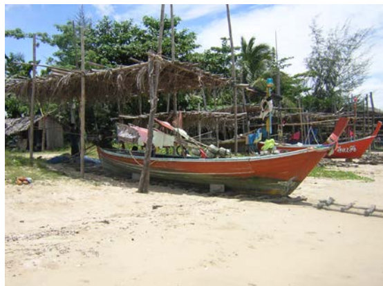
ภาพที่ ๑ สภาพการดำเนินชีวิตของชุมชนมุสลิมอำเภอท่าศาลา