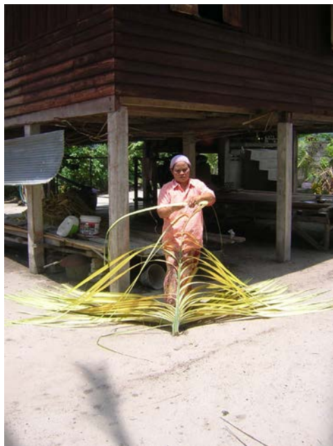
ภาพที่ ๗ การฉีกแยกใบลาน