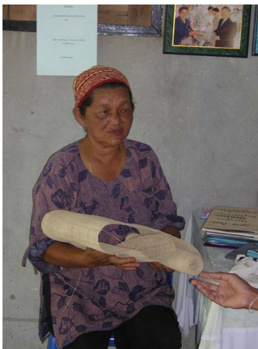
ภาพที่ ๑๙ หางอวนที่พร้อมจะนำไปแปรรูปเป็นผลิตภัณฑ์

ส่วนลายที่ใช้ในการทอนั้นมีทั้งหมด ๓ กลุ่มใหญ่ คือ ลายหลัก หรือ ลายต้นแบบ ลายเรขาคณิต กลุ่มลายประดิษฐ์ ลายที่ใช้ในการทอหางอวนใช้ลายต้นแบบ เป็นลายที่มีมาตั้งแต่โบราณ มี ๓ ลายคือ ลายหนึ่ง ลายสอง และลายสาม ซึ่งเป็นสายพื้นฐานของการสร้างสรรค์ลายอื่น ๆ