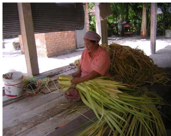
ภาพที่ ๘ การเอาก้านใบลานออก