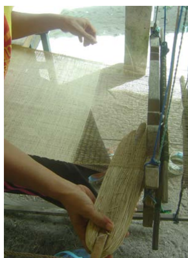
ภาพที่ ๑๗ การทอเส้นลาน (วะ)