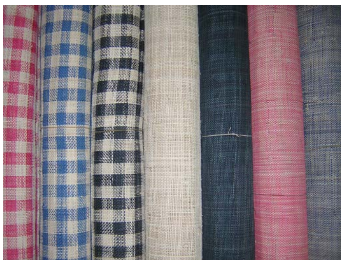
ภาพที่ ๒๑ หางอวนที่ทอเป็นผืน