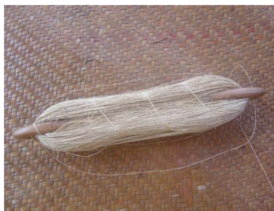
ภาพที่ ๑๕ การปั่นเส้นลานและการพันกับกระสวยเพื่อนำไปทอ