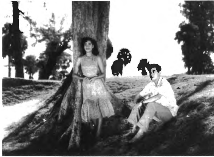
รูปที่ 4.20 ภาพยนตร์เรื่อง "ป้าหนั้น" ที่มีเบื้องหลังเป็นฉากธรรมชาติที่สวยงามของจังหวัดภูเก็ต