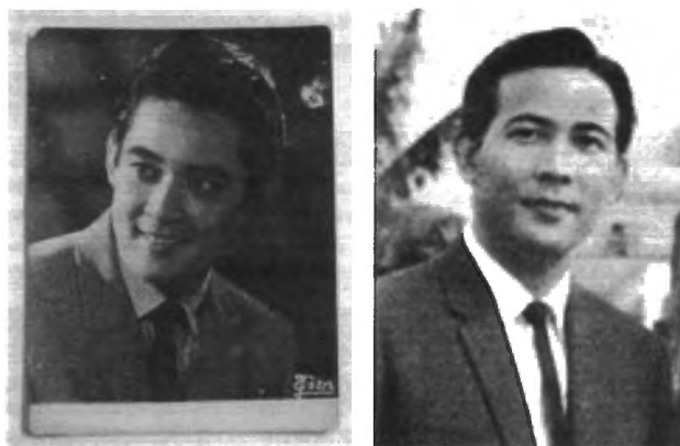
รูปที่ 4.18 ไชยา สุริยัน และ อุดุลย์ ดุลยรัตน์ ดาราที่ได้รับการชักชวนโดยนายแท้ ประกาศวุฒิสาร