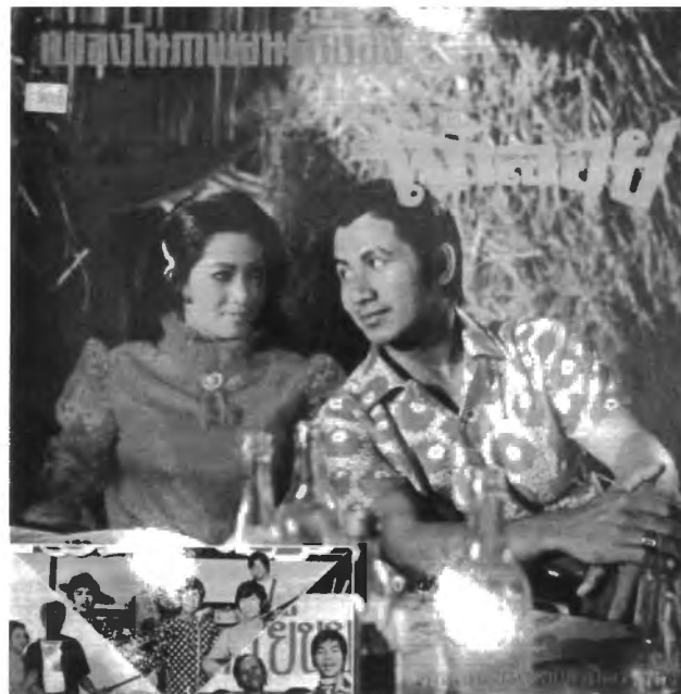
รูปที่ 4.24 แผ่นเสียงเพลงประกอบจากภาพยนตร์ เรื่อง "เจ้าลอย"