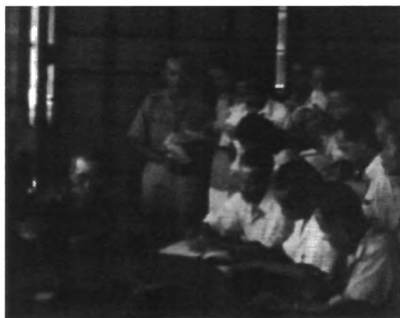
รูปที่ 4.48 – 4.52 ภาพจากเหตุการณ์รัฐประหาร 8 พฤศจิกายน พ.ศ. 2490 จอมพลป. พิบูลสงคราม และจอมพลผิน ชุณหะวัณ ตามลำดับภาพ