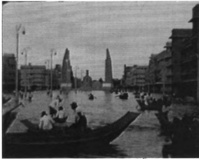
รูปที่ 4.3 ภาพจากภาพยนตร์บันทึกเหตุการณ์น้ำท่วมปี พ.ศ. 2485

ดำเนิน อนุเสาวรีย์ประชาธิปไตย สถานีรถไฟหัวลำโพง ถนนเยาวราช ภูเขาทอง ถนนเจริญกรุง ถูกน้ำท่วม นอกจากนั้นยังมีภาพของ เจ้าคุณพหลพลพยุหเสนา และรัฐมนตรี รวมทั้งบุคคลสำคัญหลายท่าน นั่งเรือมาประชุมสภาผู้แทนที่พระที่นั่งอนันตสมาคม ได้รับการบันทึกไว้ด้วย ซึ่งกลายเป็นภาพสำคัญที่หายาก และยังถูกนำมาฉายเพื่อให้เห็นสภาพบ้านเรือน และสภาวะน้ำท่วมของยุคสมัยนั้นอยู่เสมอจนถึงในปัจจุบัน