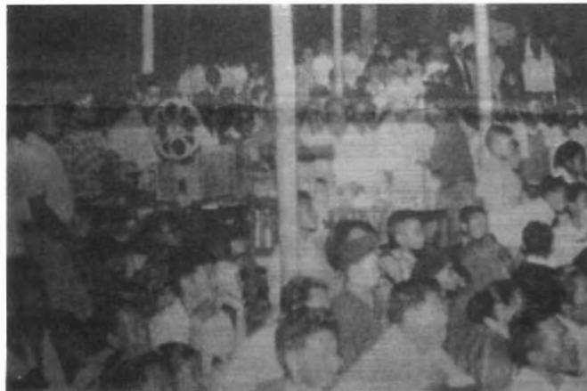
รูปที่ 4.60 บรรยากาศหนังขายยาในอดีต

“ตอนเด็ก ราวๆ 40 ปีมาแล้ว ส่วนใหญ่หนังไทยมันจะถูกนำไปฉายในต่างจังหวัด เอาไปฉายพร้อมไปขายยาในตัว โดดเด่นมากคือโอสภสกา เขาก็จะไปพร้อมรถหาบแร่ เนื่องจากพี่เป็นเด็ก ตจว. จะไปดูหนังต้องทำงานบ้านให้เสร็จก่อน เวลาไปดูก็หาเสื่อไปนั่งดู ส่วนใหญ่ก็ไปคนเดียวบางทีก็พาน้องไป ไปเจอเพื่อนที่ฉายหนัง ด้วยความอยากดูมิดๆก็ไม่กลัวผี คนละแวกนั้นก็เดินเป็นพรวนตามๆกันไป หนังที่ฮิตมากคือหนังไทยที่เป็นหนังบู๊ สมัยก่อนยิงภูเขา เผากระท่อม ได้รับอิทธิพลจากหนังคาวบอย สมัยนั้นไม่ว่าสุภาพบุรุษเสื่อไทย เहांดง ก็ได้ดู มีฝ่ายธรรมมะ ธรรมชัดเจนมาก ผู้ร้ายด่าดำไปเลย พระเอกขาวไปเลย เกิดเรื่องในหมู่บ้าน นางเอกต้องฝ้ายถูกกระทำ โดยผู้ร้ายเป็นเจ้าของมีอิทธิพล พระเอกเป็นอัศวินม้าขาวในเมืองมาช่วยปราบ” (ธนิตย์ จิตนุกูล, สัมภาษณ์, 2553)