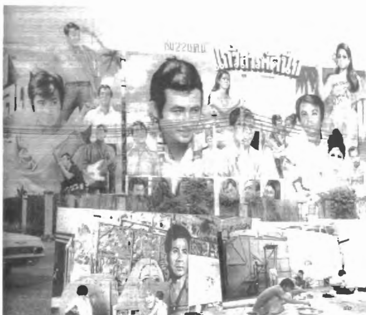
รูปที่ 4.30 คัทเอากกลางแจ้ง ขนาดสูงกว่าตึก 2 ชั้น เพื่อโฆษณาภาพยนตร์เรื่อง “แก้วสารพัดนึก” และขั้นตอนการทำคัทเอาก

ที่มา : http://topicstock.pantip.com/chalermthai/topicstock/2008/06/A6686389/A6686389.html