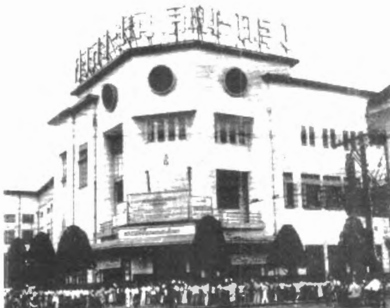
รูปที่ 4.4 ภาพถ่ายผลงานของนายแท้ ประกาศวุฒิสาร ในวันที่ 17 พฤษภาคม พ.ศ. 2493 หน้าโรงภาพยนตร์ศาลาเฉลิมกรุง ที่จัดฉายภาพยนตร์พระราชพิธีบรมราชาภิเษก

ทั้งสองเหตุการณ์ได้ถูกนำไปรวมกับส่วนของม.จ.ศุภวรรณดิศ ดิศกุล ที่พระบาทสมเด็จพระเจ้าอยู่หัวภูมิพลอดุลยเดชฯ ได้โปรดเกล้า ให้เป็นผู้ถ่ายทำภาพยนตร์ 16 มม. ขาวดำ ที่เป็นพระราชพิธีภายในพระบรมมหาราชวังทั้งหมด เพื่อนำมาตัดต่อให้สมบูรณ์และพระราชทานให้นำออกฉายให้ประชาชนดูเป็นครั้งแรกที่โรงภาพยนตร์ศาลาเฉลิมกรุง ซึ่งเป็นภาพยนตร์ส่วนพระองค์ชุดแรกที่โปรดเกล้าฯ ให้นำออกฉายสู่สาธารณชน ซึ่งนับแต่นั้นมา พระบาทสมเด็จพระเจ้าอยู่หัวฯ ทรงมีพระมหากรุณาโปรดเกล้าฯ ให้จัดภาพยนตร์ส่วนพระองค์เป็นชุดออกฉายให้ประชาชนได้รับชมตามโรงภาพยนตร์เป็นประจำทุกปี ไปจนกระทั่งถึงเมื่อมีการถ่ายทอดสดทางโทรทัศน์ได้เข้ามาแทนที่