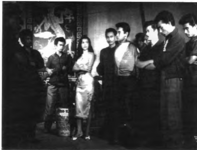
รูปที่ 4.58 ภาพยนตร์เรื่อง "สี่คิงส์" ที่อยู่ในแนวทางการถ่ายภาพยนตร์ film noir ของฮอลลีวูด

จากภาพยนตร์ของนายแท้เราสามารถแบ่งแยกแนวทางการถ่ายภาพยนตร์ได้ตามตาราง ดังนี้