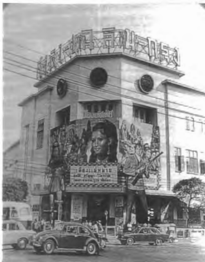
รูปที่ 4.29 การใช้คัทเอานักแสดงขนาดใหญ่ หน้าโรงภาพยนตร์ของภาพยนตร์เรื่อง “เมืองแม่หม้าย”