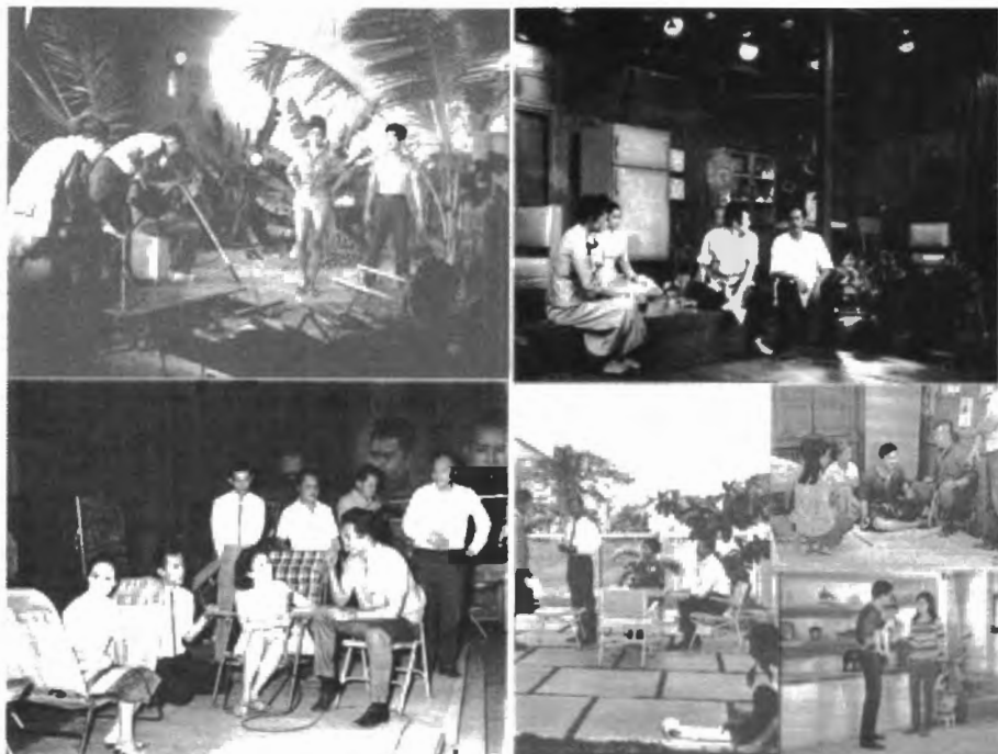
รูปที่ 4.17 บรรยากาศเบื้องหลังการถ่ายทำภาพยนตร์ไทยยุค 16