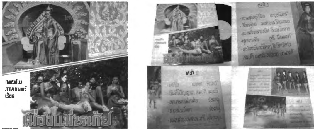
รูปที่ 4.23 แผ่นเสียงเพลงประกอบจากภาพยนตร์ เรื่อง "เมืองแม่หม้าย"