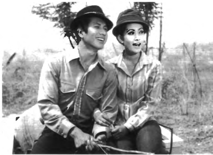
รูปที่ 4.21 ภาพยนตร์เรื่อง "เจ้าหญิง" ถ่ายทำที่จังหวัดนครราชสีมา