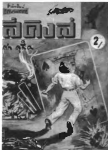
รูปที่ 4.15 นวนิยาย “สี่คิงส์” ของ เสก ดุสิต โดยสำนักพิมพ์ อักษรสมิทธิ์

เรื่อง “แห้วแดง” จากบทประพันธ์ของฉัตรชัย วิเศษสุวรรณภูมิ หรือ พนมเทียน ที่แต่งขึ้นพ.ศ. 2484 ตั้งแต่สมัยยังเป็นนักเรียนมัธยม เป็นนวนิยายเชิงอาชญากรรม ตีพิมพ์ครั้งแรกในหนังสือ “เพลินจิตต์” รายวัน เมื่อพ.ศ. 2490 เรื่อง “ชายชาติตรี” ของ ส.เนาวราช ก็ถูกตีพิมพ์ในหนังสือพิมพ์รายสัปดาห์ และได้รับความนิยมจากผู้อ่าน