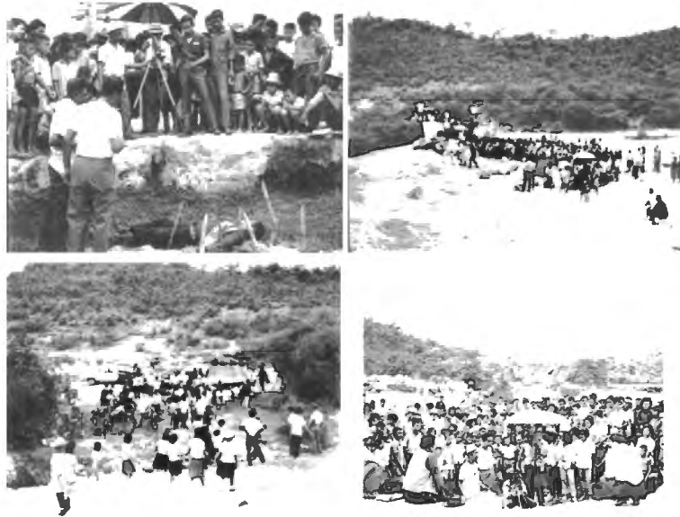
รูปที่ 4.22 เมืองหลังกองถ่ายภาพยนตร์เรื่อง "ชายชาติตรี" ถ่ายทำที่จังหวัดปราจีนบุรี