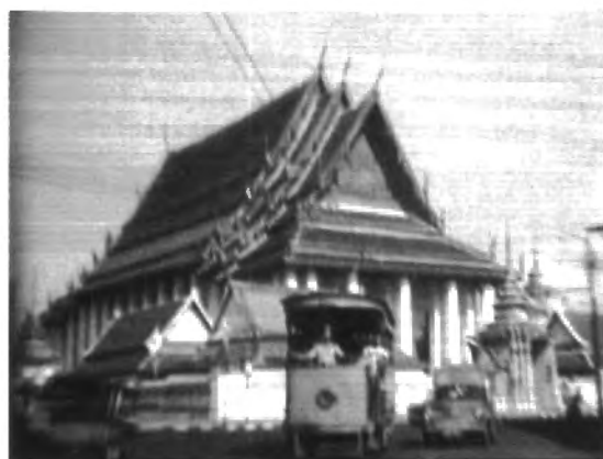
รูปที่ 4.53 – 4.54 ภาพถ่ายรตรางวันสุดท้ายจากภาพยนตร์ของนายแท้ ประกาศวุฒิสาร พ.ศ. 2511

นอกเหนือจากนั้น การบันทึกเหตุการณ์ในครอบครัวไว้หลากหลายเหตุการณ์ ไม่ว่าจะเป็นการไปหาตสุรินทร์ ภูเก็ต ในปี พ.ศ. 2496 พร้อมครอบครัวและคนใกล้ชิด หรือการไปเที่ยว ไทรโยค ในปี พ.ศ. 2499 รวมไปถึงการบันทึกเหตุการณ์ของครอบครัว อย่างเหตุการณ์งานแต่งงานของลูกสาว พันทิพา ประกาศวุฒิสาร หรือ เป็นการบันทึกภาพลูกๆหลานๆ เอาไว้ในอิริยาบถต่างๆ ซึ่งถือเป็นเหตุการณ์ที่มีคุณค่าทางจิตใจ ทั้งผู้ที่เกี่ยวข้องและผู้ชมทั่วไป ในการรับรู้ถึงความทรงจำในอดีต และวิถีชีวิตที่เปลี่ยนแปลงไป ภาพยนตร์เหล่านี้ เราอาจเรียกได้ว่า “หนังครอบครัว” หรือ “หนังบ้าน” (home movie) ที่เป็นการทำขึ้นมาเพื่อฉายกันเองในครอบครัวหรือคนที่ใกล้ชิด ในฐานะที่เป็นบันทึกความทรงจำและความรู้ในแต่ละยุคสมัย ในปัจจุบันก็ยังเป็นที่แพร่หลาย โดยเฉพาะเมื่อการทำถ่ายทำภาพยนตร์ สามารถใช้เครื่องถ่ายทำขนาดเล็กในระบบดิจิทัลได้อย่างสะดวกสบายและราคาถูกลงกว่าการถ่ายทำภาพยนตร์ในสมัยก่อน หรือที่เราเรียกกันในปัจจุบันว่า “home video”