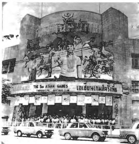
รูปที่ 4.11 โรงภาพยนตร์ศาลาเฉลิมไทย ฉายภาพยนตร์ “เอเชียนเกมส์ครั้งที่ 5”

ในปีพ.ศ. 2509 ประเทศไทยได้เป็นเจ้าภาพจัดการแข่งขันกีฬาเอเชียนเกมส์ ครั้งที่ 5 ขึ้นที่ กรุงเทพมหานคร นายแท็ก ในนามของบริษัทภาพยนตร์ไทย ไตรมิตร ได้ขอสิทธิในการเป็นผู้ถ่ายทำภาพยนตร์ การแข่งขันกีฬาครั้งนี้ โดยร่วมกับผู้อำนวยการสร้างชาวฮ่องกง คือมิสเตอร์ยูลีน หว่อง ได้ไปทำการ ล้างฟิล์ม ตัดต่อที่ประเทศฮ่องกง ที่อีสต์แมน คัลเลอร์ ยูนิเวอร์แซล แล็บ และได้้นำออกฉายในเวลา 6 เดือนต่อมา ซึ่งประสบการณ์การทำงานในช่วงนี้เองที่เป็นการค้นพบห้องแล็บล้างฟิล์มที่มีราคาถูกกว่าการส่งไปล้างที่ ลอนดอน หรือ โตเกียว ซึ่งการค้นพบครั้งนี้ได้สร้างประโยชน์ให้กับวงการ ภาพยนตร์ไทยอย่างมากในเวลาต่อมา