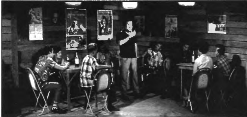
รูปที่ 4.27 เบญจมิตร จากเพลงในภาพยนตร์เรื่อง “มือเสือ”