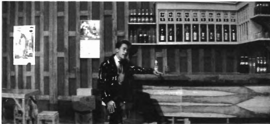
รูปที่ 4.26 ชาย เมืองสิงห์ จากเพลงในเรื่อง "มือเสือ"