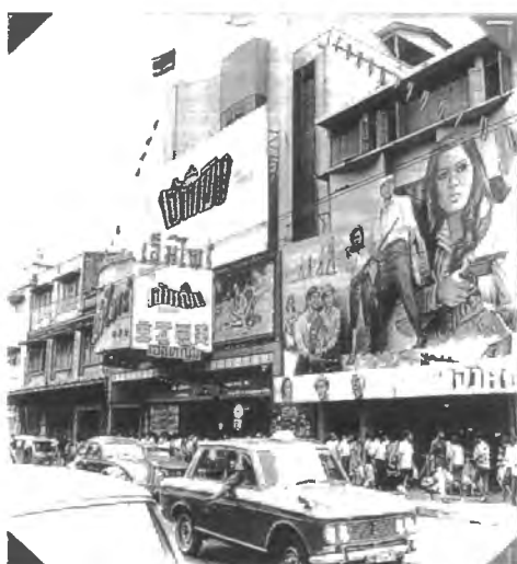
รูปที่ 4.32 โฆษณาหน้าโรงภาพยนตร์เอ็มไพร์ ภาพยนตร์เรื่อง “เจ้าหญิง”

8%B8%E0%B8%89%E0%B8%A5%E0%B8%B4%E0%B8%A1%E0%B8%81%E0%B8%A3%E0%B8%E0%B8%87-.jpg