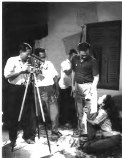
รูปที่ 4.10 เบื้องหลังการถ่ายทำภาพยนตร์เรื่อง “ชายชาติรี”