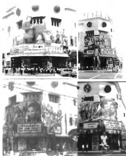
รูปที่ 4.31 การทำประชาสัมพันธ์หน้าโรงภาพยนตร์ จากเรื่อง เสือเฒ่า เมืองแม่หม้าย และ แก้วสารพัดนึก จาก