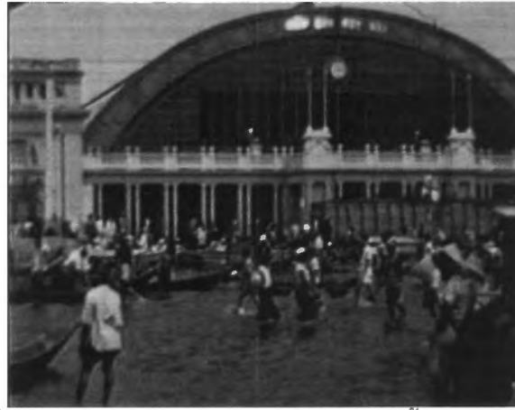
รูปที่ 4.43 – 4.47 ภาพจากภาพยนตร์เหตุการณ์น้ำท่วมพ.ศ. 2485