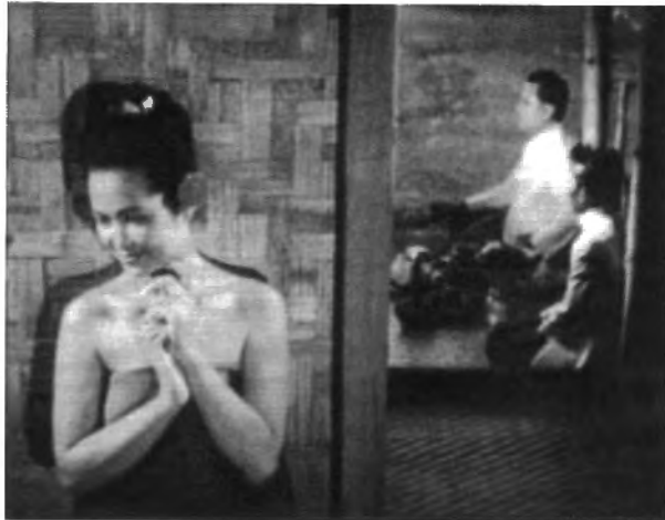
รูปที่ 4.59 ความพิถีพิถันในการจัดวางองค์ประกอบภาพ จากภาพยนตร์เรื่อง “สาวเครือฟ้า”

ลักษณะของงานภาพที่ประณีต สวยงาม และความเชี่ยวชาญในการใช้ภาพในการเล่าเรื่อง ถือเป็นเอกลักษณ์ในงานด้านภาพของนายแท้ ที่ยังสามารถพบเห็นได้ในเรื่อง “เสือเฒ่า” ที่มีการใช้ดอลลีครื่องกลม เพื่อนำเสนอตัวละครได้อย่างน่าสนใจ หรือเรื่อง “เมืองแม่หม้าย” ที่มีการถ่ายทำจากร้องเพลงของเมตตา รุ่งรัตน์ที่ฮ่อมจ้อม จังหวัดน่าน อย่างสวยงาม และฉากเปิดเรื่อง ที่มีการเปิดตัวเหล่าผู้หญิงในเมืองแม่หม้าย โดยให้เห็นแค่ขา สร้างความลึกลับ และความสนใจของคนดู ซึ่งการใช้ภาพในลักษณะนั้นในช่วงเริ่มต้น คนดูได้เก็บความสงสัยเอาไว้ เป็นเวลาพอสมควรกว่าจะได้รับเฉลย ซึ่งถือเป็นเทคนิคการเล่าเรื่อง ที่มีจังหวะการเฉลยที่เหมาะสม