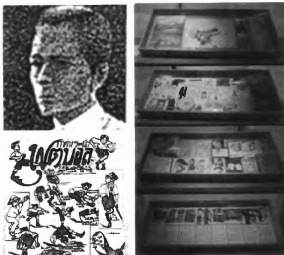
รูปที่ 4.2 ขุนปฏิภาคพิมพ์ลิขิต ที่นอกเหนือจากเป็นผู้ถ่ายทำภาพยนตร์ ยังเป็นผู้ที่ได้รับการยกย่องให้เป็นนักเขียนการ์ตูนคนแรกของเมืองไทย และเป็นผู้นำวิชาการทำบล็อกเข้ามาในเมืองไทย