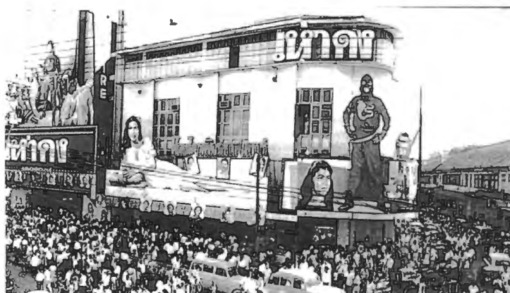
รูปที่ 4.33 โฆษณาหน้าโรงภาพยนตร์เอ็มไพร์ เรื่อง “แห่แดง”

ในเรื่องของการใช้คำศัพท์ก็เช่นกัน ไม่ได้จัดให้มีแต่แค่ภายในโรงภาพยนตร์เท่านั้น แต่ยังหาช่องทางอื่นๆ เช่นเรื่อง “แห่แดง” ที่จัดให้มีคำศัพท์สูง 12 เมตร ที่วงเวียนราชเทวี และนอกเหนือจากการแห่และแจกใบปลิวแต่เพียงอย่างเดียว ก็ยังมีการนำภาพยนตร์ตัวอย่างเร่ฉายตามหัวมุมเมืองต่างๆ ถึงแม้จะโดนจับในเรื่องของการกีดขวางการจราจร แต่ก็ถือได้ว่าสร้างปรากฏการณ์ใหม่ให้การโฆษณาภาพยนตร์ นอกจากนั้น การทำงานของนายแท้ ยังรวมไปถึงการใส่ใจรายละเอียด ณ โรงภาพยนตร์ที่ใช้ฉาย เช่น ภาพยนตร์เรื่อง “แก้วสารพัดนึก” เนื่องจากมีการจัดฉายช่วงตรุษจีน และมีเนื้อหาที่เกี่ยวข้องกับคนจีนแทรกอยู่ นายแท้ได้นำโคมไฟซึ่งซื้อมาจากฮ่องกงในช่วงที่ไปติดต่อภาพยนตร์มาประดับประดาในโรงเพื่อสร้างบรรยากาศ