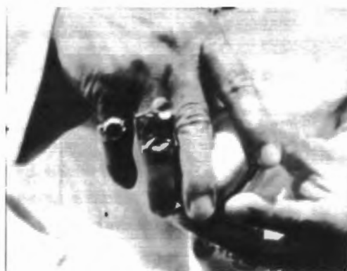
รูปที่ 4.40 – 4.42 ภาพจากภาพยนตร์เรื่อง “สาวเครือฟ้า”