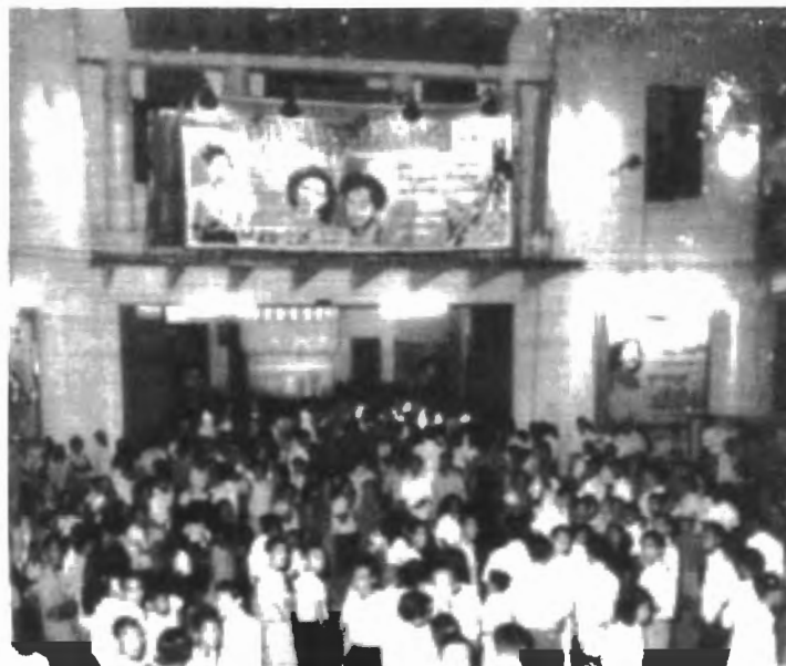
รูปที่ 4.7 หน้าโรงภาพยนตร์ศาลาเฉลิมกรุง ฉายเรื่องสุภาพบุรุษเสือไทย