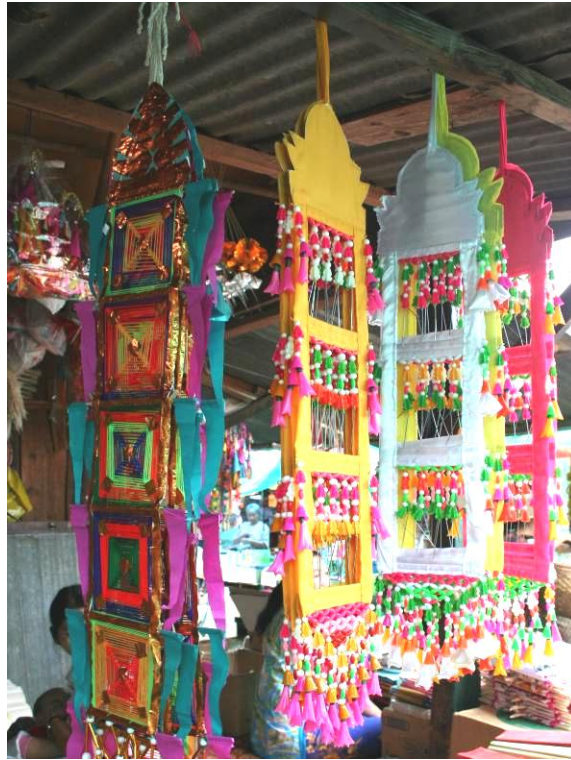
ภาพที่ ๔.๑๓ “ตุ้งแฉิม” เครื่องประกอบพิธี ตั้งกรรมมหาเวสสันดรของชาวไทยจีน

ดังนั้นโดยมากแล้ว เจ้าศรัทธาหรือผู้รับเป็นเจ้าของจะเลือกรับเป็นเจ้าของภาพกัณฑ์ที่เชื่อกันว่ากรรมในกัณฑ์เหมาะกับราศีของตน คือ กัณฑ์ทศพร มี ๑๕ พระคาถา เชื่อว่าเป็นกรรมสำหรับผู้ที่เกิดในปีหนูหรือปีจิ้งจอก กัณฑ์หิมพานต์ มี ๑๓๔ พระคาถา เชื่อว่าเป็นกรรมสำหรับผู้ที่เกิดในปีวัวหรือปีเป่า กัณฑ์ทานกัณฑ์ มี ๒๐๘ พระคาถา เชื่อว่าเป็นกรรมสำหรับผู้ที่เกิดในปีเสือหรือปีชง กัณฑ์วนปเวศน์ มี ๕๗ พระคาถา เชื่อว่าเป็นกรรมสำหรับผู้ที่เกิดในปีกระต่ายหรือปีเหม้า กัณฑ์ชูชก มี ๑๕ พระคาถา เชื่อว่าเป็นกรรมสำหรับผู้ที่เกิดในปีงูใหญ่-พญานาคหรือปีสี กัณฑ์จุลพนมี ๑๕ พระคาถา เชื่อว่าเป็นกรรมสำหรับผู้ที่เกิดในปีงูเล็กหรือปีไส้ กัณฑ์มหาพน มี ๘๐ พระคาถา เชื่อว่าเป็นกรรมสำหรับผู้ที่เกิดในปีม้าหรือปีส่าง่า กัณฑ์กุมาร ๑๐๑ พระคาถา เชื่อว่าเป็นกรรมสำหรับผู้ที่เกิดในปีแพะหรือปีเมียด กัณฑ์มัทรี มี ๕๐ พระคาถา เชื่อว่าเป็นกรรมสำหรับผู้ที่เกิดในปีลิงหรือปีส่าง่า กัณฑ์สักกบรรพ มี ๔๑ พระคาถา เชื่อว่าเป็นกรรมสำหรับผู้ที่เกิดในปีไก่หรือปีเต่า กัณฑ์มหาธาตมี ๖๕ พระคาถา เชื่อว่าเป็นกรรมสำหรับผู้ที่เกิดในปีหมาหรือปีเสียด กัณฑ์กษัตริย์มี ๑๖ พระคาถา เชื่อว่าเป็นกรรมสำหรับผู้ที่เกิดในปีหมู-ช้างหรือปีไก่ และกัณฑ์นคร มี ๔๘ พระคาถา เชื่อว่าเป็นกัณฑ์ที่ใช้สำหรับผู้ที่เกิดราศีใดก็ได้ทั้ง ๑๒ ราศี(พ่อนานตาล, พ่อนานสาม, ครุบาทพิพย์, สัมภาษณ์, ๑ กันยายน ๒๕๕๒)