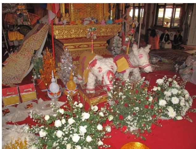
ภาพที่ ๔.๑๓ ช้างแก้ว ม้าแก้ว และถึงน้ำน้ำมูมธรรมาสน์ที่สมมุติเป็นสระน้ำ

หอปราสาททั้งสองลักษณะนี้ เมื่อมีการตั้งธรรมเวสสันดรหรือในขณะทำพิธี จะมี การนำเอาธนบัตร ดอกไม้ ไปผูกติดไว้ที่ยอดมุมต่างๆของหอปราสาท รวมถึงในส่วนที่เป็นฝ้า เพดานของหอปราสาทที่อยู่เหนือศีรษะของพระองค์เทศน์ จะพบว่ามีการนำเอาผ้าขาวไปผูกติดไว้ เป็นเพดาน และภายในฝ้าจะใส่ธนบัตร ดอกไม้ เทียนไว้ด้วย เป็นที่นำสังเกตุว่าในกิจกรรมต่างๆ รวมไปถึงพิธีกรรมทางพระพุทธศาสนาของชาวไทยจีนในเชียงใหม่ จะไม่พบเห็นการใช้ธูปมาเป็น ส่วนประกอบของพิธีเลย ส่วนที่ฐานของหอปราสาททั้งสี่มุมจะวางถึงน้ำขนาดกลางไว้มุมละ ๑ ถัง ภายในใส่ดอกไม้ หมายผู้หมากเมียและมีตะเกียง หรือที่ชาวไทยจีน เรียกว่า “โคม” วางตั้งอยู่ด้วย