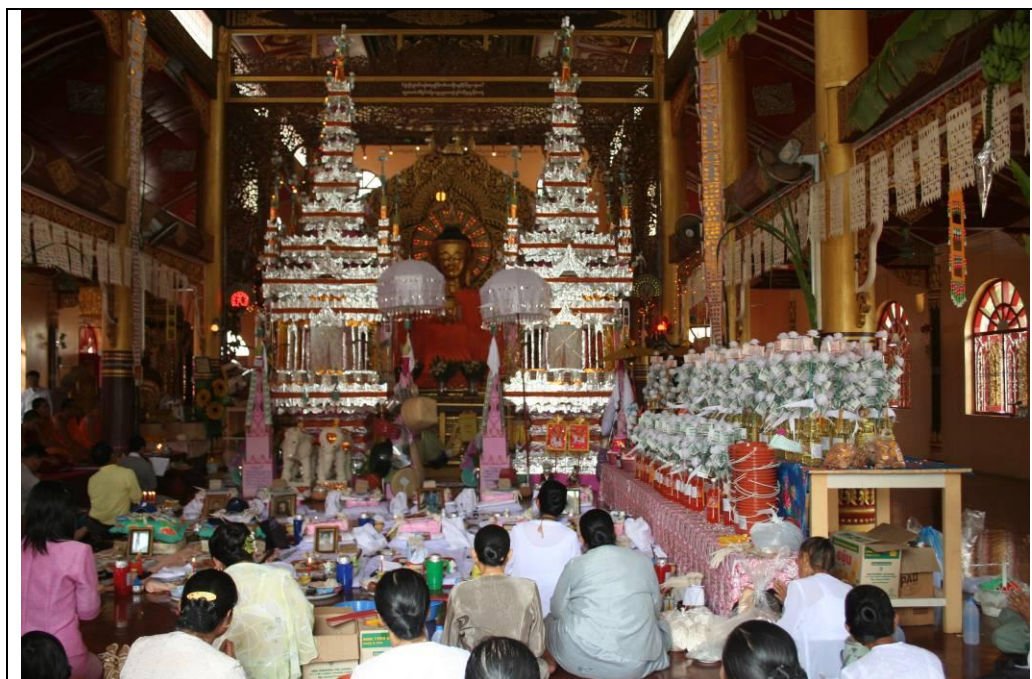
ภาพที่ ๔.๖ หอปราสาทกระดาศในพิธี ตั้งธรรมเวสสันดร และ“ตานจอมคนตาย” วัด เชียงชุม

ส่วนในระยะเวลาและขั้นตอนพิธีการในการเทศน์นั้นก็จะใช้เวลา ๓ วัน ในการเทศน์ลักษณะนี้จะมีการนิมนต์พระภิกษุจากวัดต่างๆ ในเมืองเชียงตุงมาเป็นองค์เทศน์ โดยจะมีการแบ่งคัมภีร์ธรรมแต่ละกัณฑ์ออกเป็นส่วนๆ หรือใบๆ เพื่อแจกจ่ายไปให้กับพระสงฆ์วัดต่างๆ ในเมือง เชียงตุง ให้ได้เป็นองค์เทศน์อย่างทั่วถึงกันทุกรูป จากนั้นก็จะนำเอารายชื่อกัณฑ์มาทำเป็นสลากให้คณะศรัทธาได้จับสลากเพื่อเป็นเจ้าภาพกัณฑ์และใบต่างๆ เช่น “มัทรี ๓” หมายถึงกัณฑ์ มัทรี ใบที่ ๓ เป็นต้น ผู้ใดจับสลากได้กัณฑ์ไหนก็จะไปจัดเตรียมเครื่องไทยทานมาเป็นเครื่องกัณฑ์เทศน์