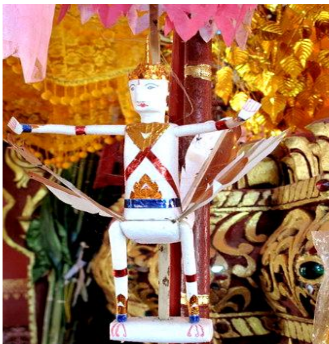
ภาพที่ ๔.๑๒ รูปจำลองกินารี ในพิธีการเทศน์มหาเวสสันดร

๓.๒.๑.๕ จ้อหรือธง ทำด้วยกระดาษสา ผูกเป็นมัดมัดละ ๑๐ อัน นำมาผูกเข้าด้วยกันเป็นวงกลมวงละ ๕๐ มัด จำนวน ๒ วง