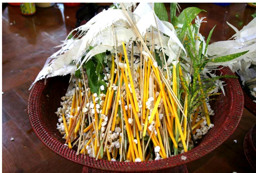
ภาพที่ ๔.๑๔ ขันข้าวตอกดอกไม้และจ้อ สำหรับขอสมათานศีล

เสาพระวิหารและบริเวณโดยรอบหอปราสาทจะประดับประดาไปด้วย ต้นกล้วย ต้นอ้อย ต้นอ้อ ต้นกก ทำให้บรรยากาศดูร่มรื่นเหมือนป่าไม้ ผูกโยงไปด้วยฝ้ายสายสิญจน์หรือที่ชาวไทจีน เรียกว่า “ฝ้ายสุตมนต์” มีขันดอกไม้และตุ้งหรือจ้อขนาดเล็ก ที่ทำขึ้นเป็นขันสำหรับขอสมათานศีลหรือขันศีล จำนวน ๒ ขัน