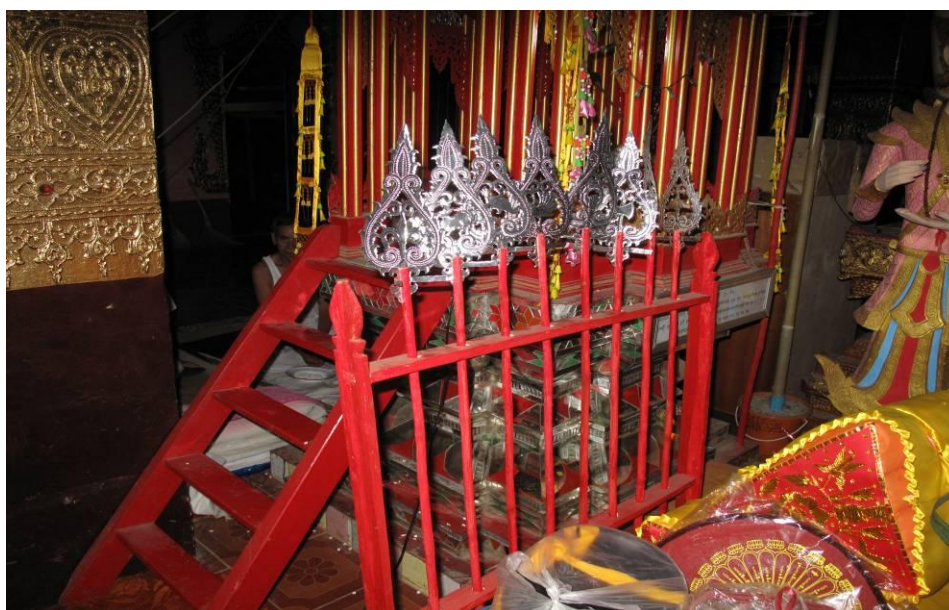
ภาพที่ ๔.๑๑ เครื่องทิพย์ ๑๖ หรือ “ปิดคำจามร”

๓.๒ เครื่องบูชาของการเทศน์เวสสันดรที่จัดขึ้นนอกเทศกาลหรือหรือจัดขึ้นเป็นกรณีพิเศษ ได้แก่