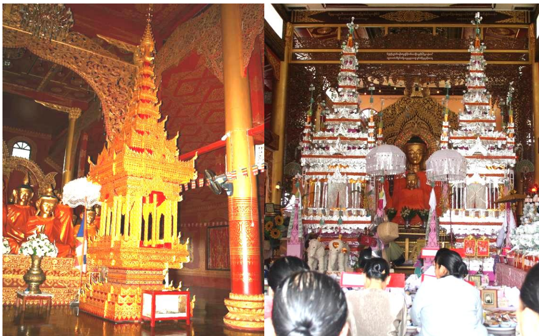
ภาพที่ ๔.๘ หอปราสาทแบบถาวร

มีส่วนร่วมตั้งแต่การเข้าร่วมประชุม วางแผน จัดเตรียมสถานที่ เครื่องประกอบพิธี สนับสนุน วัตถุประสงค์รวมถึงการมีส่วนร่วมในการประกอบอาหารในวันงาน รวมไปถึงการเป็นเจ้าภาพ การเข้าร่วมฟังการเทศน์มหาเวสสันดร่อีกด้วย