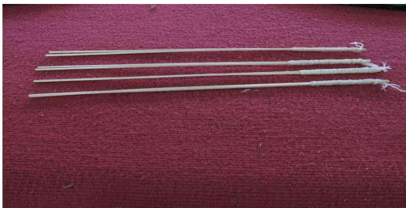
ภาพที่ ๔.๑๐ ไม้ไผ่ผ่าซีกพันด้วยฝ้ายชุบด้วยน้ำมันพืชไต้หวันเรียกว่า“ประทีป ๑,๐๐๐ ดวง”