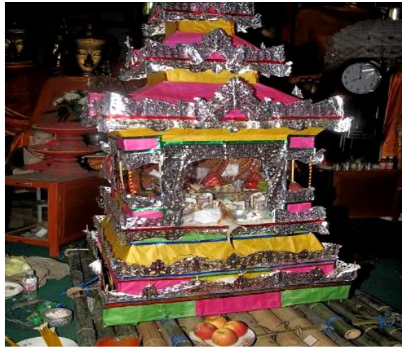
ภาพที่ ๔.๑๕ หอพระอุปคุตในงานตั้งกรรมเวสสันตระที่เป็นงานบวชพระเป็กตุ้ วัดพระสิง