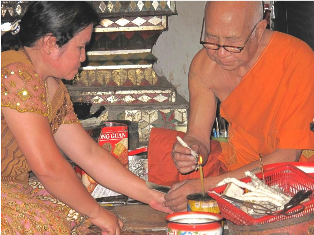
ภาพที่ ๔.๑ เจ้าอาวาสวัดพระสิงห์ กำลังทำการรักษาโรคให้กับญาติโยมที่เจ็บป่วย

ชาวไทยจีนคิดว่า การได้ให้บุตรชายได้บวชในพระพุทธศาสนาเป็นความปรารถนาสูงสุดของพ่อแม่ เป็นการตอบแทนบุญคุณของพ่อแม่ที่ยิ่งใหญ่ นอกจากนั้นชาวไทยจีนยังมีความเชื่อในเรื่องของ บุญ บาป กรรมดี กรรมชั่ว การไปวัดของชาวไทยจีนไม่ใช่เพียงเพื่อการไปทำบุญฟังเทศน์เพียงอย่างเดียว ยังมีวัตถุประสงค์แฝงในการไปวัดคือ การได้พบปะกับบุคคลที่อยู่ร่วมกันในสังคม ดังจะเห็นได้จากในวันพระที่ผู้สูงอายุ พ่อแม่ ปู่ย่า ตายาย ไปนอนวัดเพื่อถือศีลปฏิบัติธรรม ถึงเวลาบุตรหลานก็จะนำอาหารไปส่งให้รับประทาน ในระหว่างที่นั่งรอหนุ่มสาวเหล่านั้นก็จะมานั่งคุยกัน เมื่อผู้สูงอายุรับประทานอาหารเสร็จ ก็จะไปเก็บสำรับที่เหลือนำมานั่งรับประทานร่วมกัน และพูดคุยสนทนากันถึงเรื่องราว เหตุการณ์ข่าวสารทั่วไป นอกจากนี้วัดยังมีส่วนทำหน้าที่เป็นสถานที่รวมสมาชิกของชุมชน เป็นสถานที่ถ่ายทอดคำสอน ข้อคิด ระเบียบการประพฤติของสังคม จริยธรรม ความดีที่ควรปฏิบัติตามหลักพุทธศาสนา และถ่ายทอดกระบวนการทางสังคมโดยมีวัดเป็นศูนย์กลาง ส่วนพระสงฆ์ก็มีบทบาทต่อสังคมในเรื่องของการนำเอาคำสอนทางพุทธศาสนาที่แฝงไว้ในเรื่องเล่า บทเทศน์ บทสวด มาถ่ายทอดเพื่อให้เกิดความบันเทิงและสามารถสื่อสารคำสอนไปสู่ผู้ฟังได้ด้วยวิธีการเทศน์