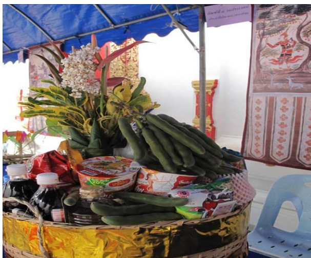
ภาพที่ ๔.๑๗ กัณฑ์เทศน์แบบดั้งเดิมที่บรรจุน “ก้วยกล้า”

กัณฑ์หิมพานต์ จะแกะเป็นรูปช้างเพราะในเนื้อเรื่องของกัณฑ์นี้จะกล่าวถึงในวันที่ พระเวสสันดรประสูตินั้น ทรงได้ช้างเผือกขาวบริสุทธิ์ที่แม่ช้างชาติฉัททันต์นำมาถวายไว้ในโรงช้าง ชาวสืฟิได้ให้ชื่อช้างว่า “ปัจฉิมนาเคนทร์” ด้วยเป็นช้างมงคลที่แม่จับจีไปในที่ใดก็จะทำให้ฝนตกต้องตามฤดูกาล