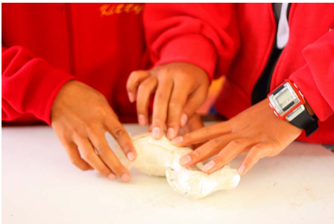
การทำตัวม้า