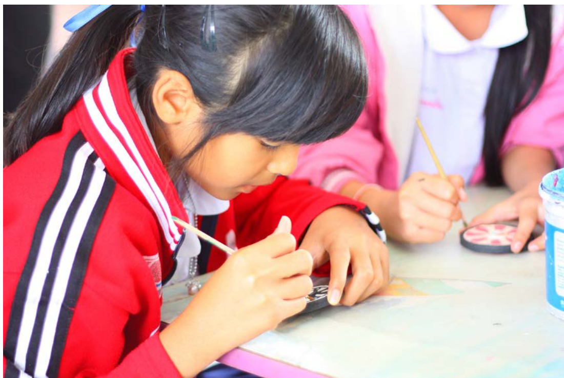
การทำล้อรถม้า