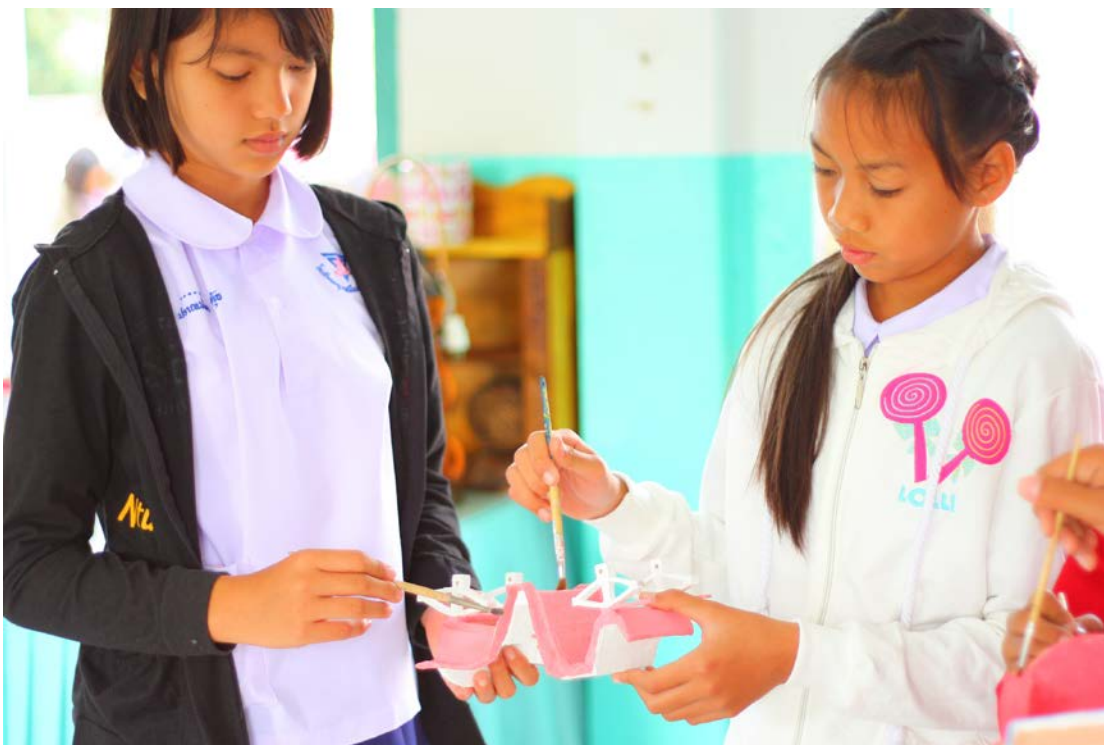
การทำตัวรถม้า