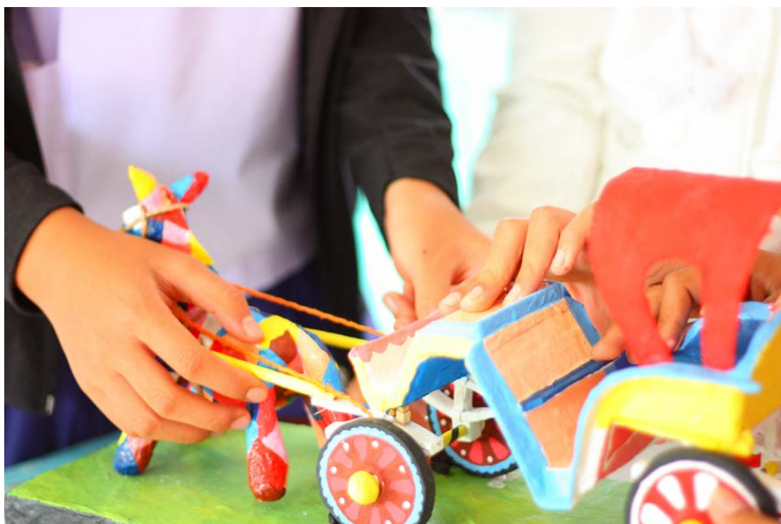
การประกอบตัวม้ากับรถม้า