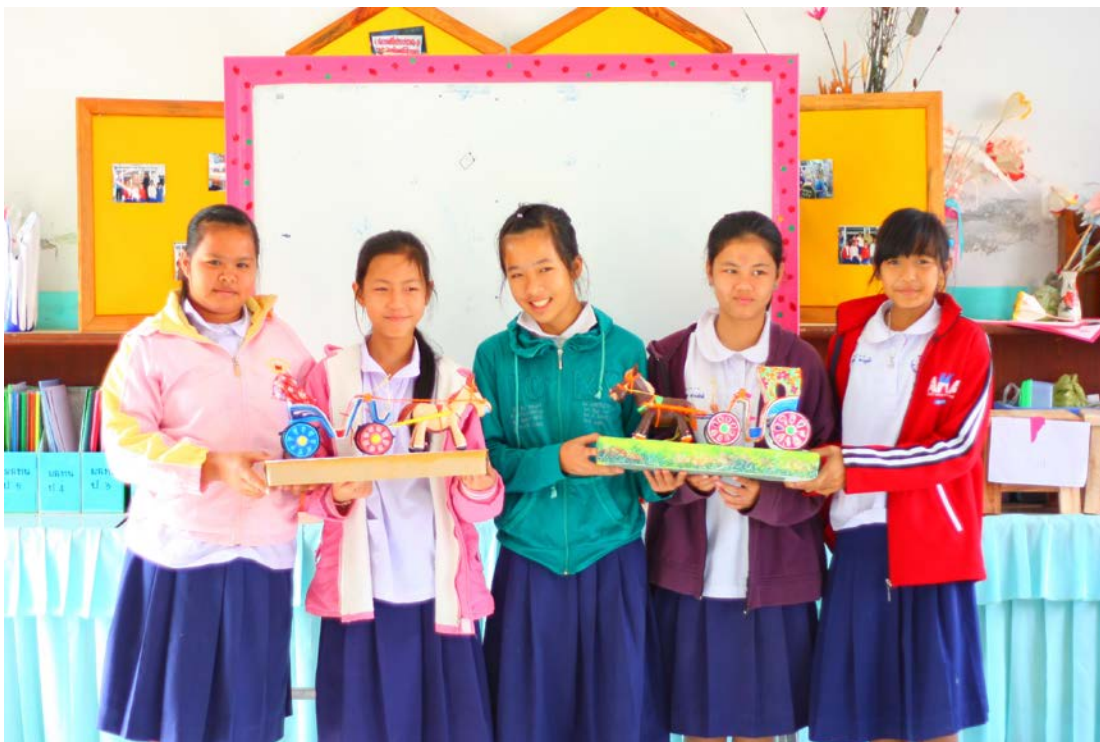
ผลงานสำเร็จ