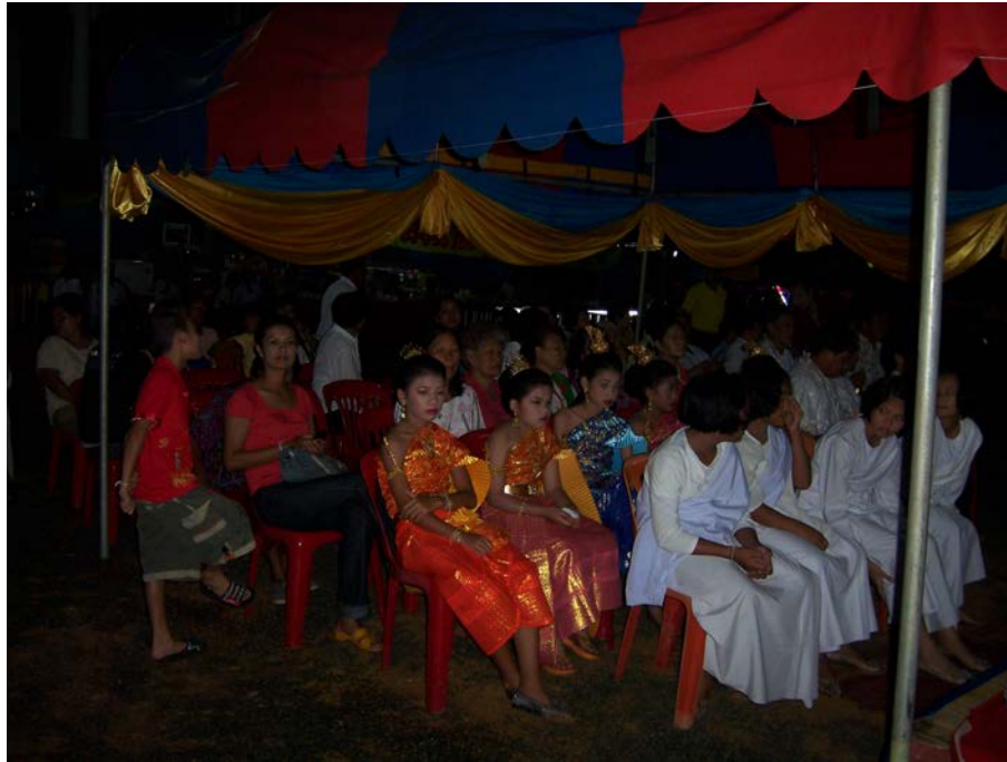
ประชาชน นักเรียน สถานศึกษา ชุมชนเข้าร่วมพิธีกวนข้าวมรุปายาส(ข้าวทิพย์)

การบริหารจัดการวัฒนธรรมท้องถิ่นเพื่อสร้างความสามัคคีในชุมชน : กรณีศึกษาประเพณีกวนข้าวมรุปายาส(ข้าวทิพย์) ของวัดเกษมจิตตาราม อำเภอเมืองอุตรดิตถ์ จังหวัดอุตรดิตถ์