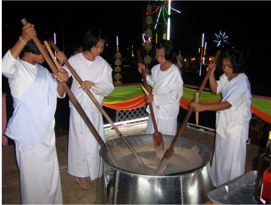
ชุดขาว (ผู้ถือศีล) เริ่มกวนข้าวมธุปายาส(ข้าวทิพย์)

ของวัดเกษมจิตตาราม อำเภอเมืองอุตรดิตถ์ จังหวัดอุตรดิตถ์