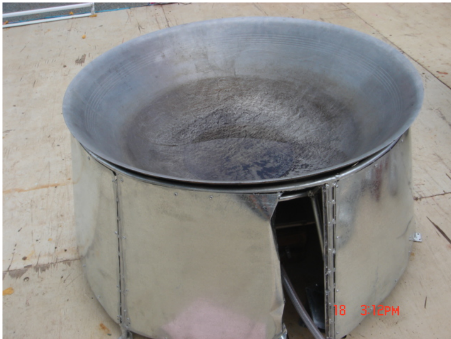
วัสดุ อุปกรณ์กวนข้าวมรุธปายาส(ข้าวทิพย์) เต้า