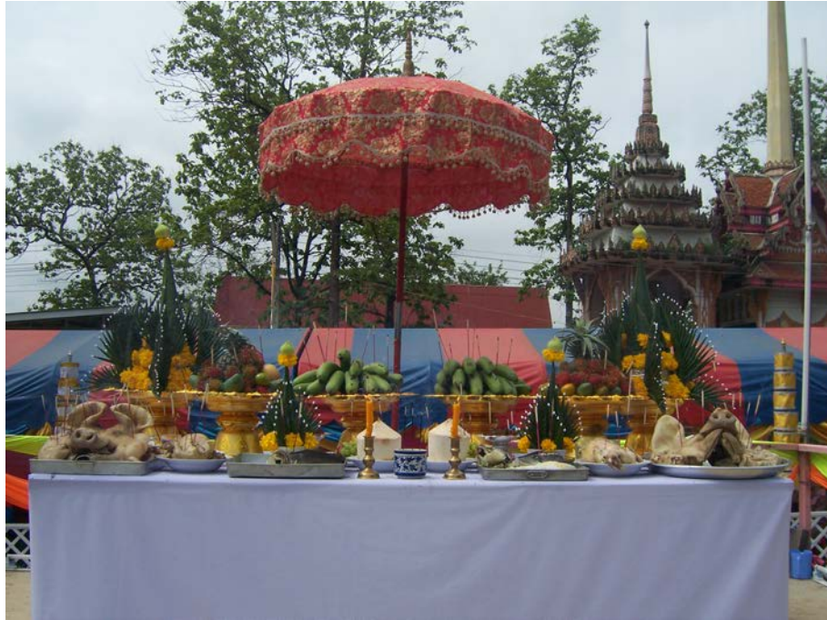
พิธีบวงสรวง

การบริหารจัดการวัฒนธรรมท้องถิ่นเพื่อสร้างความสามัคคีในชุมชน : กรณีศึกษาประเพณีกวนข้าวหมูป่าส(ข้าวทิพย์) ของวัดเกษมจิตตาราม อำเภอเมืองอุตรดิตถ์ จังหวัดอุตรดิตถ์