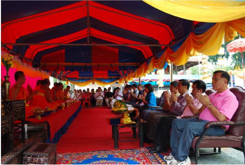
พิธีสงฆ์

การบริหารจัดการวัฒนธรรมท้องถิ่นเพื่อสร้างความสามัคคีในชุมชน : กรณีศึกษาประเพณีกวนข้าวหมูปายาส(ข้าวทิพย์) ของวัดเกษมจิตตาราม อำเภอเมืองอุตรดิตถ์ จังหวัดอุตรดิตถ์