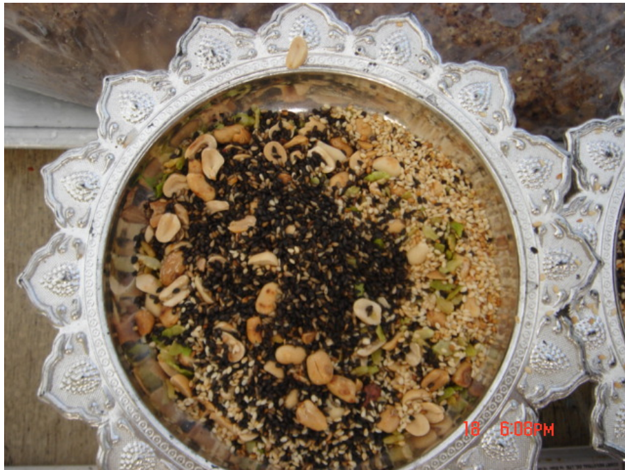
วัสดุ อุปกรณ์กวนข้าวมธุปายาส(ข้าวทิพย์) ัญพืช(งาคั่ว,งาขาว,ถั่วลิสง,ข้าว)