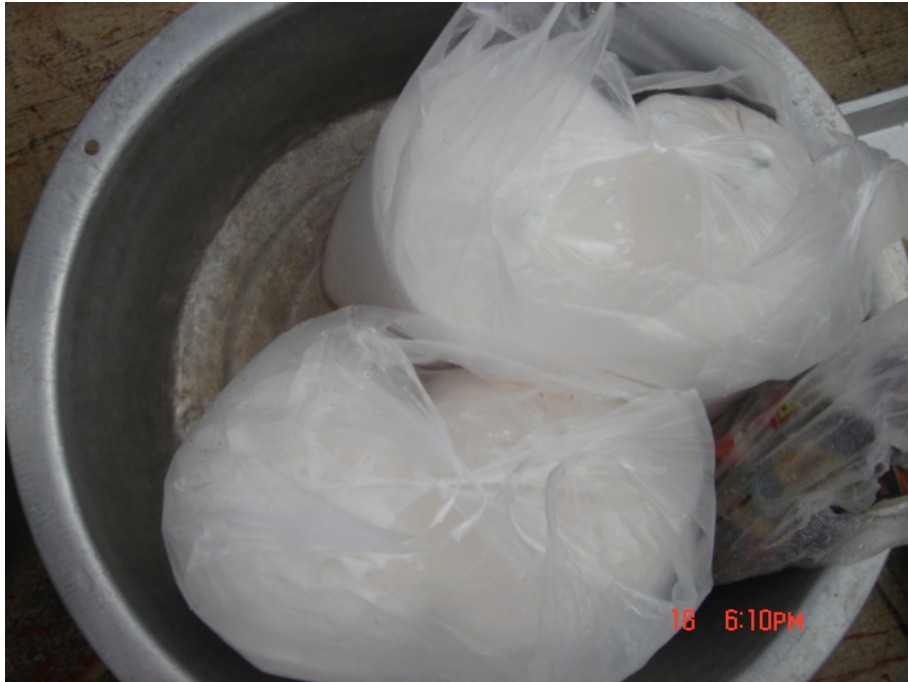
วัสดุ อุปกรณ์กวนข้าวมธุปายาส(ข้าวทิพย์) หัวกะทิ

ของวัดเกษมจิตตาราม อำเภอเมืองอุตรดิตถ์ จังหวัดอุตรดิตถ์