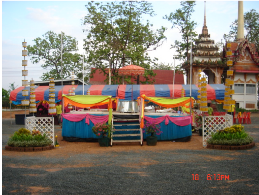
สถานที่จัดพิธีกวนข้าวมรุปายาส(ข้าวทิพย์) กลางวัน

การบริหารจัดการวัฒนธรรมท้องถิ่นเพื่อสร้างความสามัคคีในชุมชน : กรณีศึกษาประเพณีกวนข้าวมรุปายาส(ข้าวทิพย์) ของวัดเกษมจิตตาราม อำเภอเมืองอุตรดิตถ์ จังหวัดอุตรดิตถ์