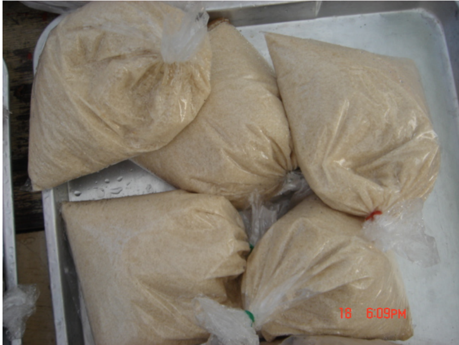
วัสดุ อุปกรณ์กวนข้าวมธุปายาส(ข้าวทิพย์) น้ำตาลทราย

ของวัดเกษมจิตตาราม อำเภอเมืองอุตรดิตถ์ จังหวัดอุตรดิตถ์