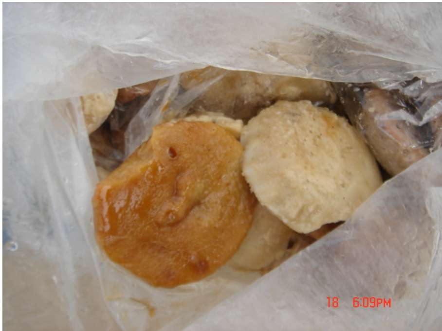
วัสดุ อุปกรณ์กวนข้าวมธุปายาส(ข้าวทิพย์) น้ำตาลปี๊บ