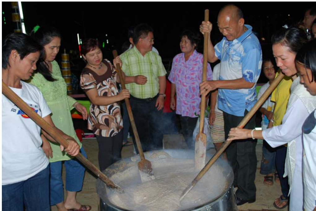
ประชาชน เริ่มกวนข้าวมธุปายาส(ข้าวทิพย์)