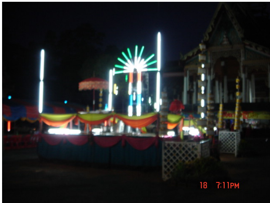
สถานที่จัดพิธีกวนข้าวมรุปายาส(ข้าวทิพย์) กลางคืน