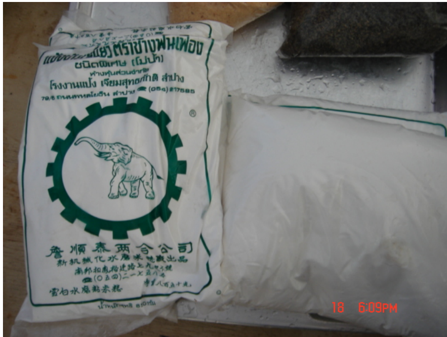
วัสดุ อุปกรณ์กวนข้าวมธุปายาส(ข้าวทิพย์) แป้งข้าวเหนียว

ของวัดเกษมจิตตาราม อำเภอเมืองอุตรดิตถ์ จังหวัดอุตรดิตถ์