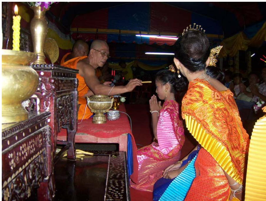
นางฟ้า เข้าสู่พิธีกวนข้าวมรุปายาส(ข้าวทิพย์)