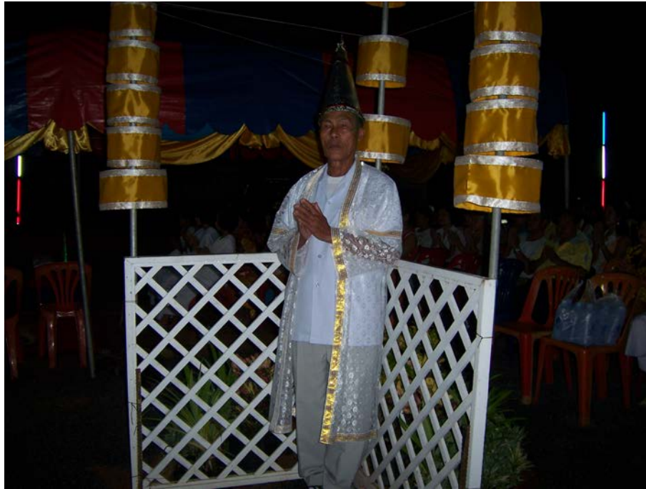
เทวดา ยืนประจำทิศ เข้าสู่พิธีกวนข้าวมธุปายาส(ข้าวทิพย์)

ของวัดเกษมจิตตาราม อำเภอเมืองอุตรดิตถ์ จังหวัดอุตรดิตถ์