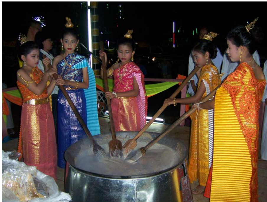
นางฟ้า เริ่มกวนข้าวมธุปายาส(ข้าวทิพย์)