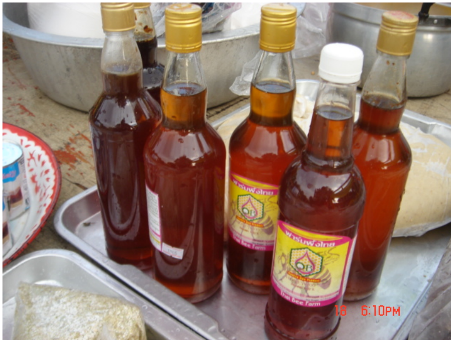
วัสดุ อุปกรณ์กวนข้าวมธุปายาส(ข้าวทิพย์) น้ำผึ้ง