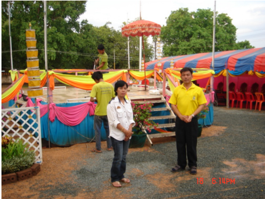
ทีมศึกษาวิจัยพิธีกวนข้าวมธุปายาส(ข้าวทิพย์)

การบริหารจัดการวัฒนธรรมท้องถิ่นเพื่อสร้างความสามัคคีในชุมชน : กรณีศึกษาประเพณีกวนข้าวมธุปายาส(ข้าวทิพย์) ของวัดเกษมจิตตาราม อำเภอเมืองอุตรดิตถ์ จังหวัดอุตรดิตถ์