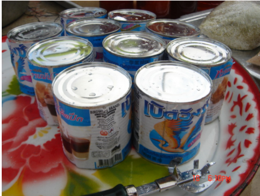
วัสดุ อุปกรณ์กวนข้าวมธุปายาส(ข้าวทิพย์) นมจืด

ของวัดเกษมจิตตาราม อำเภอเมืองอุตรดิตถ์ จังหวัดอุตรดิตถ์