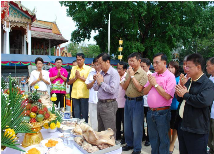
พิธีบวงสรวง