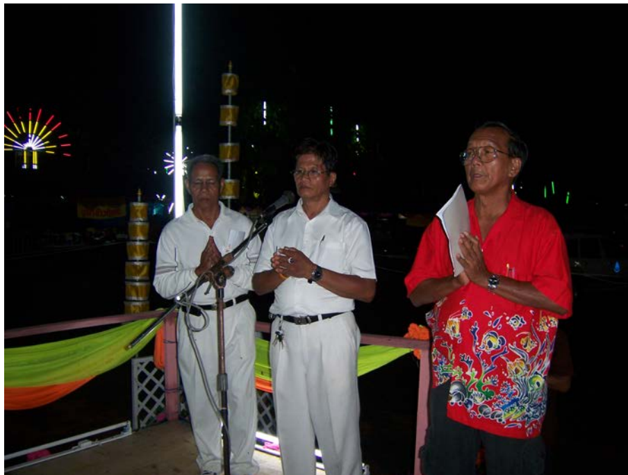
ศาสนพิธีกรเริ่มเข้าสู่พิธีการกวนข้าวหมูปายาส(ข้าวทิพย์)