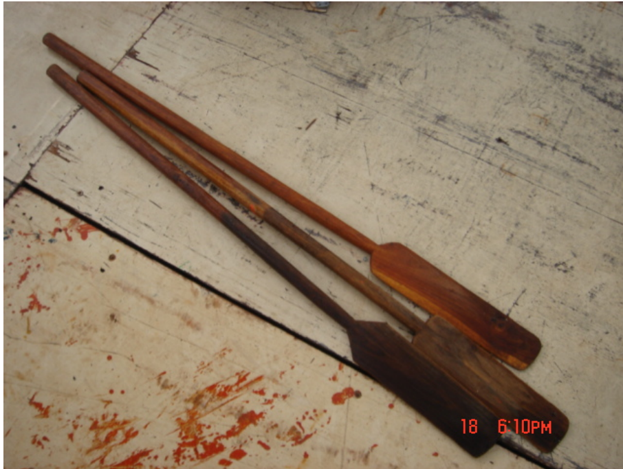
วัสดุ อุปกรณ์กวนข้าวมธุปายาส(ข้าวทิพย์) ไม้พาย

ของวัดเกษมจิตตาราม อำเภอเมืองอุตรดิตถ์ จังหวัดอุตรดิตถ์