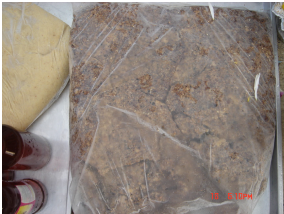
วัสดุ อุปกรณ์กวนข้าวมธุปายาส(ข้าวทิพย์) แปะแซ