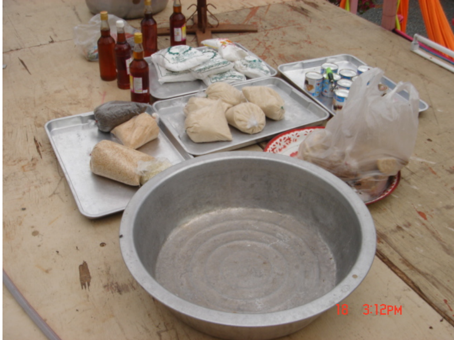
วัสดุ อุปกรณ์กวนข้าวมรุธปายาส(ข้าวทิพย์)

ของวัดเกษมจิตตาราม อำเภอเมืองอุตรดิตถ์ จังหวัดอุตรดิตถ์