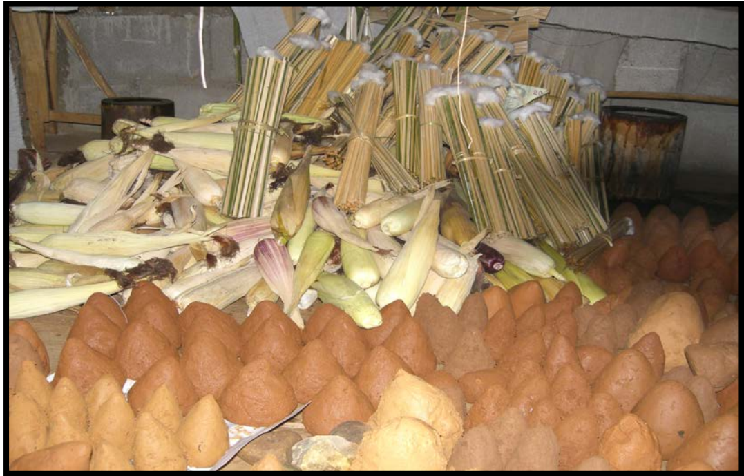
รูปที่ 3 วัสดุประกอบพิธีกรรมทำบุญข้าวโพด ( ชามา ตาเว)