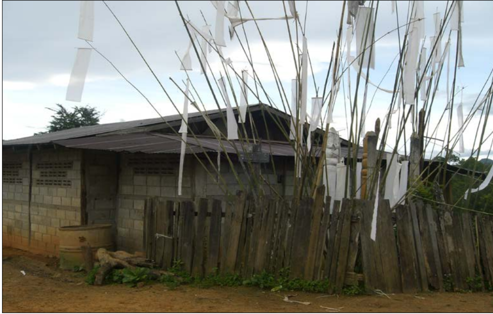
รูปที่ 5 ศาลประกอบพิธีกรรมหมู่บ้าน หอแห่