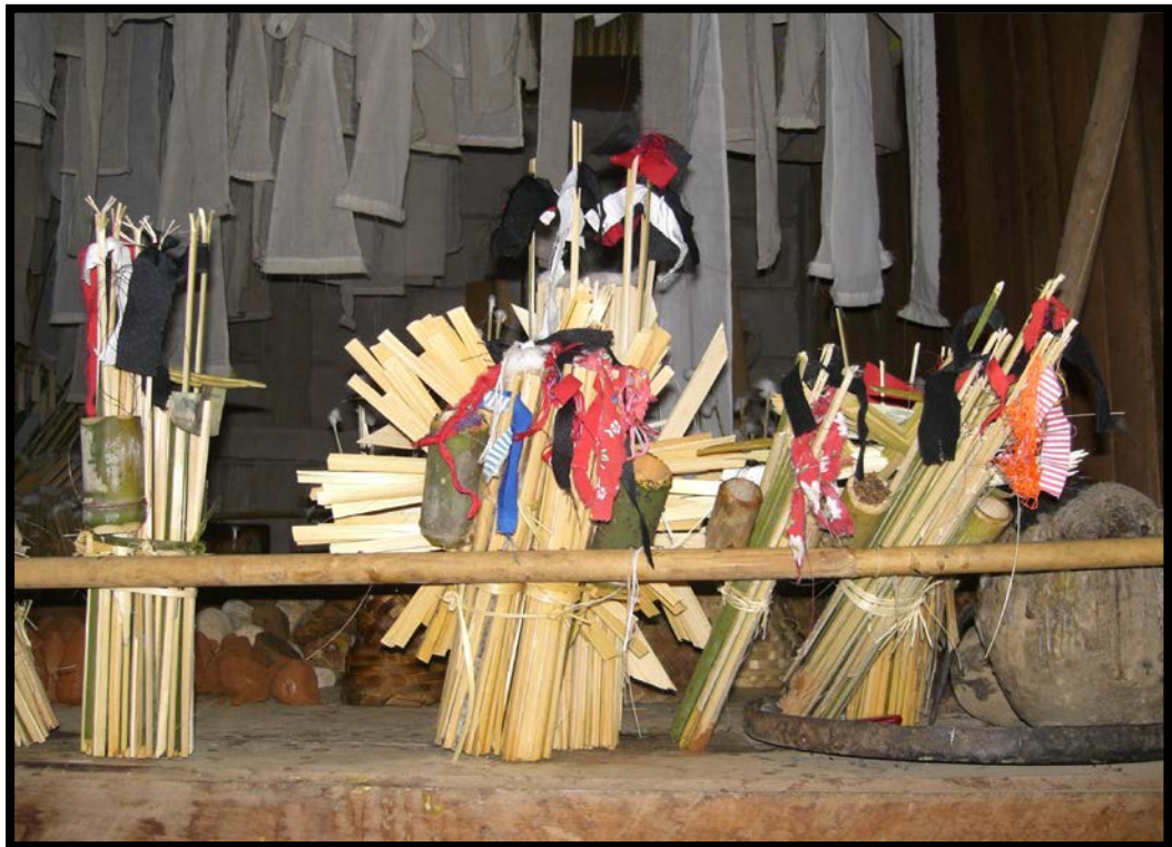
รูปที่ 4 อุปกรณ์ประกอบพิธีกรรมทำบุญข้าวโพด ( ชามา ตาเว)