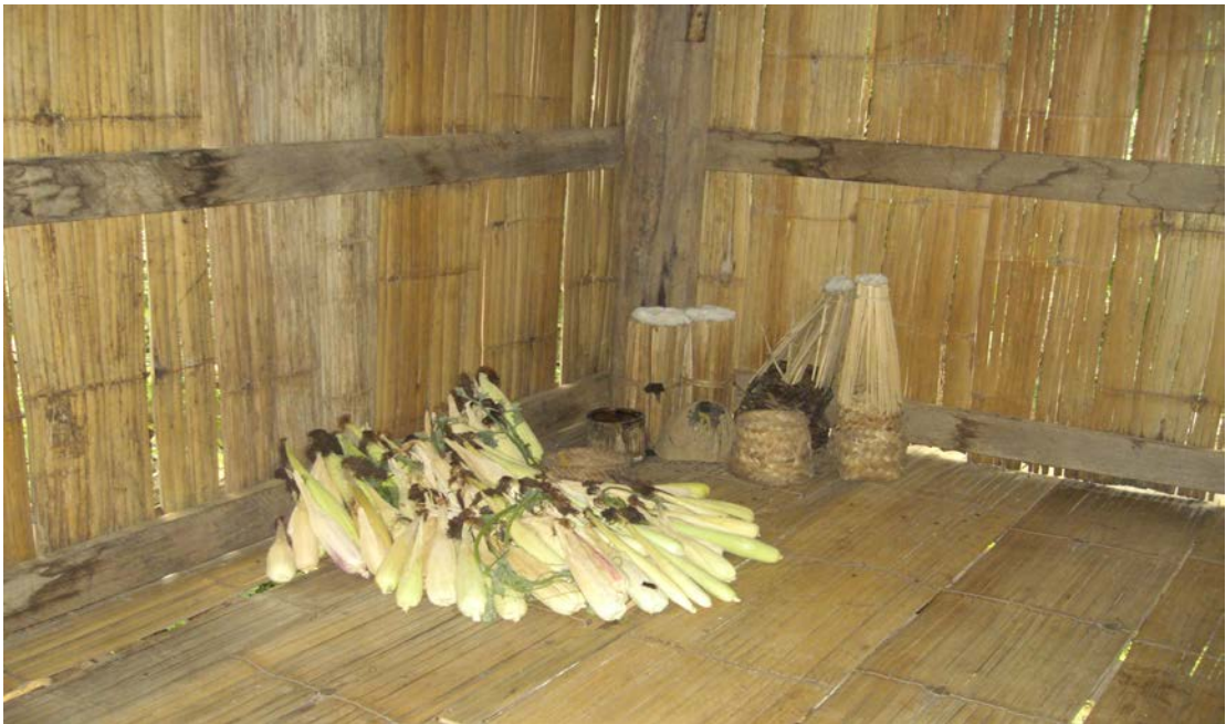
รูปที่ 10 ทำบุญข้าวโพด (ชามา ตาเว) ที่ครัวเรือน