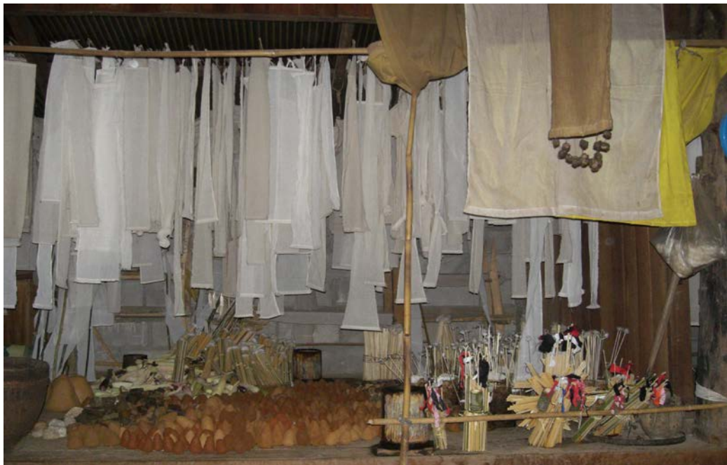
รูปที่ 6 การตกแต่งภายในหอแห่