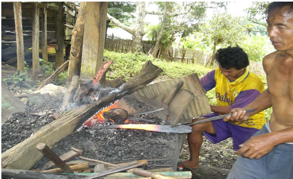
รูปที่ 12 เตาและการเผาเหล็ก