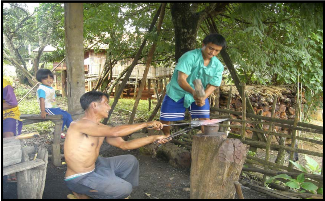
รูปที่ 13 การตีเหล็ก