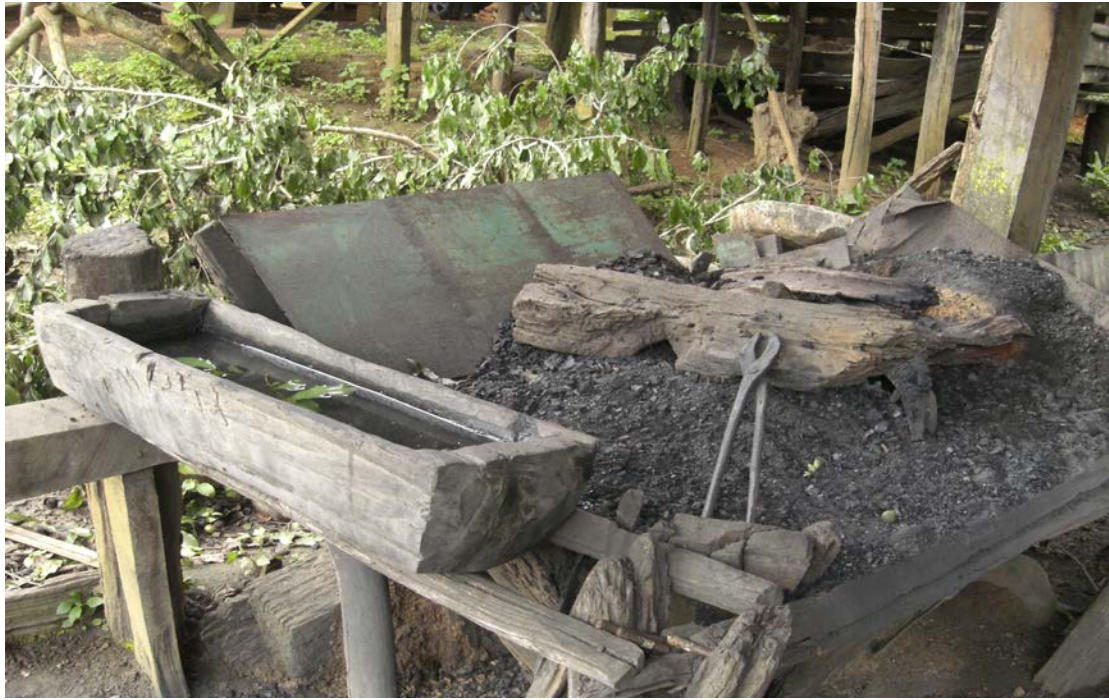
รูปที่ 11 เตาตีเหล็ก