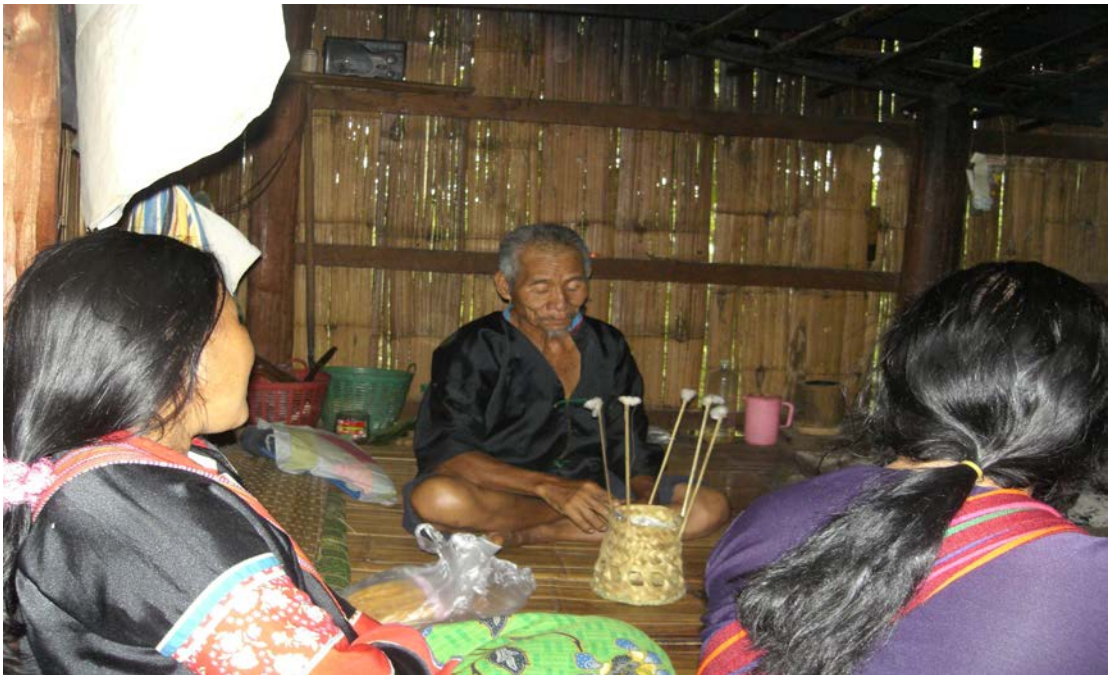
รูปที่ 8 การทำพิธีสะเดาะเคราะห์