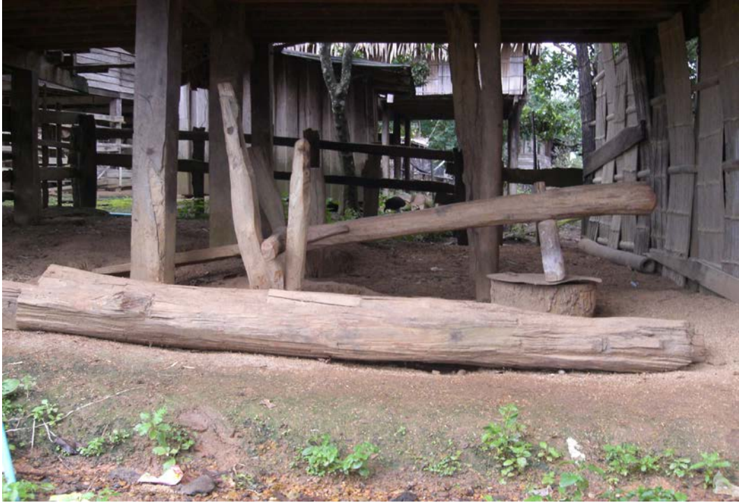
รูปที่ 9 ครกตำข้าวเปลือก