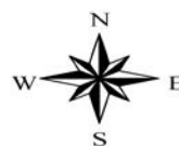
รูปที่ 2 แสดงขอบเขตชุมชน