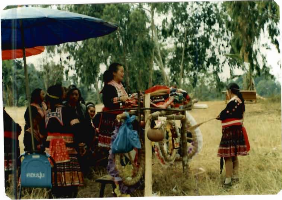
ผู้หญิงม้ง(บน) และผู้ชายม้ง (ล่าง) กับพิธีศพแบบดั้งเดิม (ความสัมพันธ์กับชุมชนเดิม)