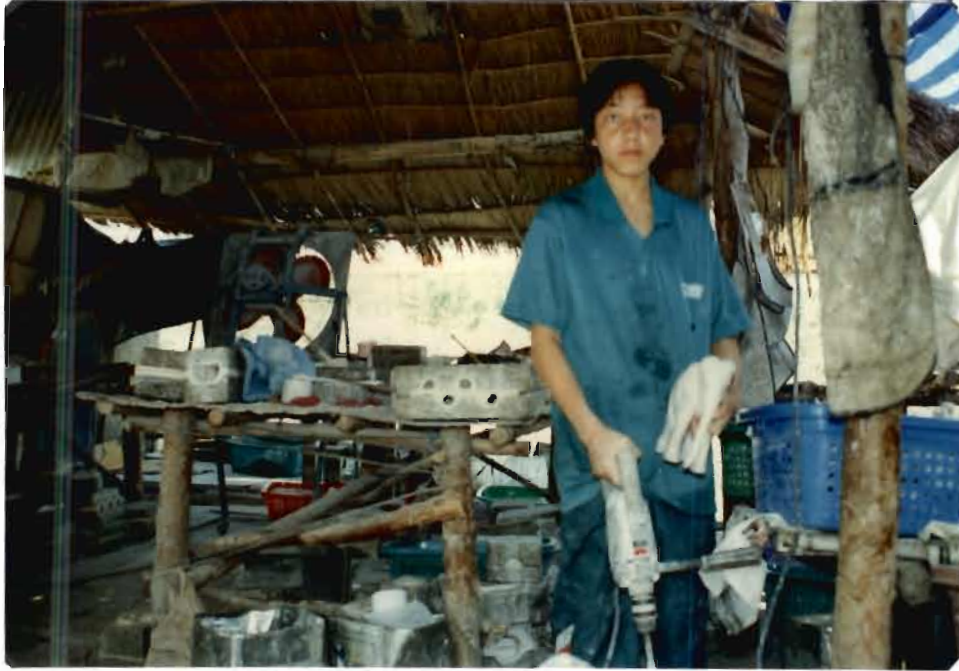
(บน) ผู้ชายม้งกับการหล่อรูปเรซิน (ล่าง) ผู้หญิงม้งกับการขัดและย้อมสีรูปเรซิน