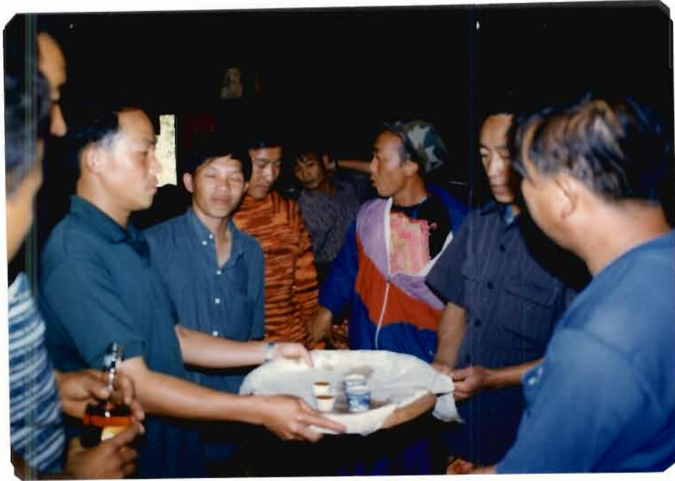
(บน) พิธีเชิญแขกผู้มีเกียรติขึ้นนั่งโต๊ะในพิธีตั้งชื่อใหม่ (ล่าง) แขกผู้มีเกียรติขณะนั่งโต๊ะพิธี (ความสัมพันธ์กับชุมชนเดิม)