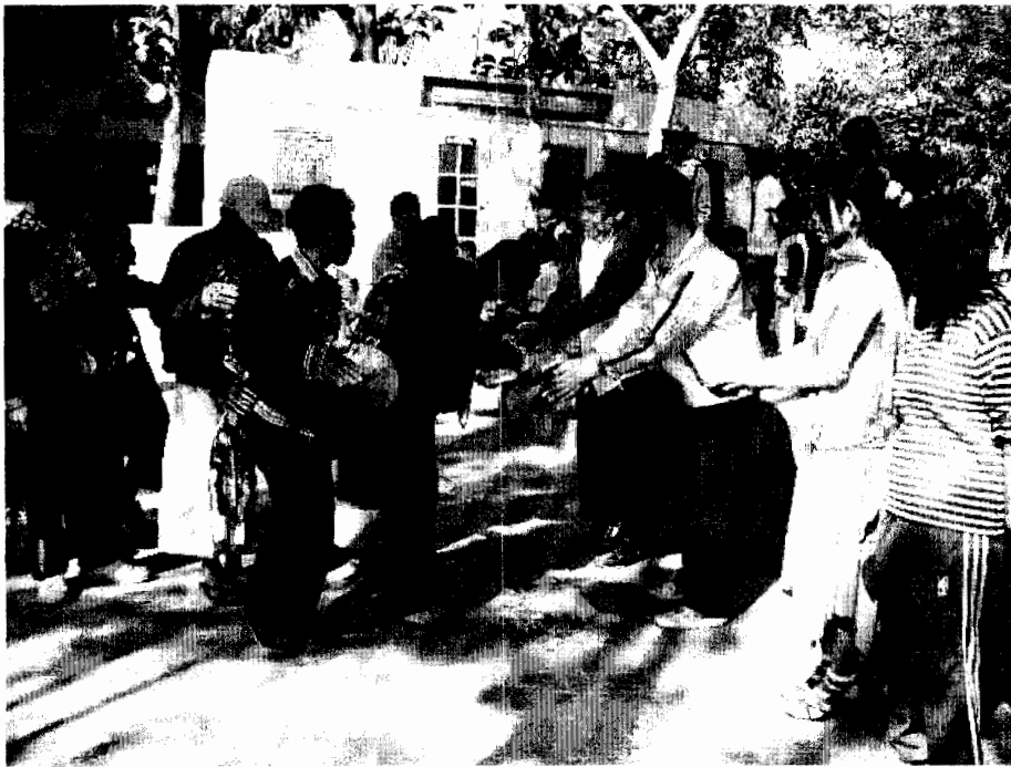
การคำห้วยครูที่โรงเรียนบ้านสันตน์คู

ในวันที่สอง คำห้วยคนเฒ่าคนแก่ในหมู่บ้าน ผู้หลักผู้ใหญ่ญาติพี่น้องต้องคำ ให้หมอด เริ่มจากญาติพี่น้องที่อายุมากกว่าเรา แล้วจึงคำห้วยคนอื่นในหมู่บ้าน เอาข้าว ปลุกและข้าว ของเครื่องใช้ต่าง ๆ ตลอดถึงเงิน ถ้าใครมี ไผ่มีสตางค์ก็เอาสตางค์ ไผ่มี เสื้อผ้าก็เอาเสื้อผ้า เอาไปให้ทานหื้อไปทานในวันที่ 2 ที่ 3 จะคำห้วยคนภายนอก สร้างความสัมพันธ์ การคำห้วยพ่อหลวงเพราะ นับถือ ขอบคุณที่เราได้อยู่ในพื้นที่ ขอบคุณที่เขาได้ปกครองให้เรา ถ้าไม่ได้เป็นพ่อหลวงแล้วก็ไม่ไป ถ้าใครได้เป็นก็ไป คำห้วยคนนั้น อย่างครูบาอาจารย์ก็เช่นกันก็ต้องไปคำห้วย ของที่จะนำไปคำห้วย มีข้าว ปลุกและเนื้อหมูตากแห้งเป็นของหลัก