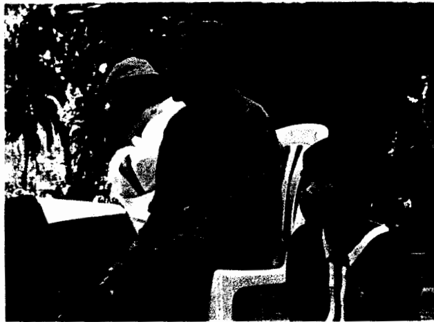
พ่ออุ้ยหนานจันท์ คนเมืองอพยพมาหาที่ทำกิน