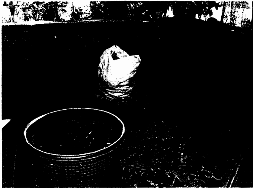
แม่เผ่าคัมมะเขือ

ข้าว ปลูกช่วงเดือนมิถุนายนถึงกันยายน กระเทียมปลูกช่วงตุลาคมถึงมกราคม ผักกาด / พริกทอง ปลูกช่วงกุมภาพันธ์ถึงเมษายน ซึ่งการปลูกพืชแต่ละ ชนิดใน 1 ปีนั้นขึ้นอยู่กับว่าใครจะปลูกอะไร บางบ้านจะมีการปลูกตลอดปี แต่บางบ้าน