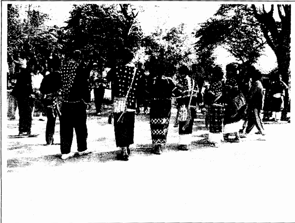
การเต้น “ท่าเคอะ” หรือ “จะคี” ที่โรงเรียนบ้านสันตน์คู

การเข้าวอจะมีการเต้น ท่าเคอะ คนไทยเรียก จะคี คงจะมาจากการได้ยินเสียงเต้นรำ เป็นชื่อการเต้นตอนที่มีการกินวอ เป็นการเต้นที่มีจังหวะกลอง แคน มีคนนำเต้น เรียกว่า สล่า ถ้าสล่าเริ่มดนตรีจังหวะใดคนอื่นก็ต้องทำตามและถ้าสล่าเต้นท่าใด คนอื่นก็ต้องเต้นตามให้เข้ากับจังหวะและพร้อมเพียงกันส่วนมากจะเต้นตอน กลางคืน ทุกคืน