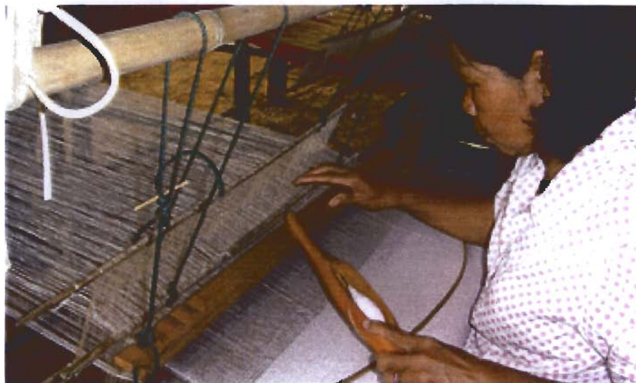
การทอผ้าพื้นเมือง