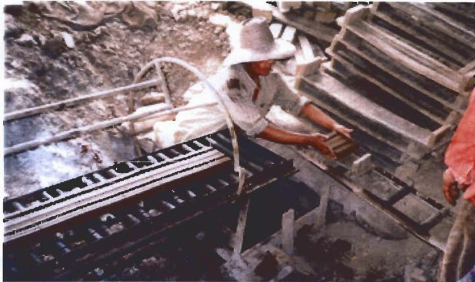
การบั่นอิฐ