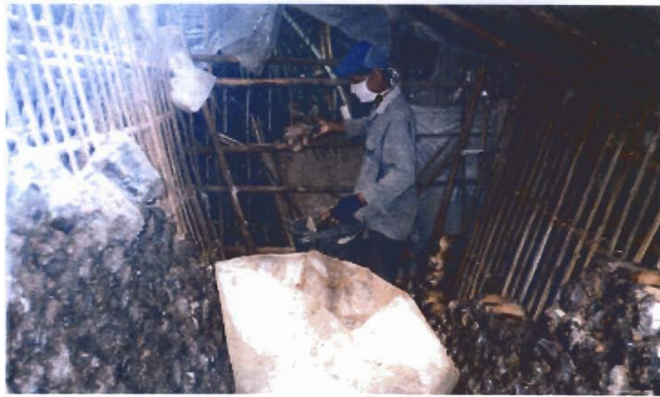
การเพาะเห็ด