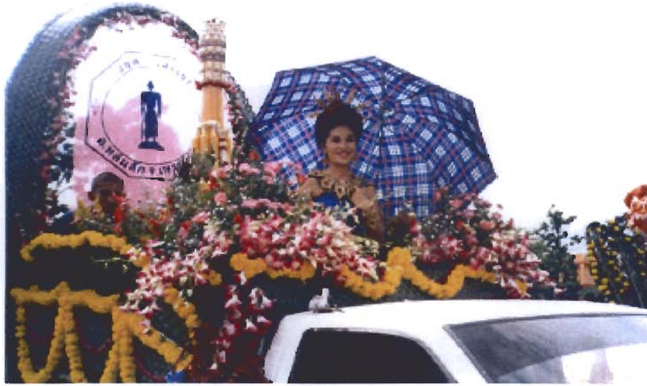
เทศกาลแห่เทียนพรรษา