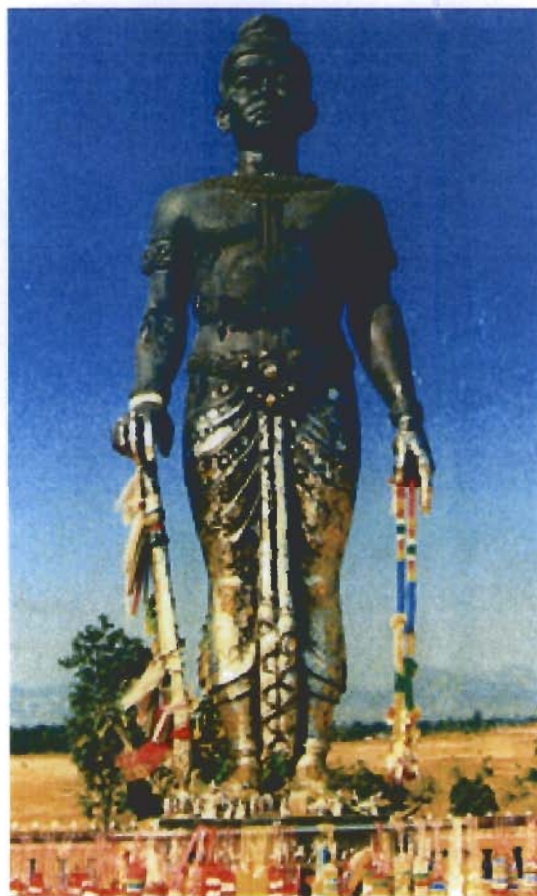
อนุสาวรีย์พ่อขุนผาเมือง ตั้งอยู่ ณ สีแยกหล่มสัก อำเภอหล่มสัก