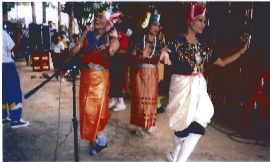
การละเล่นแมงต๋บเต๋า