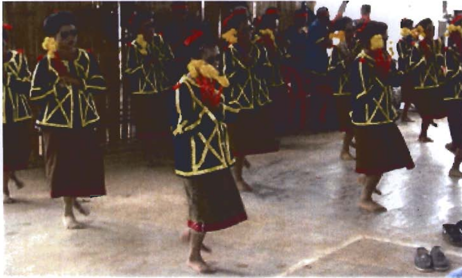
รำเสื้อแขบลาน (แถบลาน)