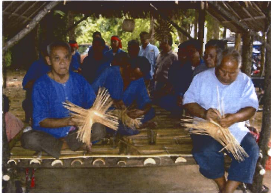
การจักสานไม้ไผ่