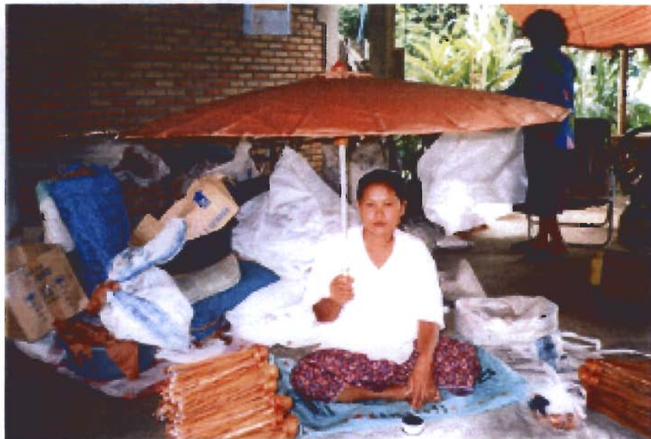
การทำกลดสำหรับพระธุดงค์