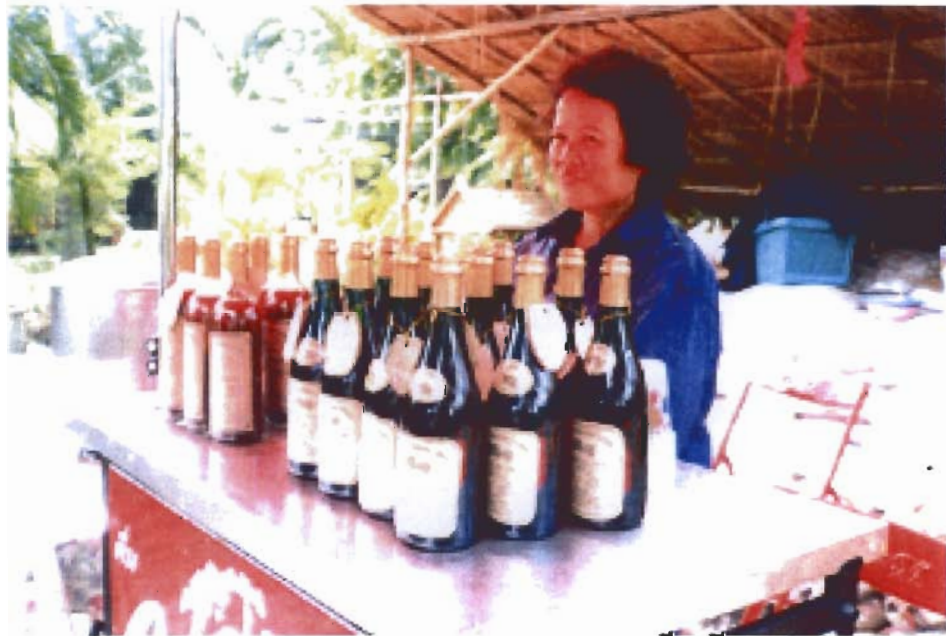
การทำไวน์กระชายดำ