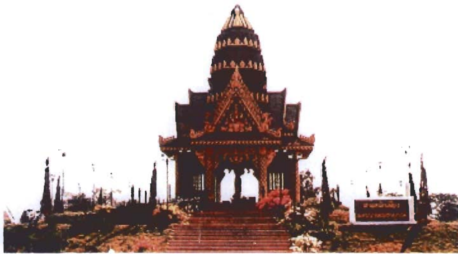
ศาลหลักเมืองนครบาลเพชรบูรณ์ อำเภอหล่มสัก จังหวัดเพชรบูรณ์