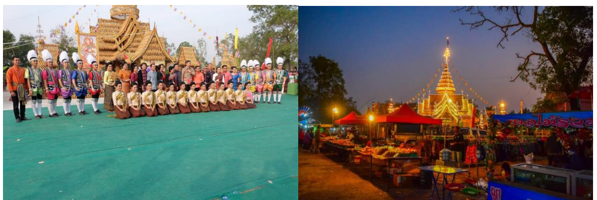
ภาพที่ 6 การแสดงและการประดับประดาไฟ แสง สี สมโภชงานบุญคุณลาน ปราสาทรวงข้าว