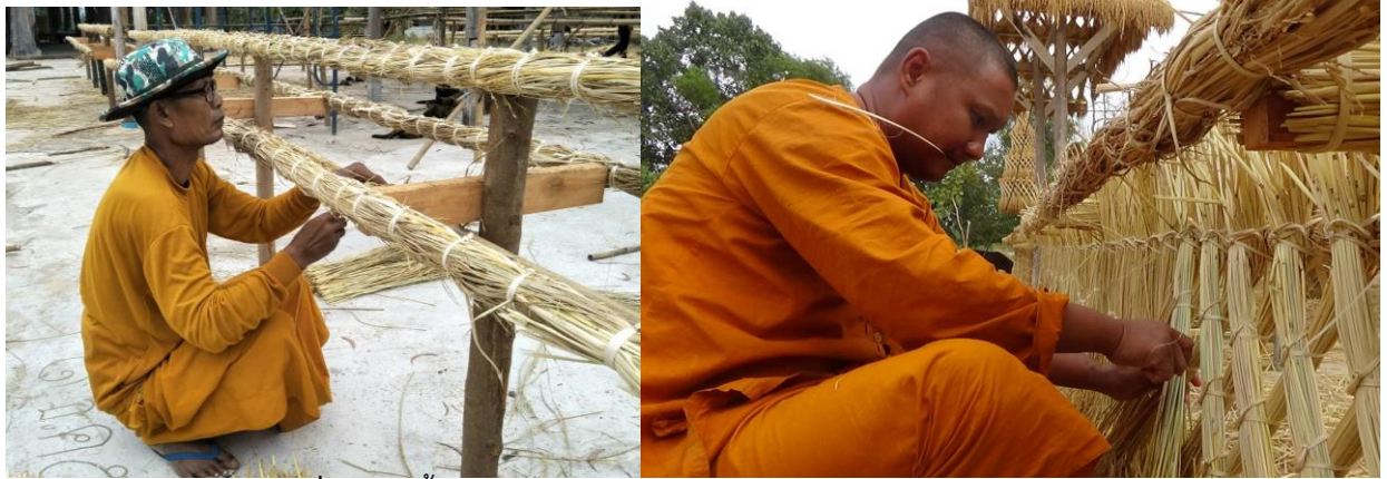
ภาพที่ 4 การขึ้นโครงสร้างปราสาทรวงข้าวด้วยรวงข้าวและต้นข้าว