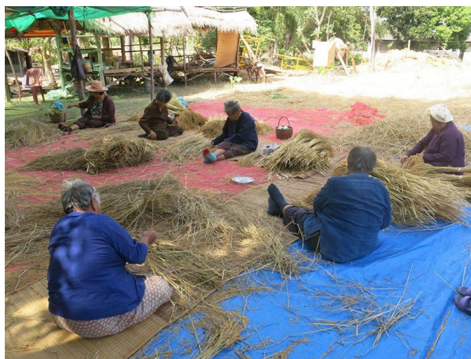
ภาพที่ 3 การมัดรวงข้าว ให้เป็นกำ เพื่อนำไปมัดขึ้นเป็นปราสาทรวงข้าว