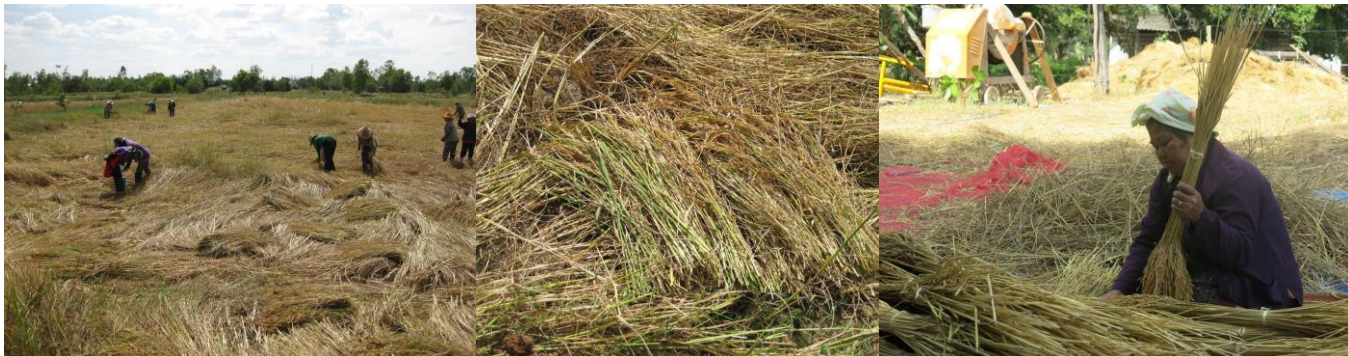
ภาพที่ 2 การเกี่ยวรวงข้าว และการมัดรวงข้าว