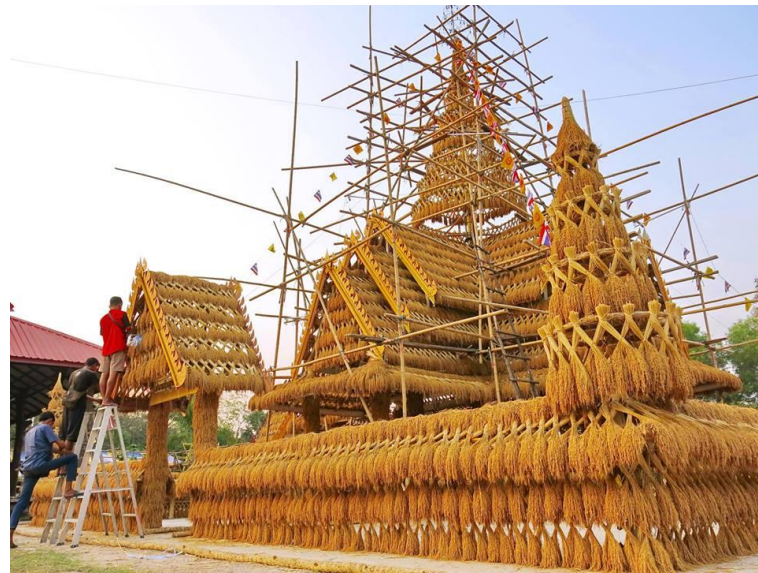
ภาพที่ 5 การนำรวงข้าวขึ้นประกอบเป็นปราสาท รูปทรงจัตุรมุข