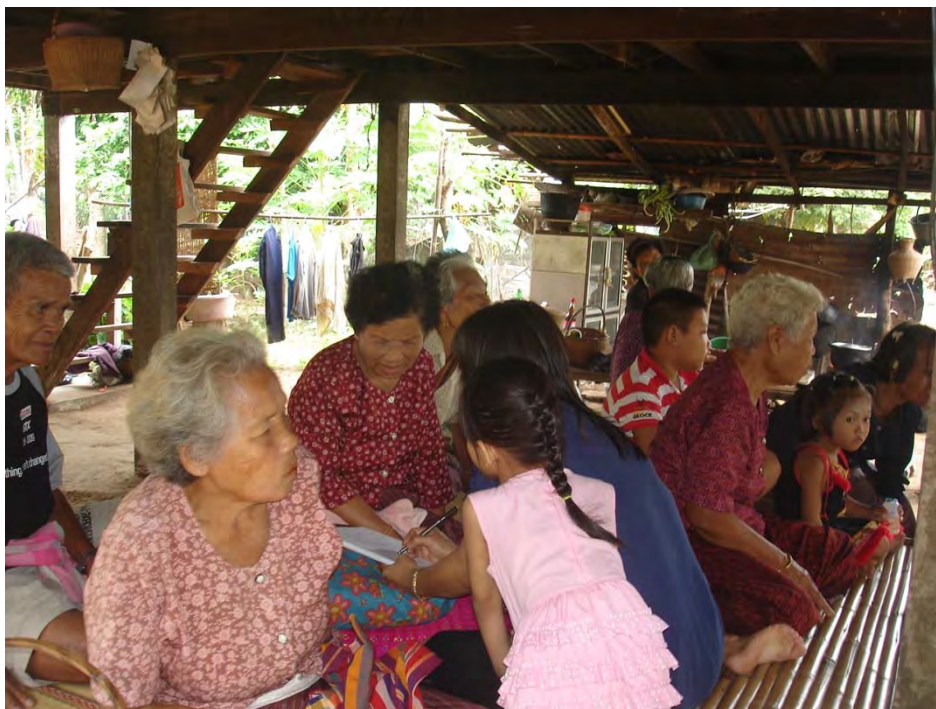
ภาพประกอบ ๒๐ การเก็บข้อมูลจากการสัมภาษณ์