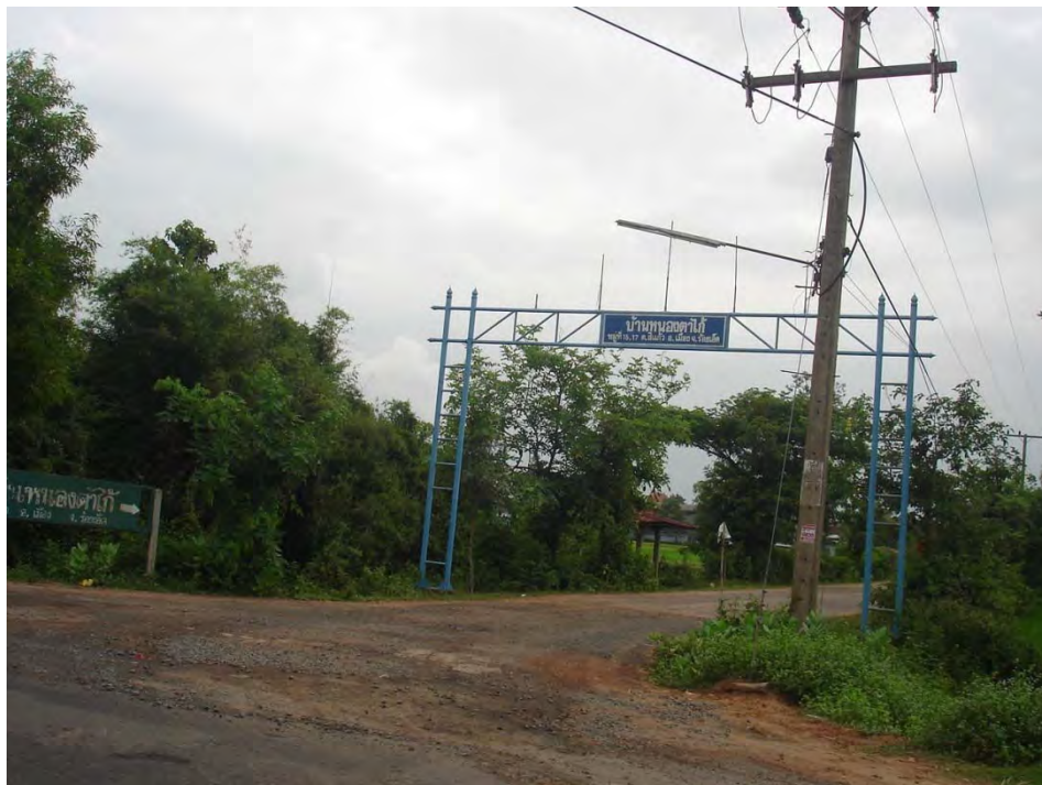
ภาพประกอบที่ ๑๘ บ้านหนองตาไก่ หมู่ ๑๖ ต.สีแก้ว อ.เมืองร้อยเอ็ด จ.ร้อยเอ็ด