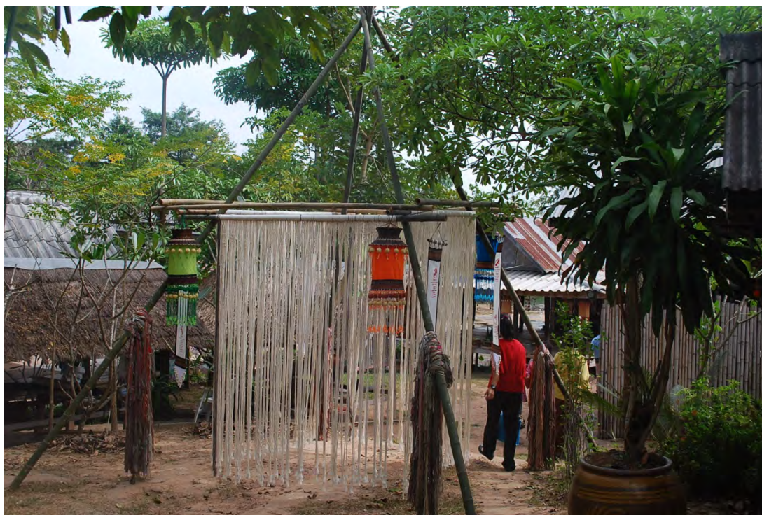
การทำทอเที่ยวเชิงอนุรักษ์ขนบธรรมเนียมประเพณีของบ้านวังน้ำมอก