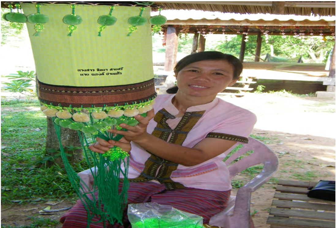
การสาธิตการทำโคมไฟพาดของบ้านวังน้ำมอก