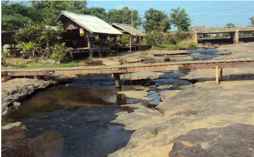
สถานที่พักของนักท่องเที่ยวในการเข้าพักแบบโฮมสเตย์