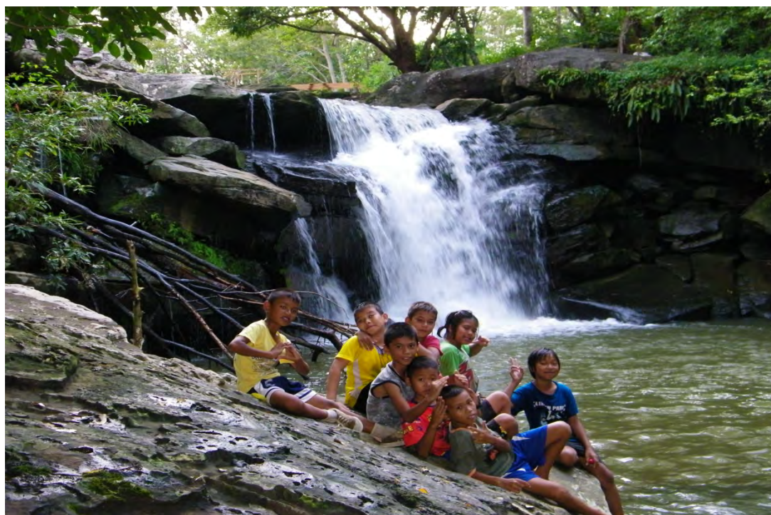
การท่องเที่ยวเชิงอนุรักษ์การรวมกลุ่มองค์กรของเด็กรักษ์ป่าบ้านวังน้ำมอก