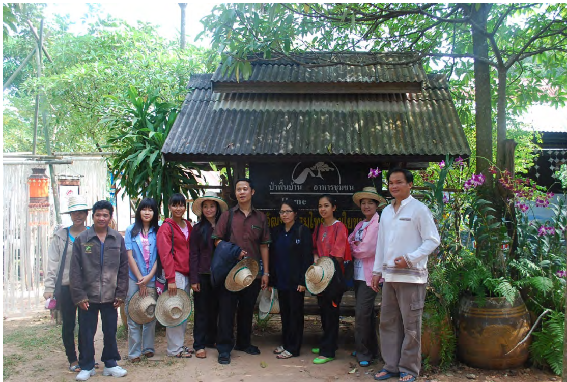
คณะนักวิจัยถ่ายรูปท่องเที่ยวเชิงอนุรักษ์ “ป่าพื้นบ้าน อาหารชุมชน”