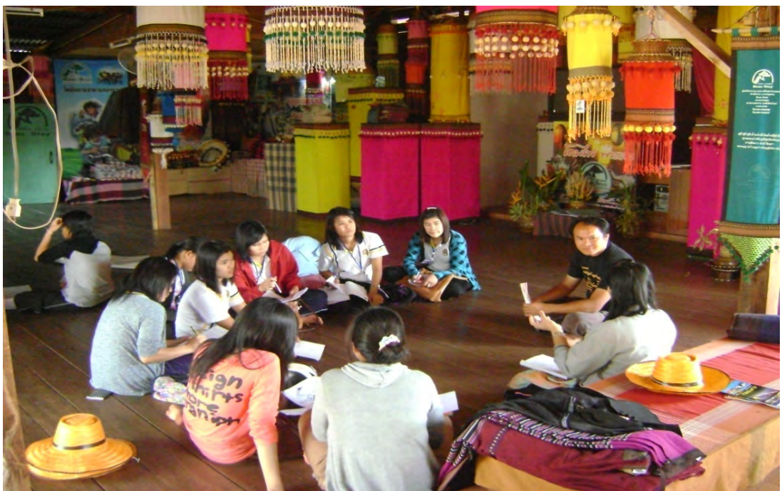
สัมภาษณ์การจัดตั้ง Home stayและรูปแบบการท่องเที่ยวเชิงอนุรักษ์