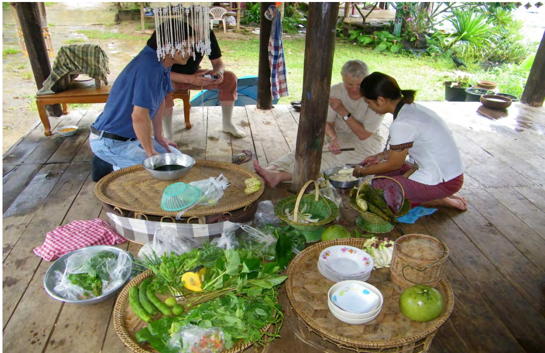
การท่องเที่ยวเชิงอนุรักษ์การรวมกลุ่มองค์กรทำอาหารพื้นเมือง