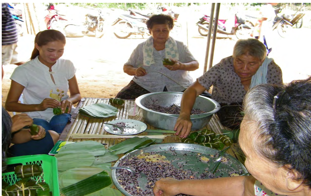
การทำของเที่ยวเชิงอนุรักษ์การรวมกลุ่มองค์กรของบ้านวังน้ำมอก