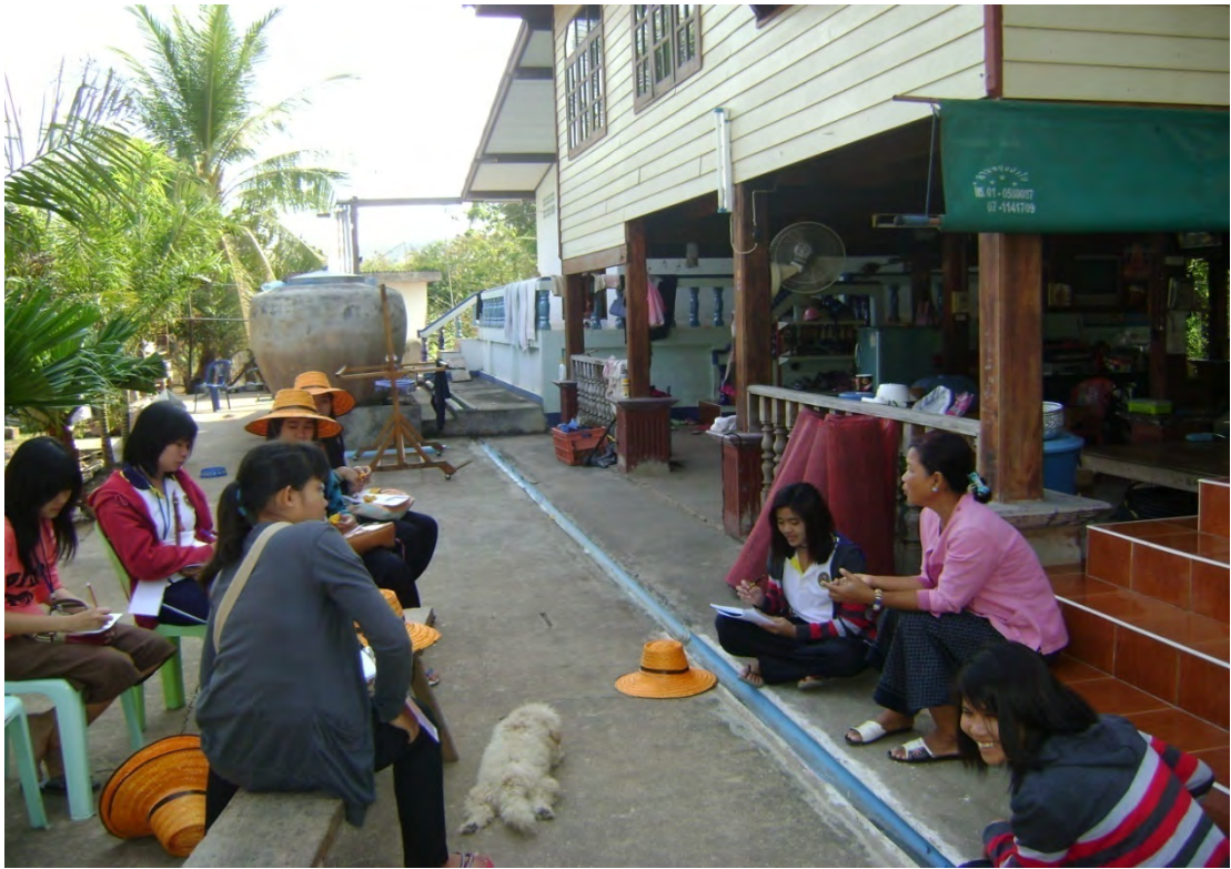
คณะนักวิจัยสัมภาษณ์เพื่อเก็บข้อมูลชุมชนบ้านวังน้ำมอก