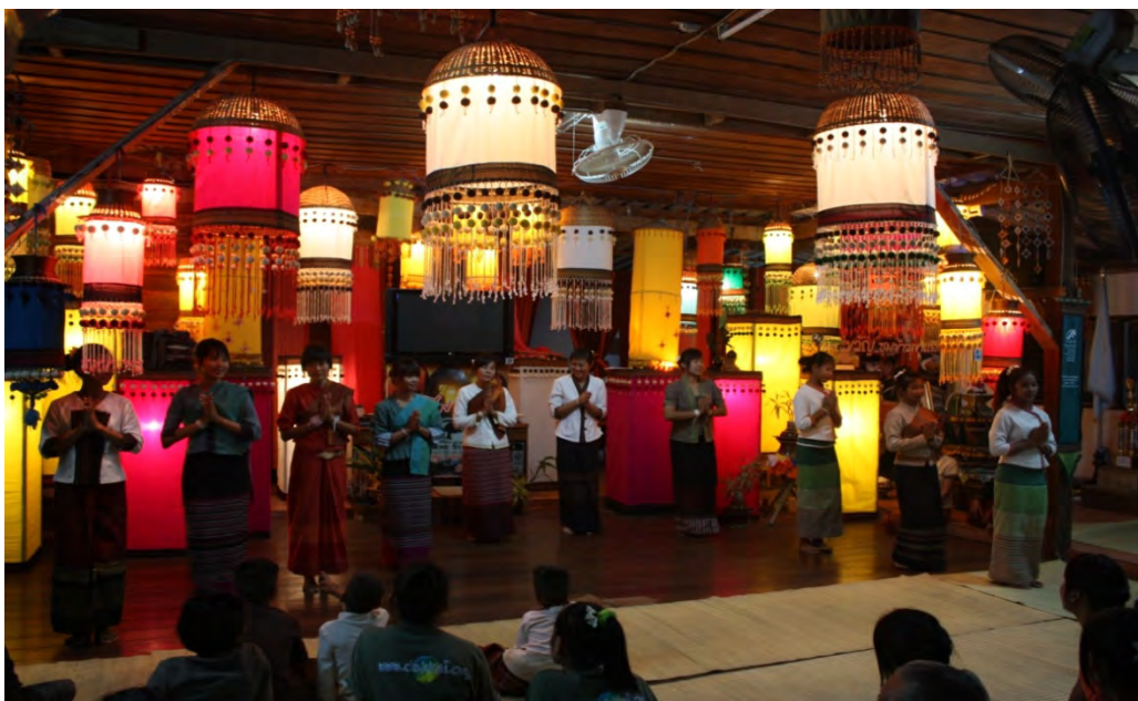
การแสดงรำพื้นบ้านรักษาขนบธรรมเนียมประเพณีของบ้านวังน้ำออก