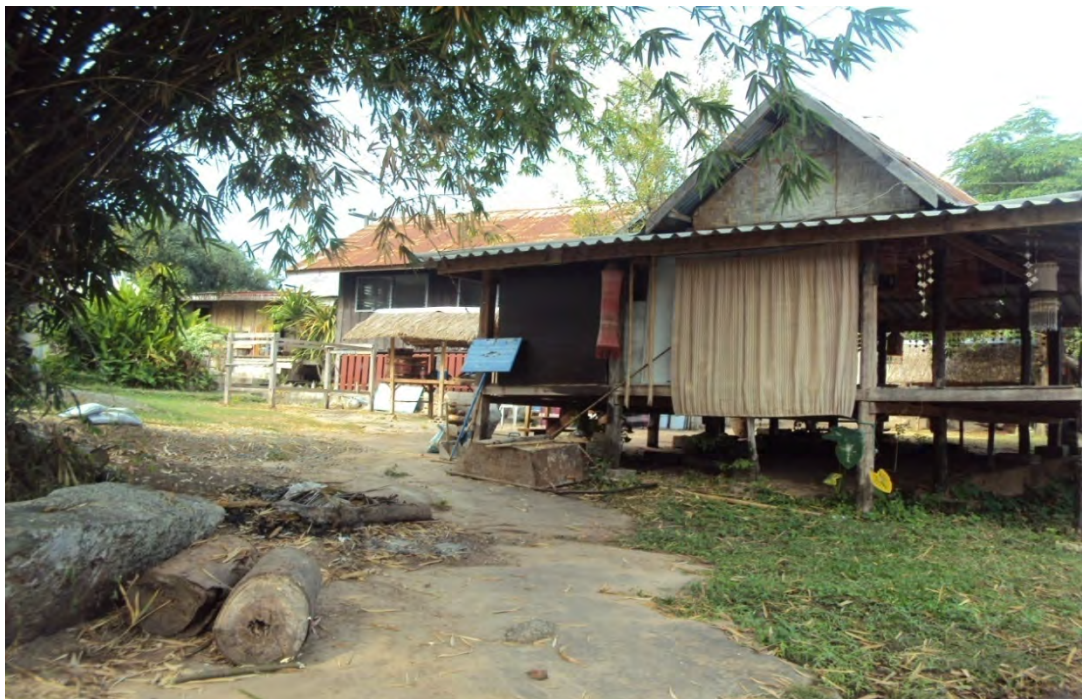
Home stay ที่พักของนักท่องเที่ยว