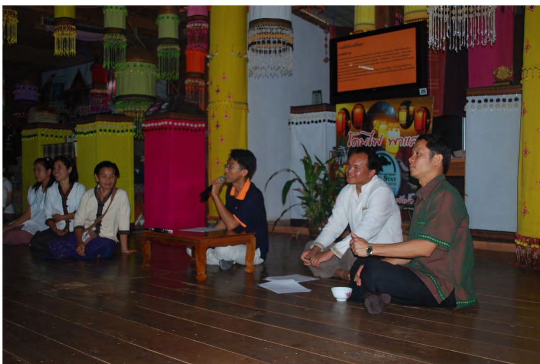
กิจกรรมการสนทนากลุ่ม( Focus Group Interview )