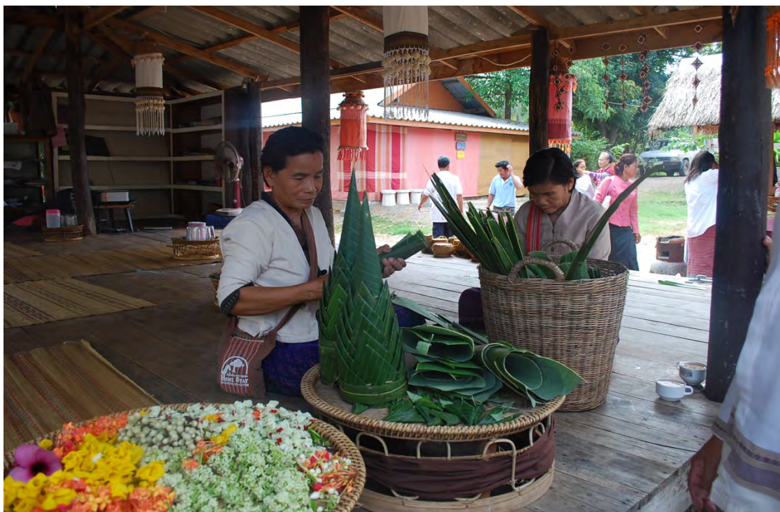
กลุ่มอนุรักษ์ประเพณีและวัฒนธรรมของบ้านวังน้ำมอก