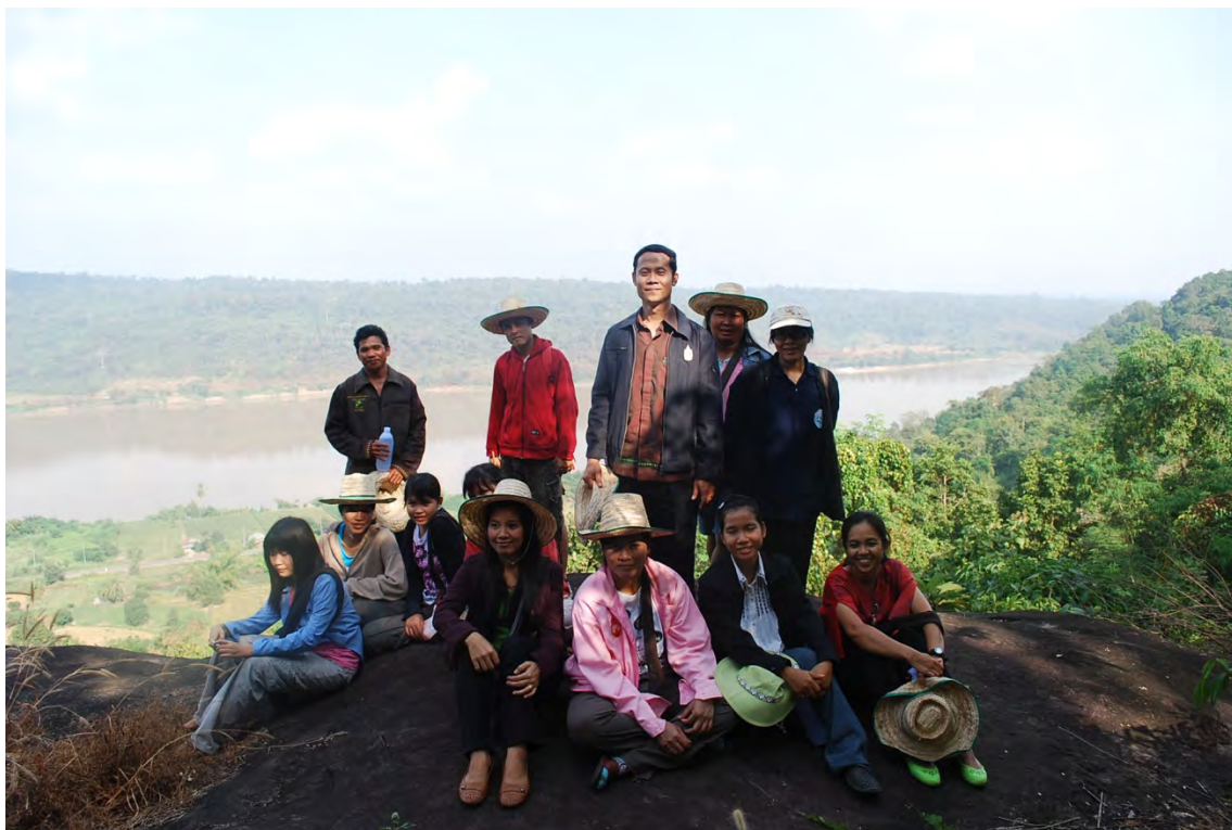
คณะนักวิจัยถ่ายรูปร่วมกับกลุ่มอนุรักษ์ทรัพยากรธรรมชาติ