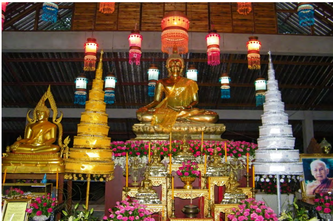
พระพุทธรูปล้านทอง วัดเทสรังสีที่เป็นที่เคารพบูชาของบ้านวังน้ำมอก