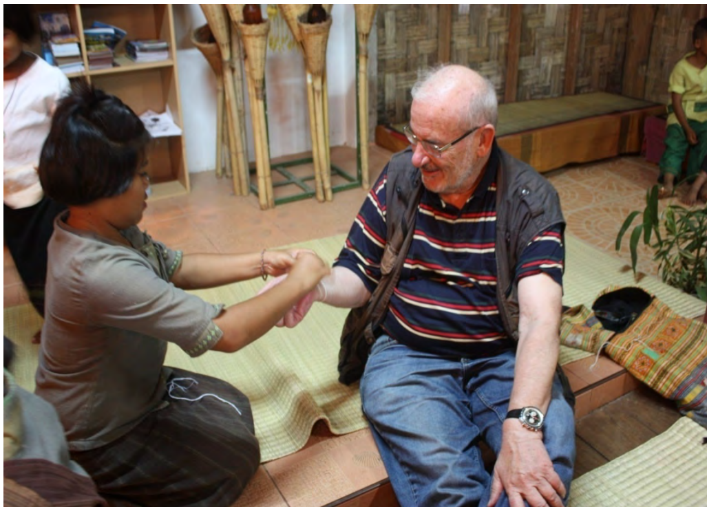
ชาวต่างชาติที่มาร่วมงานโฮมพาลงและผูกฝ้ายบายศรีสู่ขวัญ