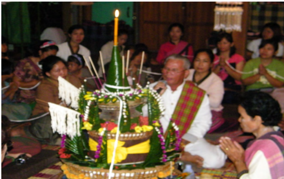
การทำพิธีพืชมบายศรีสู่ขวัญของบ้านวังน้ำมอก