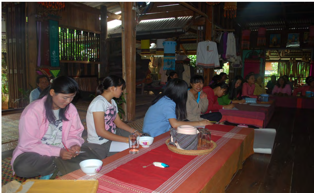
คณะนักวิจัยร่วมกันสัมภาษณ์และเก็บข้อมูลการรวมกลุ่มองค์กรของชาวบ้านวังน้ำมอก