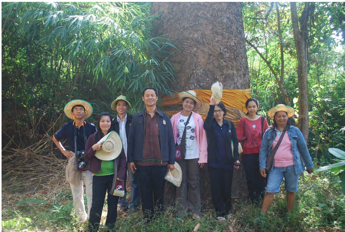
คณะนักวิจัยสำรวจพื้นที่การท่องเที่ยวเชิงอนุรักษ์บ้านวังน้ำมอก