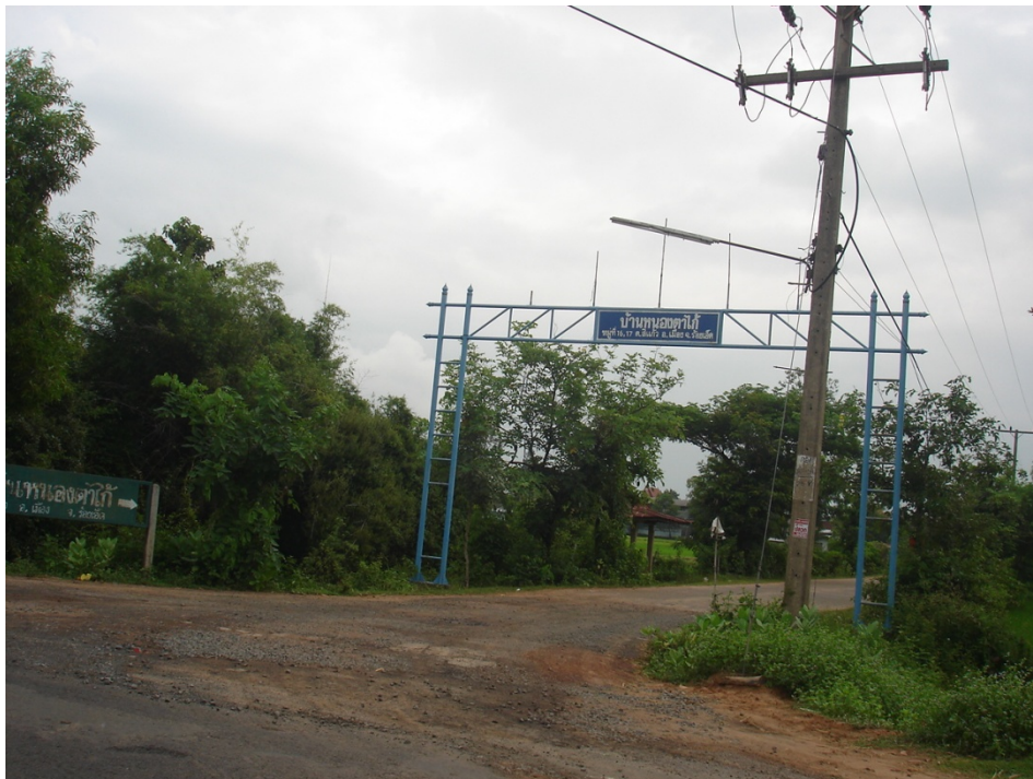
ภาพประกอบที่ ๑๘ บ้านหนองตาไก่ หมู่ ๑๖ ต.สีแก้ว อ.เมืองร้อยเอ็ด จ.ร้อยเอ็ด