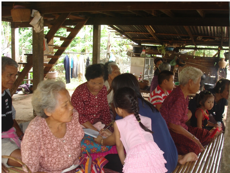
ภาพประกอบ ๒๐ การเก็บข้อมูลจากการสัมภาษณ์