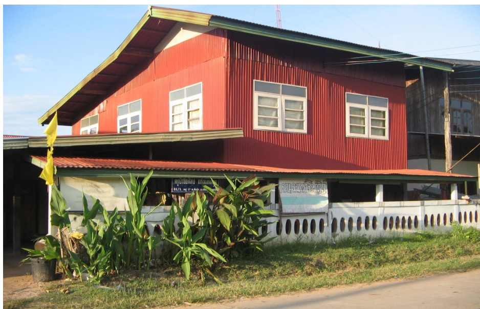
ภาพประกอบ ๑๙ บ้านนายบัวไชยศิลป์ แก้วแสนไชย