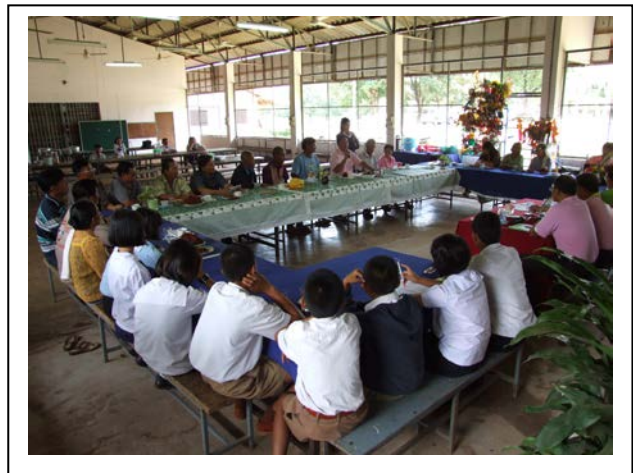
บรรยากาศการเสวนา ในภาพรวม ประกอบด้วยผู้นำสถานศึกษา ผู้นำชุมชน ภูมิปัญญา นักเรียน