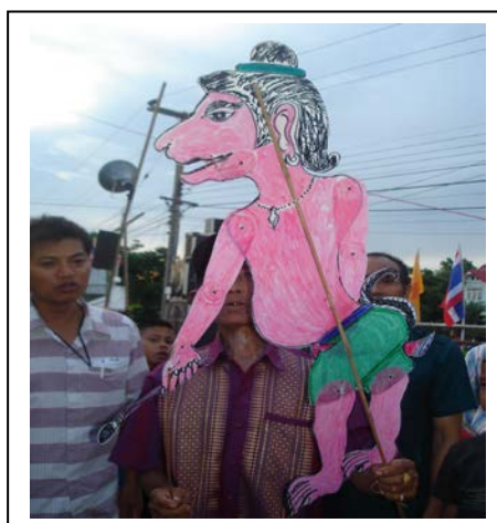
ภาพที่ ๑๙ “ปลัดต่อ”