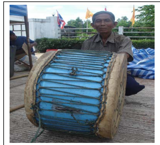
ภาพที่ ๑๒ กลองหนังตะลุง