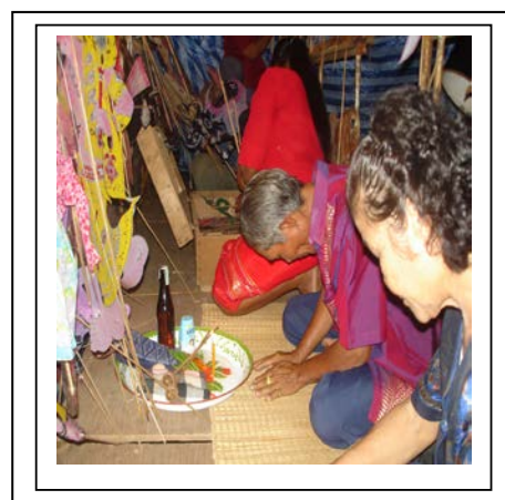
ภาพที่ ๒ : เครื่องกาย