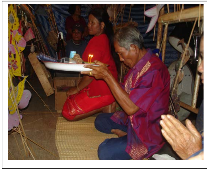
ภาพที่ ๔ : พิธี “ยกอ้อ ยอกครู”