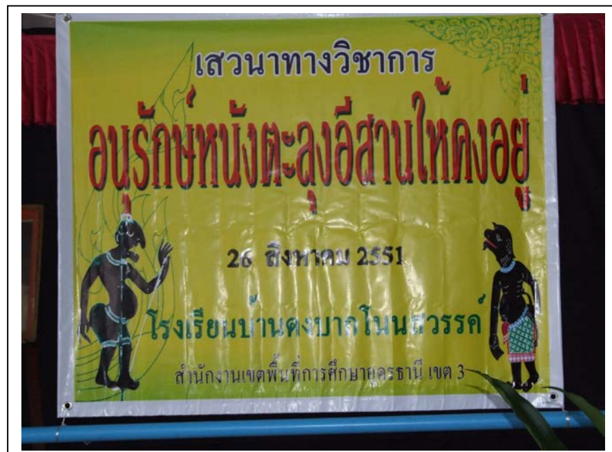
ภาพกิจกรรมการจัดเสวนาทางวิชาการ อนุรักษ์หนังตะลุงอีสาน

ลักษณะสภาพโดยทั่วไปของพื้นที่วิจัย หมู่บ้าน ดงบาก โนนสวรรค์ หมู่ที่ ๘, ๙, ๑๒ และโรงเรียน บ้านดงบ้านโนนสวรรค์ ตำบลหนองไผ่ อำเภอ หนองหาน จังหวัดอุดรธานี