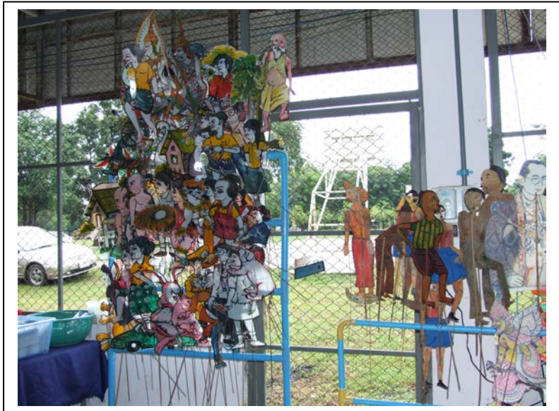
ตัวละครที่ โรงเรียนบ้านดงบากโนน สวรรค์ ที่ผลิตเป็นสื่อนวัตกรรมสอน เด็ก ภาพกลุ่มใหญ่ผลิตด้วยพลาสติก กลุ่มเล็ก ผลิตด้วยหนังวัว