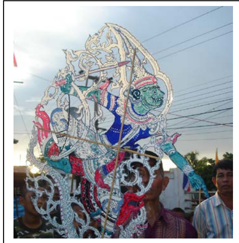
ภาพที่ ๒๖ “อินทรชิต”

๕. อินทรชิต : เป็นลูกของนางมณโฑและทศกัณฐ์แต่เดิมชื่อ “ รณพัทธร์ ”