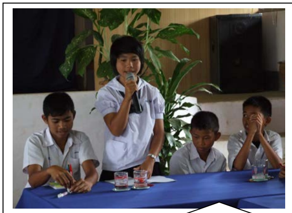
นักเรียนนำเสนอการพากย์ หนังตะลุง และเสนอความคิดเห็นต่อการอนุรักษ์ และนำมาจัดทำเป็นหลักสูตรท้องถิ่น