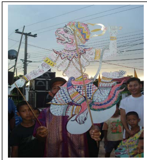
ภาพที่ ๒๕ “หนุมาน”

๘. หนุมาน : เกิดจากนางสวาหะกับพระพาย ตั้งครรภ์ ๓๐ เดือน มีตรีเพชรเป็นกาย