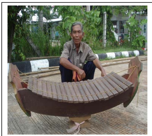
ภาพที่ ๑๓ ระนาด