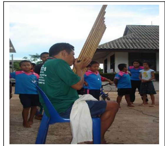
ภาพที่ ๑๖ แคน