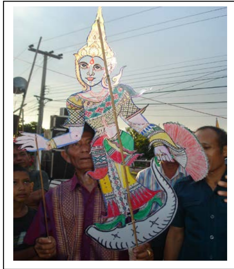
ภาพที่ ๒๔ “นางสีดา”