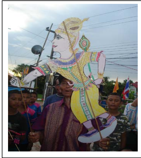
ภาพที่ ๒๒ “พญามาริต”