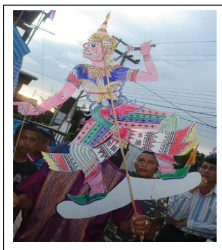
ภาพที่ ๒๑ “ ลิงอุ้ง ”