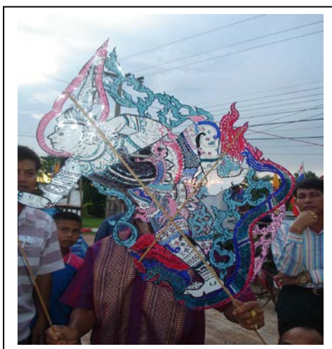
ภาพที่ ๒๐ “ พระราม ”

๓. พระราม : พระนารายณ์อวตารมาเกิดเป็นพระโอรสท้าวทศรถศกษัตริย์กรุงอโยธยากับนางเกาสุริยา