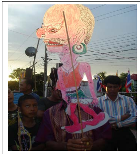
ภาพที่ ๒๓ “ผีเสื้อเมืองลงกา”