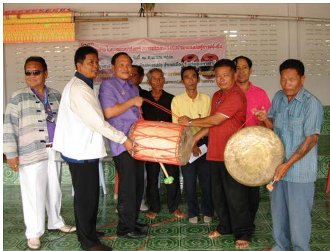
การมอบกลองและฟังฮาดแก่กำนันตำบลหนองบ่อ เพื่อมอบให้แก่สถานศึกษาต่อไป