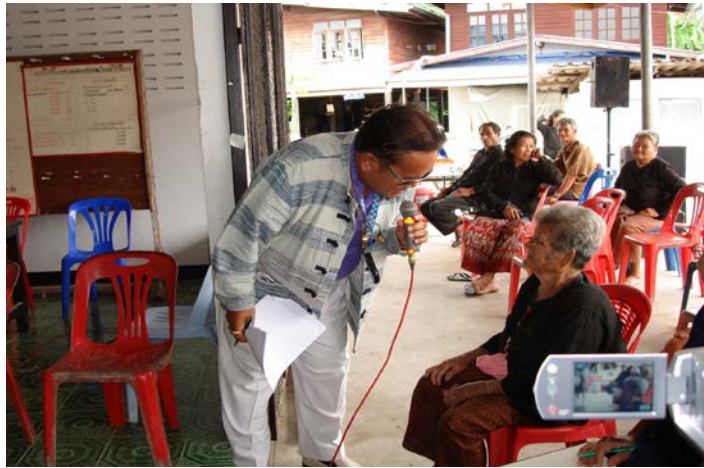
ประชาชนมีส่วนร่วม