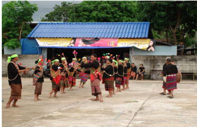
ลักษณะการฟ้อนถอยหลัง