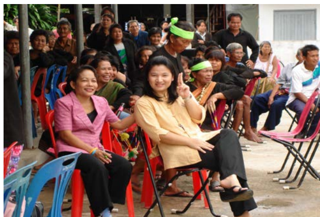
นักวิชาการวัฒนธรรมจังหวัดอุบลราชธานี ร่วมพบปะ สัมผัสกับชาวบ้าน