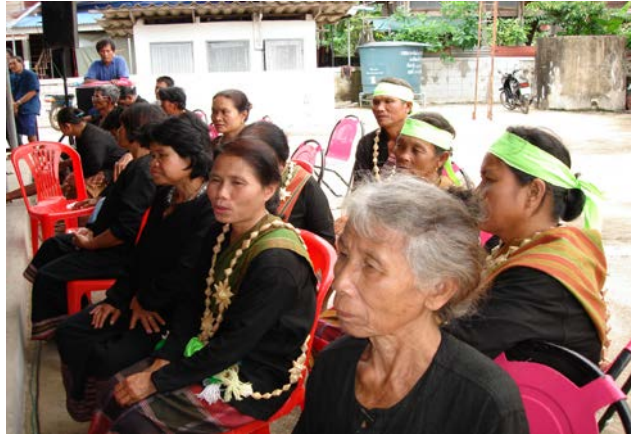
ชาวบ้านร่วมกิจกรรมเวทีเสวนา