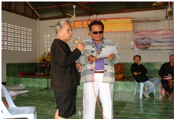
การมีส่วนร่วมของชาวบ้านในปัญหาของชุมชน