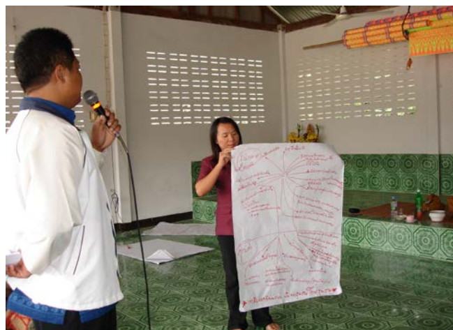
สรุปประเด็นจากเวทีเสวนา