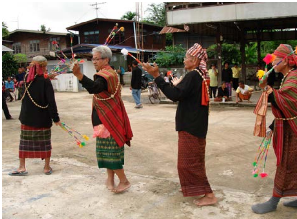
การฟ้อนแบบดั้งเดิม (ผู้ชายรำ)