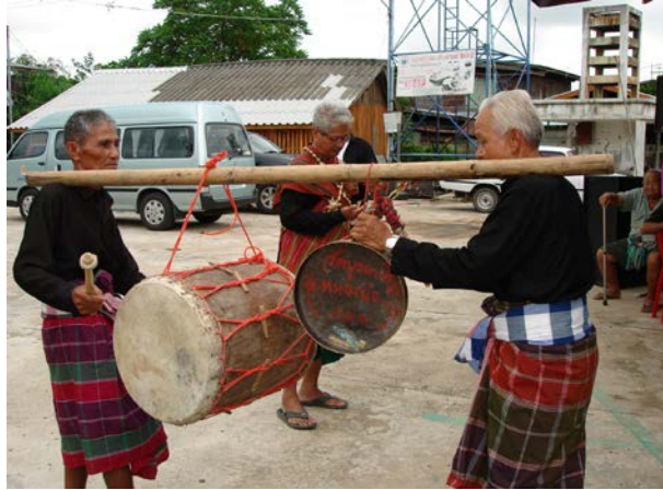
การตีกลองตุ้มและฟังฮาด