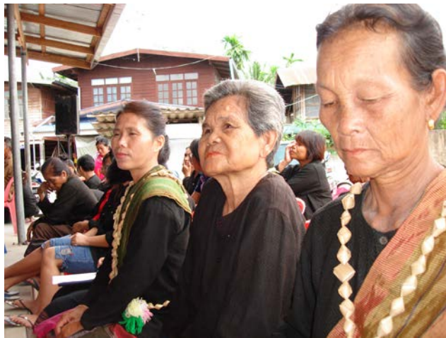
โปรดสังเกตชาวบ้าน เหลือกลุ่มเดียว คือ วัยชรา