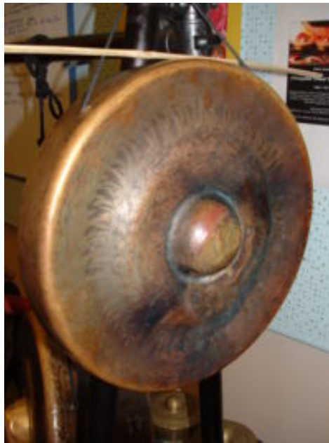
ภาพที่ 10 ฆ้อง

- ฆ้อง เป็นเครื่องดนตรีที่ให้เสียงทุ้ม คอยควบคุมจังหวะช่วยกลอง เสียงของฆ้องจะให้ความรู้สึกนุ่มลึก มีความศักดิ์สิทธิ์ ชาวบ้านเชื่อว่าเป็นเสียงที่เกี่ยวข้องกับการอัญเชิญให้ผีเข้ามีทรงผู้ร่วมพิธีกรรมการบรรเลงจะตีตามจังหวะ ซ้ำหรือเร็ว ฆ้อง ถือว่าเป็นเครื่องดนตรีประเภทพอร์คชันทำด้วยโลหะที่มีหลายรูปแบบ ฆ้องเข้าไปมีส่วนร่วมในดนตรีประกอบพิธีกรรมเรอम्मะมวดในฐานะเครื่องดนตรีศักดิ์สิทธิ์ ฉะนั้นฆ้องจึงใช้บรรเลงในเพลงไหว้ครูและอัญเชิญครูเป็นหลัก