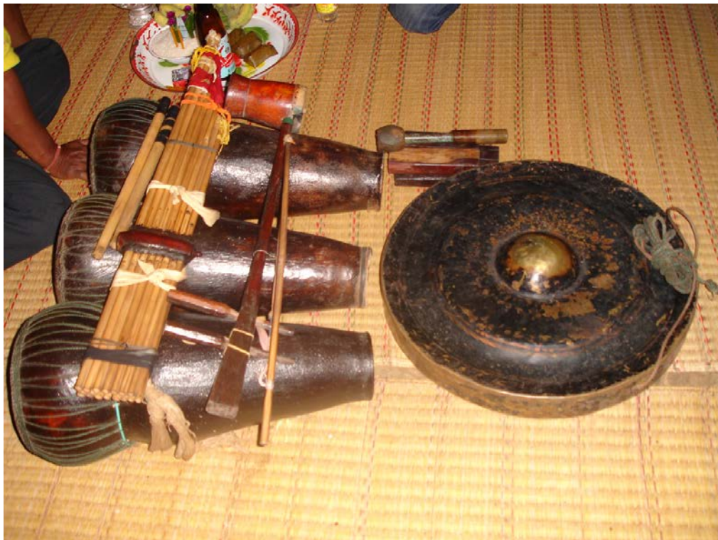
ภาพที่ 7 เครื่องดนตรีที่ใช้บรรเลงในพิธีเรือมมะมั่ววจ

เป็นเรื่องที่เกี่ยวกับเครื่องดนตรีที่ใช้บรรเลงในพิธีเรือมมะมั่ววจ เครื่องดนตรีที่ใช้บรรเลงในพิธีเรือมมะมั่ววจเป็นเครื่องดนตรีที่มี 3 ประเภท คือ สี ตี และเป่า ไม่มีเครื่องดนตรีประเภท ดีด