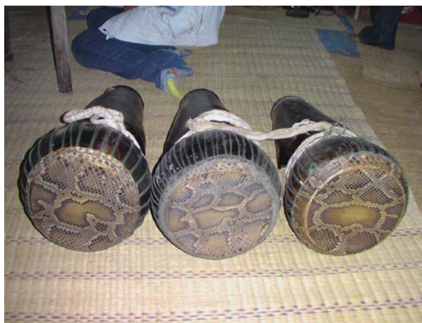
ภาพที่ 9 กลอง หรือ สะกวด ในดนตรีพิธีเรือมมะม่วง

- กลอง ภาษาท้องถิ่นเรียกว่า “สะกวด” มีลักษณะคล้ายกลองโทน ทำจากไม้ หรือทำจากดินเผา ในจังหวัดศรีสะเกษมีที่ทำกลองประเภทนี้ที่อำเภอขุขันธ์ (ทำจากดินเผา) หุ้มหน้ากลองด้วยหนังงูเหลือม หรือหนังตะกวด (ภาษาท้องถิ่นเรียกแล่น) กลองที่ใช้ประกอบการรำแม่คนมีหน้าที่ในการควบคุมจังหวะของดนตรีให้มีความคงที่ และสร้างความครึกครื้นในการบรรเลงให้มีความสนุกสนาน จังหวะที่ใช้ตีมี 3 จังหวะคือ จังหวะไหว้ครู จังหวะอัญเชิญครู และจังหวะระบำ