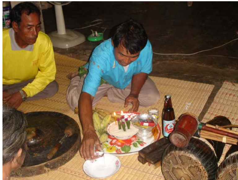
ภาพที่ 17 การทำพิธีปรมปริ