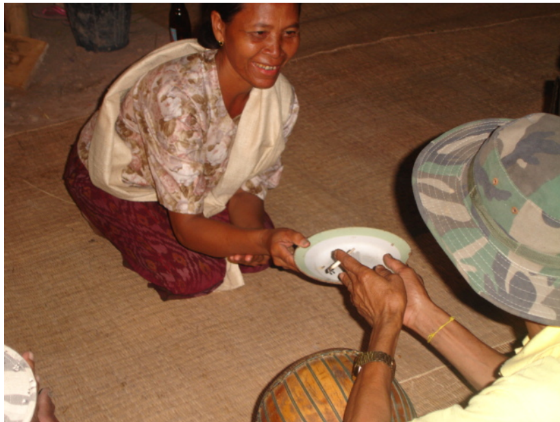
ภาพที่ 14 การยกขัน 5 และขัน 8 ต่อครูดนตรี

ก่อนจะเริ่มพิธีเรือมมะมีวดผู้ที่เป็นแม่ผด (มะมีวด) แต่ละคนจะมีการเตรียมตัวไว้ว่าในช่วงปี นั้นคนจะต้องทำพิธีบวงสรวงให้แม่ผด หรือ มะมีวดที่ตัวเองนับถือหรือไม่ หากต้องทำจะต้องมีการ เตรียมหลักสำคัญเลขครูไปติดต่อวงดนตรีเรือมมะมีวดไว้ล่วงหน้า หากวงดนตรีเรือมมะมีวดวงไหน มีฝีมือดี มีทักษะทางสังคมเป็นเลิศ และเข้าใจในขั้นตอนทางพิธีกรรมเป็นอย่างดี อาจจะมีการจอบ กิวกันข้ามปี การไปติดต่อวงดนตรีแสดงให้เห็นว่าวงดนตรีเรือมมะมีวดเป็นหัวใจสำคัญอย่างหนึ่งของ พิธีกรรมที่จะขาดไม่ได้ การติดต่อวงดนตรีเรือมมะมีวดจะต้องเตรียมขัน 5 และ ขัน 8 เพื่อเป็นการ บูชาต่อครูดนตรีของวงดนตรีที่ไปติดต่อและเพื่อความเป็นสิริมงคล