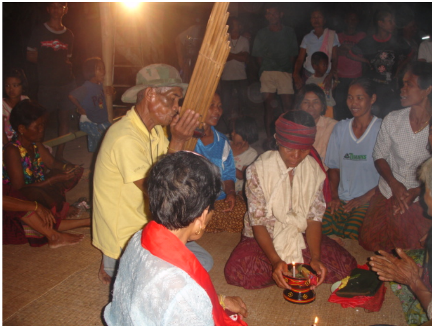
ภาพที่ 21 การใช้แคนเป่าอัญเชิญครูในพิธีเรีอัมมะมั่วด

เสี่ยงดนตรีที่อัญเชิญครูจะมีช่วงทำนองที่ช้าและโหยหวน เพราะครูในพิธีเรีอัมมะมั่วดถือว่าเป็นดวงวิญญาณของบรรพบุรุษหรือเทพที่แต่ละคนนับถือ ซึ่งจะมีความแตกต่างกัน แต่ละคนจะมีครูหรือเทพเฉพาะของตน และมีการใช้ชื่อแตกต่างกัน การอัญเชิญครูให้เข้าร่วมพิธีจะต้องมีความพิถีพิถัน เพราะแก่นแท้ที่สุดแล้วก็คือครูที่มาเข้าร่วมพิธี ดนตรีที่ใช้บรรเลงจะต้องมีความสมบูรณ์ทั้งเรื่องของท่วงทำนอง จังหวะ และสำเนียงเพลง จึงจะทำให้ครูที่จะเข้าร่วมพิธีนั้นพอใจและเข้าร่วมพิธี