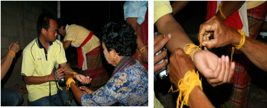
ภาพที่ 23 สายใยสัมพันธ์ที่เห็นได้จากการใช้ฝ้ายผูกแขน

คนในชุมชนที่มีการเอื้อเฟื้อเผื่อแผ่ต่อกัน มีความเชื่อและศรัทธาต่ออำนาจเหนือธรรมชาติร่วมกัน หรือเรียกว่าเป็นสายใยเดียวกัน