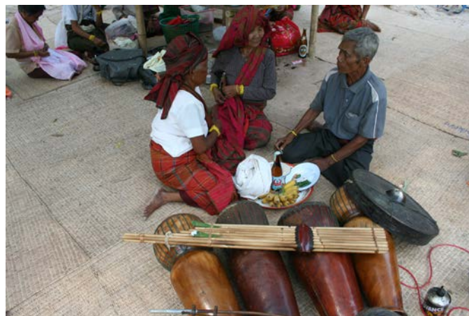
ภาพที่ 16 การไหว้ครูดนตรีก่อนทำพิธีเรือมมะมั่วด

การไหว้ครูตอนเที่ยงคืน หรือเรียกเป็นภาษาเขมรว่า พิธีปรมปรี ถือเป็น การไหว้อีกครั้งหนึ่งเพื่อกรวดน้ำให้กับสิ่งศักดิ์สิทธิ์เพื่อทำการเสียดายคายไถ่ เพื่อทำนายว่าสุขภาพของผู้ที่เป็นเจ้าภาพจะดีหรือไม่ดีอย่างไร และยังเป็น การพักผ่อนกินข้าวร่วมกัน การไหว้ครูตอนเที่ยงคืนนี้จะมี ความพิธีพิถัน และเป็นระบบ ครูนักดนตรีทุกคนจะได้รับการไหว้ขอมาโทษจากผู้เข้าร่วมพิธีทุกคน โดยการยกคำหามคำพาลให้ โดยไม่แบ่งแยกระดับอายุ ครูดนตรีทุกคนจะนำเอาเครื่องดนตรีของตัวเองมารวมกันตรงกลางปราสาท พิธี แม้ครูจะจัดเครื่องเช่นบูชาครูดนตรีเพื่อไหว้ครูตามความเชื่อของกลุ่มวัฒนธรรมเขมร การไหว้ครูในช่วงเที่ยงคืนนี้ ครูดนตรีจะมีการพูดคุยยกถ้อย ถ้อยถามความเป็นอยู่ระหว่างกัน และยังสามารถพักผ่อนก่อนที่จะดำเนินพิธีเรือมมะมั่วดจนสว่าง