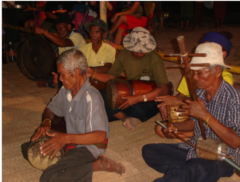
ภาพที่ 19 การบรรเลงดนตรีประกอบพิธีเรือมมะมั่วด

ความสำเร็จของพิธีเรือมมะมั่วด มีดนตรีเป็นส่วนประกอบที่สำคัญที่จะทำให้บรรลุตามวัตถุประสงค์ของผู้เข้าร่วมพิธี รวมทั้งแบบแผนทางวัฒนธรรมที่มีแนวทางการปฏิบัติยึดถือร่วมกัน เช่น การจัดสถานที่ เครื่องเช่นบูชา ความเชื่อเรื่องทิศทางและกาลเวลา (ฤกษ์ยามยามดี) และที่สำคัญการใช้ระบบความสัมพันธ์ของชุมชนเข้ามามีส่วนร่วม หรือ ที่เรียกว่า “วัฒนธรรมบำบัด” ปฏิบัติการความสัมพันธ์ของผู้ที่เข้าร่วมพิธีที่มีต่อกันถือว่าเป็นปัจจัยสำคัญที่จะสร้างบรรยากาศให้ผู้เข้าร่วมพิธีทุกคนมีความสุขทางใจและทางกาย บุคลิกภาพ มนุษยสัมพันธ์ และความสามารถของนักดนตรี ที่จะสร้างบรรยากาศให้สนุกกรีกกรื้นล้วนแต่เป็นองค์ประกอบที่จะทำให้พิธีเรือมมะมั่วดมีผลตามวัตถุประสงค์ของการจัดพิธีขึ้นมา