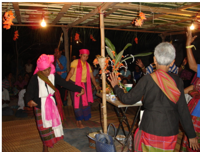
ภาพที่ 3 บรรยากาศการทำพิธีเรือมมะมัด