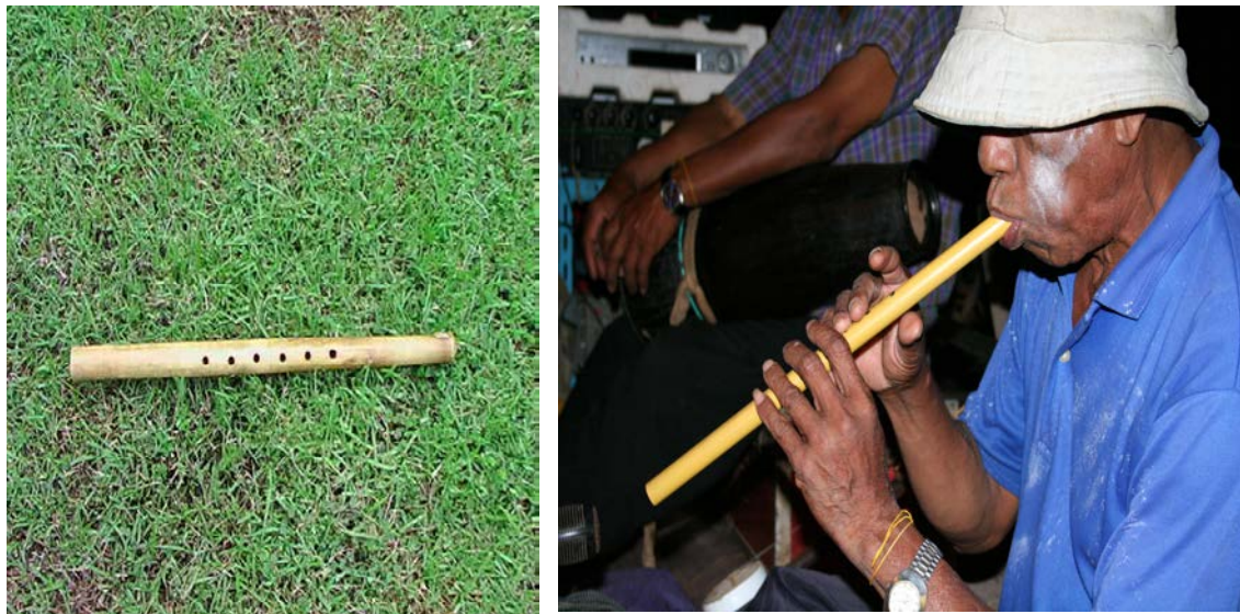
ภาพที่ 12 ปี่แม่มด

- ปี่ หรือ เปีย เป็นเครื่องดนตรีที่ใช้เป่าตอนไหว้ครูในเพลงเพลารวม หรือ เพลงทางใหญ่ หมายถึงการเปิดถนนหรือเปิดทางให้ผี เดินทางมาเข้าทรงเพื่อร่วมทำพิธีรำแม่มดด้วยกัน ตัวปี่ทำด้วยไม้ไผ่ หรือ ไม้ซาง ลื่นทำด้วยโลหะ คล้ายลื่นแคน มีไม้้อเหลาให้บางแล้วนำมาประกบกัน รู้นับปี่ด้านบนมี 6 รู เป็นรูระดับเสียง ด้านล่าง 1 เป็นรูระบายลม ไม้ที่นำมาทำตัวปี่เป็นไม้ซางขนาดเส้นผ่าศูนย์กลางประมาณ 3 เซนติเมตร ยาวประมาณ 25 เซนติเมตร เวลาเป่าจะมีเสียงเศร้าโหยหวน สร้างความรู้สึกวังเวงได้เป็นอย่างดี การเป่าปี่ต้องใช้เทคนิคการเป่าแบบระบายลมตลอดเวลา นอกจากเพลงเพลารวมแล้วยังใช้เป่าในเพลงมะลูปโดง (รุ่มมะพร้าว) ด้วย ลักษณะทำนองคล้ายคลึงกันกับเพลงเพลารวม ถือว่าเป็นเพลงไหว้ทั้งสองเพลง เทคนิคการเป่าปี่ที่สำคัญคือการระบายลม