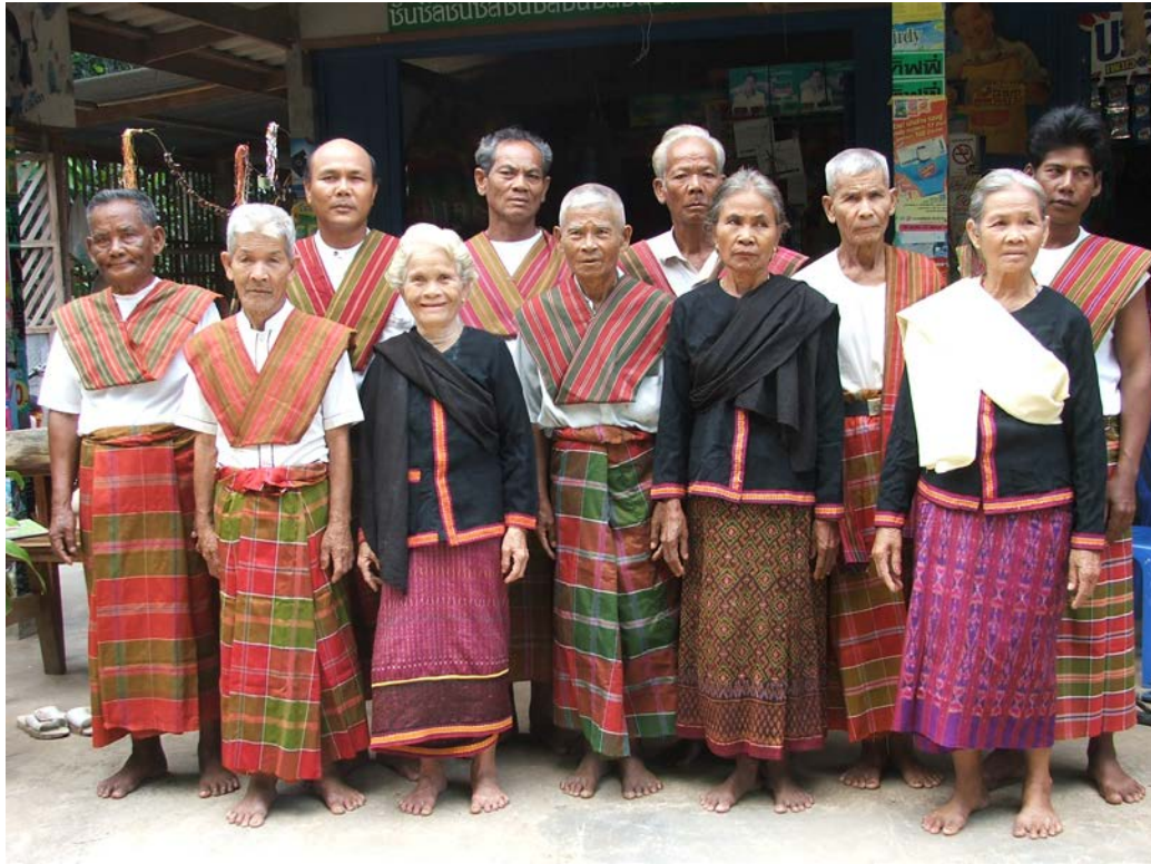
ภาพที่ 2 กลุ่มชาติพันธุ์เขมรในจังหวัดศรีสะเกษ

จะเป็นการร้องประกอบเสียงซอ จเรียงจรวง เป็นการร้อง ประกอบเสียงปี่ นอกจากนั้นยังมี กัณฑ์ริม เป็นการละเล่นประกอบดนตรี รำตรุษ เล่นในเทศกาลสงกรานต์ (แฉแฉด) รำสาก เป็น การรำประกอบ เสียงดนตรี และเสียงกระทบสาก ผู้รำประกอบด้วยชายหญิงรำเป็นคู่ ๆ รอบวงกระทบสาก (ประกอบ 2538, น.29-30)