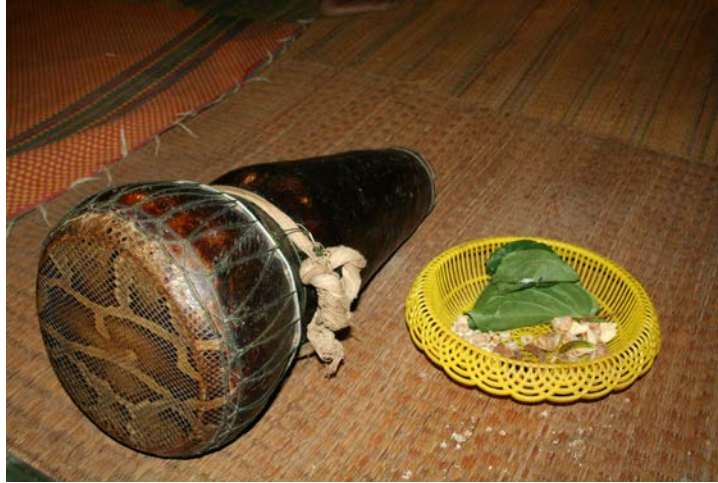
ภาพที่ 15 การไหว้ครูก่อนทำพิธีสวดรักษาโรค

ถือว่าเป็นส่วนหนึ่งที่จะเติมเต็มให้พิธีเรือมมะมั่วดของเจ้าภาพแต่ละคนสามารถบรรลุวัตถุประสงค์ตามต้องการได้ การไหว้ครูก่อนเริ่มทำพิธีจึงเป็นการเตรียมความพร้อมอย่างหนึ่ง และเป็นการลดความตึงเครียดของบรรยากาศให้สบาย ทั้งนักดนตรีและผู้เข้าร่วมพิธี