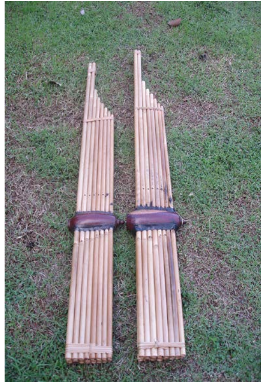
ภาพที่ 13 แคน