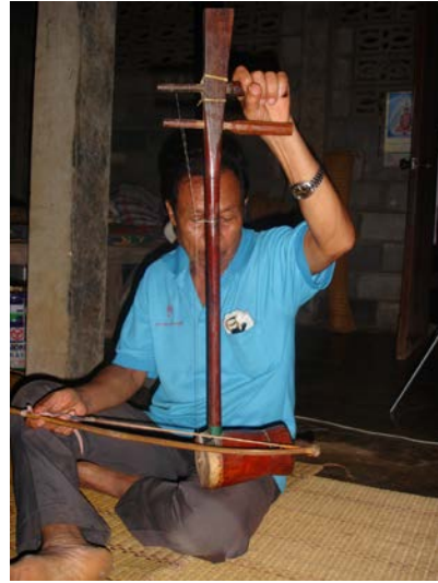
ภาพที่ 8 เครื่องดนตรีประเภท ซอ ในวงดนตรีเรือมมะม่วง

2) เครื่องดนตรีประเภท ตี เป็นเครื่องดนตรีที่เกิดเสียงได้ด้วยการตีด้วยมือหรืออย่างอื่น เครื่องดนตรีประเภทตีที่ใช้ประกอบการบรรเลงในพิธีเรือมมะม่วงมาหลายอย่าง ดังรายละเอียดต่อไปนี้