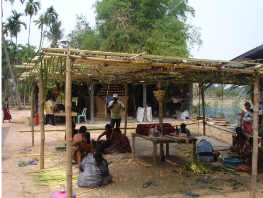
ภาพที่ 4 การจัดสถานที่ทำพิธีเรือมมะมัด

ในอดีต พิธีเรือมมัดถือว่าจะต้องพิธีพิถันกันเป็นอย่างมาก ไม่ว่าจะช่วงระยะเวลาที่ทำพิธีเครื่องเช่นไหว่ สถานที่จัดทำ พฤติกรรมของผู้เข้าร่วมพิธี ทุกอย่างจะต้องมีความระเอียดรอบคอบ แต่ในปัจจุบันมีหลายอย่างที่ต้องปรับเปลี่ยนไปตามสังคมและเศรษฐกิจ โดยเฉพาะในเรื่องของค่าใช้จ่ายที่เพิ่มขึ้น การจัดงานครั้งหนึ่งจะต้องมีค่าใช้จ่ายไม่ต่ำกว่า 10,000 บาท โดยเฉพาะปัจจัยที่เกี่ยวกับเครื่องดื่มน้ำที่มีแอลกอฮอล์ และการจ้างวงดนตรีมาบรรเลงประกอบ คืนหนึ่งประมาณ 2,900 – 3,500 บาท การทำพิธีเรือมมัดจะต้องทำตั้งแต่พลบค่ำจนถึงเช้าของอีกวัน บางที่แม่ผัดไม่ยอมออกก็อาจจะต่อถึงเที่ยงของอีกวันก็ได้ พิธีเรือมมัดจึงสะท้อนให้เห็นว่า การเข้ามาร่วมพิธีกรรมดังกล่าวไม่ได้มีความสุขสนุกสนานหรือไม่จำเป็นจริงชาวบ้านก็คงไม่ทำ แต่ด้วยความศรัทธาแห่งผลที่เขาได้รับจากความเชื่อความศรัทธานั้น พิธีกรรมแม่ผัดจึงเป็นอีกหนทางเลือกหนึ่งที่ชาวบ้านยึดถือปฏิบัติและสืบทอดต่อกันมาจนถึงปัจจุบัน