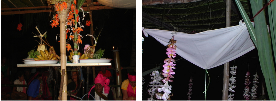
ภาพที่ 5 การเตรียมเครื่องเซ่นไหว้และ การนำผ้าขาวมาทำจอมขวัญ

ปราณีจะต้องมีการวางแผนปฏิบัติที่สำคัญคือ ห้ามหันหน้าไปทางทิศตะวันตก เนื่องจากมีความเชื่อว่าเป็นทิศที่ไม่เป็นมงคล ทิศที่หันหน้าสู่ปราณีจะต้องทำไม้คานกันไว้เพื่อป้องกันภูตผีปีศาจที่ไม่เกี่ยวข้องหรือผีที่ไม่ดีเข้ามาร่วมในพิธีกรรมได้ และห้ามคนข้ามเพราะจะทำให้ผีแม่แม่มดไม่เข้าทรงได้