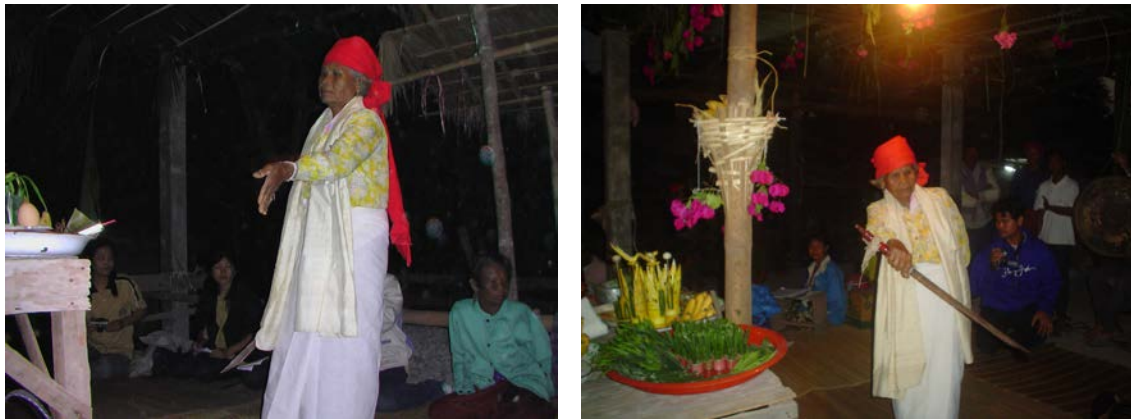
ภาพที่ 6 การรำเพื่อไหว้ครูและขับไล่สิ่งไม่ดี

การไหว้ครูเริ่มจากแม่ครูรินเหล้าใส่แก้วที่ไม่มีน้ำ แล้วยกแก้วไหว้ด้วยคาถา จากนั้นพ่อครูจะรับหมากพลู เงิน 50 บาท แล้วแม่ครู หรือ ครูบา จะอัญเชิญครูบาอาจารย์ของแม่แมดให้เข้าทรงในตัวแม่แมดแต่ละคน นักดนตรีจะบรรเลงเพลง “เพลาชม” ซึ่งถือว่าเป็นเพลงครูเพื่ออัญเชิญให้ครูแมดเข้าทรงในตัวแม่แมดทุกคน การบรรเลงดนตรีประกอบพิธีราแม่แมดจึงถือว่าเป็นสิ่งที่สำคัญอย่างยิ่งที่จะทำให้พิธีราแม่แมดมีความสมบูรณ์และคงความศักดิ์สิทธิ์ไว้ การเข้าทรงของพิธีราแม่แมดจะต้องใช้ขันใส่ข้าวสาร และนำเทียนมาใส่ในขัน โดยให้ตัวแม่แมดนั่งจับขันไว้ และต้องนำผ้าขาวมาห่มไว้ขณะนั่งจับขัน ถ้าหากมีครูแมดมาเข้าทรง จะเกิดอาการสั่นและหมุนขันที่จับไว้วันไปมา เมื่อครูแมดจะเข้าทรงเรียบร้อยแล้วจะโยนขันที่จับไว้ทิ้งออกไป แสดงว่าครูแมดได้เข้าทรงเรียบร้อยแล้ว เมื่อแม่แมดเข้าทรงเรียบร้อยแล้ว ผู้ที่เป็นเจ้าภาพจะลูกเข้าร้ายรำโดยใช้ดาบเป็น อุปกรณ์ เพื่อขับไล่สิ่งไม่ดีออกจากสถานที่ประกอบพิธี