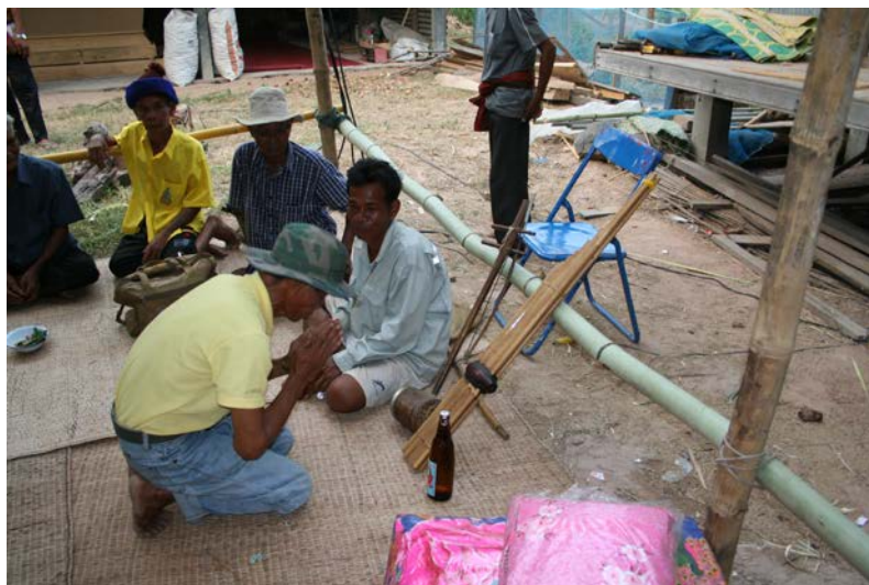
ภาพที่ 20 การแสดงความรพต่อเครื่องดนตรี