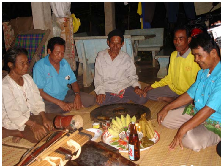
ภาพที่ 18 นักดนตรีทุกคนจะได้รับการขอขมาจากแม่ครู