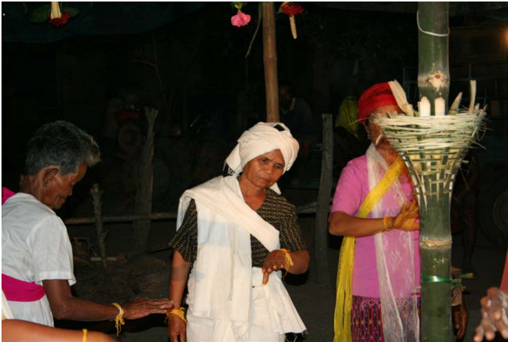
ภาพที่ 22 เมื่อครูหรือสิ่งศักดิ์สิทธิ์เข้าถึงในตัวมะมัวด จะทำให้คนนั้นลุกขึ้นฟ้อนรำ

การอัญเชิญครูนอกจากจะใช้เสียงดนตรีแล้ว ยังมีเชียร์จากผู้เข้าร่วมพิธีทั้งที่เป็นกลุ่มมะมัวดเหมือนกันและญาติพี่น้องที่เข้ามาดูพิธีอยู่ข้างนอก ทั้งเสียงดนตรีและเสียงเชียร์จึงเป็นพลังที่ทำให้ผู้ที่กำลังถูกอัญเชิญครูมีความสุขทางใจที่ได้รับกำลังใจผู้อื่น จนมีความรู้สึกว่าตัวเองมีสิ่งที่มีพลังเหนือธรรมชาติเข้ามาสิงสถิตตัวเองจนมีอาการที่อยากฟ้อนรำ แต่อาการเหล่านี้เป็นอาการที่ยังคงสามารถควบคุมสติตัวเองได้