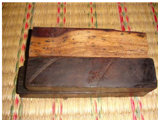
ภาพที่ 11 กรับ

- กรับ เป็นเครื่องดนตรีประเภทให้จังหวะเหมือนกันกับฆ้อง แต่มีบทบาทหน้าที่เพียงแค่เสริมจังหวะให้ครึกครื้นเท่านั้น ไม่เกี่ยวข้องกับระบบความเชื่อโดยตรง