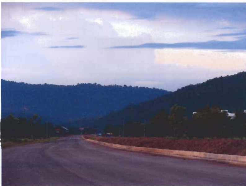
ภาพประกอบที่ ๒ ภูเขาภูพานคำอำเภอเมืองหนองบัวลำภู