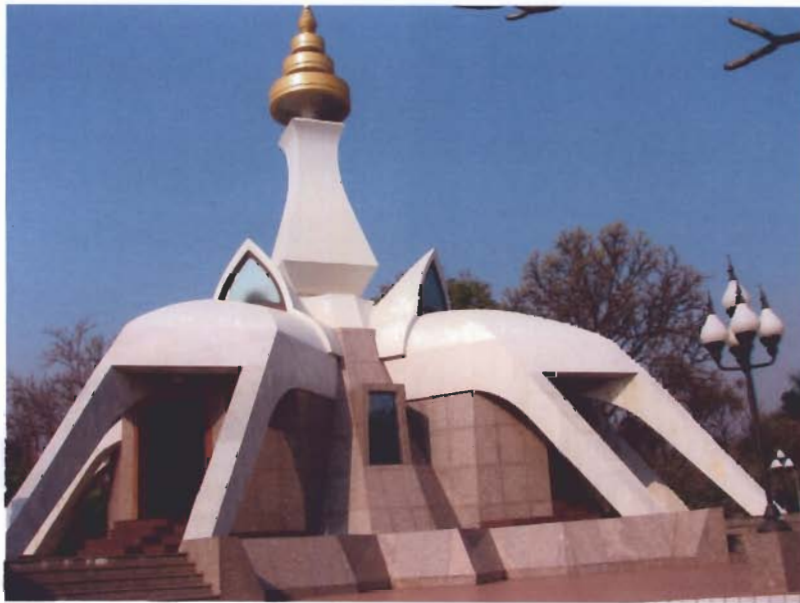
ภาพประกอบที่ ๓ พิพิธภัณฑสถานหลวงปู่ขาว อนาลโย วัดถ้ำกลองเพล

เดือนสิบสอง “บุญกฐิน” ประมาณเดือนพฤศจิกายน เกือบทุกหมู่บ้านในเขตอำเภอเมือง จะมีการทำบุญนี้ขึ้น โดยมีการจัดองค์กฐินไปทอดถวายตามวัดต่าง ๆ ในกรณีส่วนบุคคล ส่วนชาวบ้านก็จะร่วมกันเป็นเจ้าภาพจัดงานบุญกฐินสามัคคีขึ้นทอดที่วัดประจำหมู่บ้านของตนเอง นอกจากนี้ อำเภอเมือง โดยนายอำเภอเมือง หน่วยงานราชการ กำหนดผู้ใหญ่บ้านตลอดจนพ่อค้า ประชาชนทุกหมู่เหล่า ได้จัดกฐินสามัคคีอำเภอเมืองขึ้นทุกปี ซึ่งนำถวายตามวัดที่ตกลงในที่ประชุมโดยสลับให้ครบทั้ง ๑๔ ตำบล และยังมิ่งงานลอยกระทง เพื่อบูชาพระแม่คงคา และเป็นการปล่อยทุกข์โศกโรคภัยต่างๆ ไปกับกระทง ส่วนหนุ่มสาวก็อธิษฐานร่วมกัน เป็นต้น