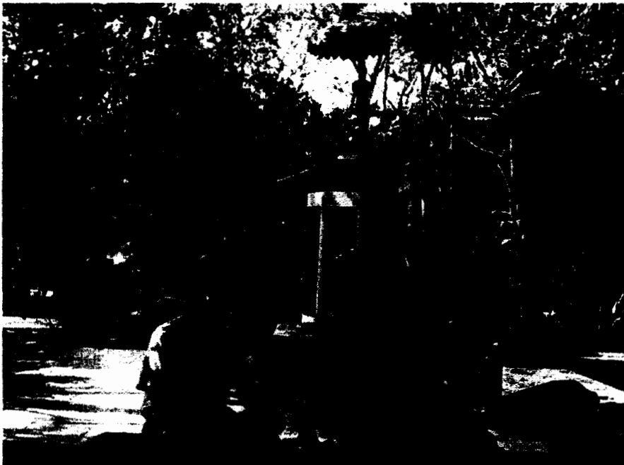
ผู้วิจัยสัมภาษณ์พงษ์ศักดิ์ จันทรูกษา นักแต่งเพลงลูกทุ่งอีสาน วันที่ 20 กุมภาพันธ์ 2548