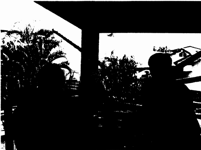
ผู้วิจัยสัมภาษณ์สลา คุณวุฒิ นักแต่งเพลงลูกทุ่งอีสาน วันที่ 8 กุมภาพันธ์ 2548