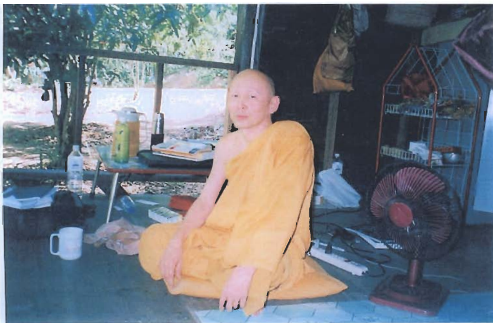
พระไพศาลวิสาโล (2 กรกฎาคม 2547 ณ วัดป่ามหาวัน อ.ภูเขียว จ.ชัยภูมิ)