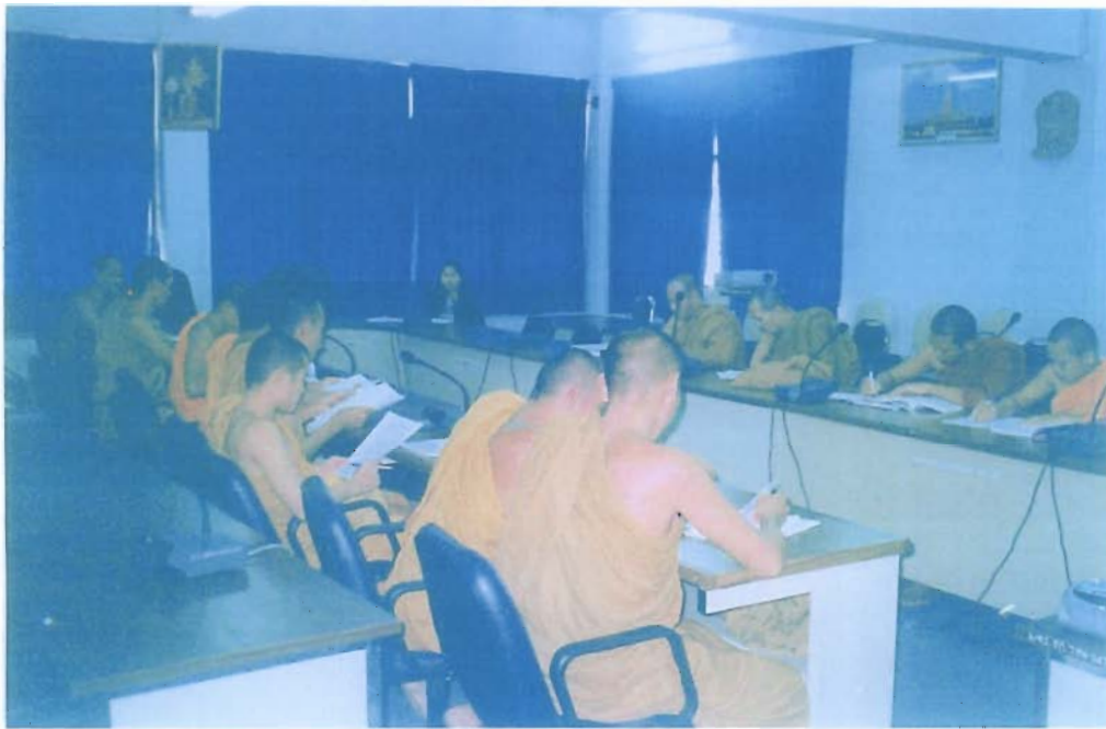
พระนักศึกษา ป.โท สาขาพระพุทธศาสนา (14 กรกฎาคม 2547 ณ มหาจุฬาลงกรณ์ราชวิทยาลัย วัดธาดู จ.ขอนแก่น)