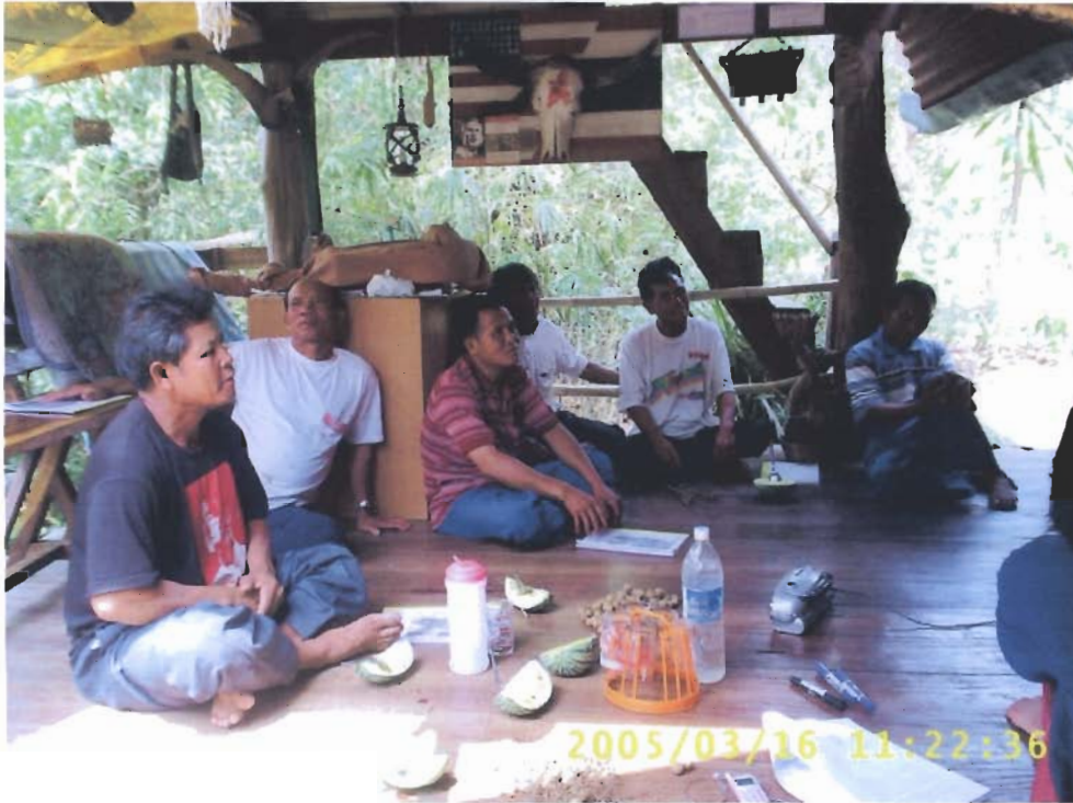
ผู้นำชาวบ้านด้านการพัฒนาชุมชน (16 มีนาคม 2548 ณ บ้านคำผักกูด ตำบลกกตูม อำเภอคง หลวง จังหวัดมุกดาหาร)