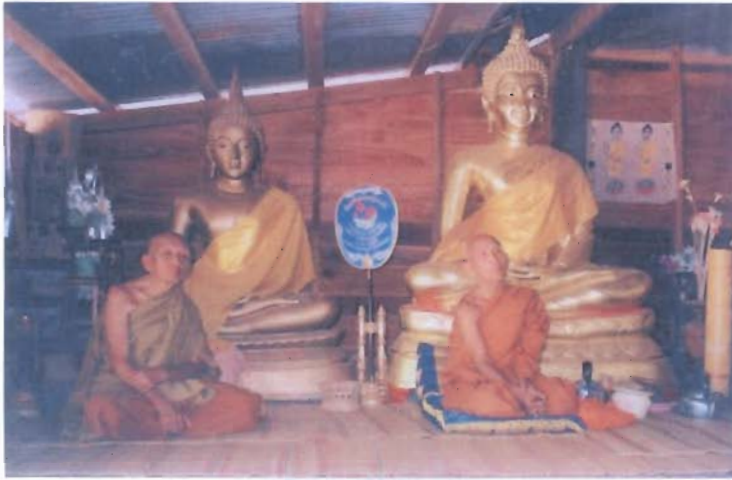
พระ และ ผู้นำชาวบ้านด้านประเพณีวัฒนธรรมท้องถิ่น (8 มกราคม 2548 ณ วัดบ้านโคกโก่ง ต.กุดหว้า อ.กุฉินารายณ์ จ.กาฬสินธุ์)