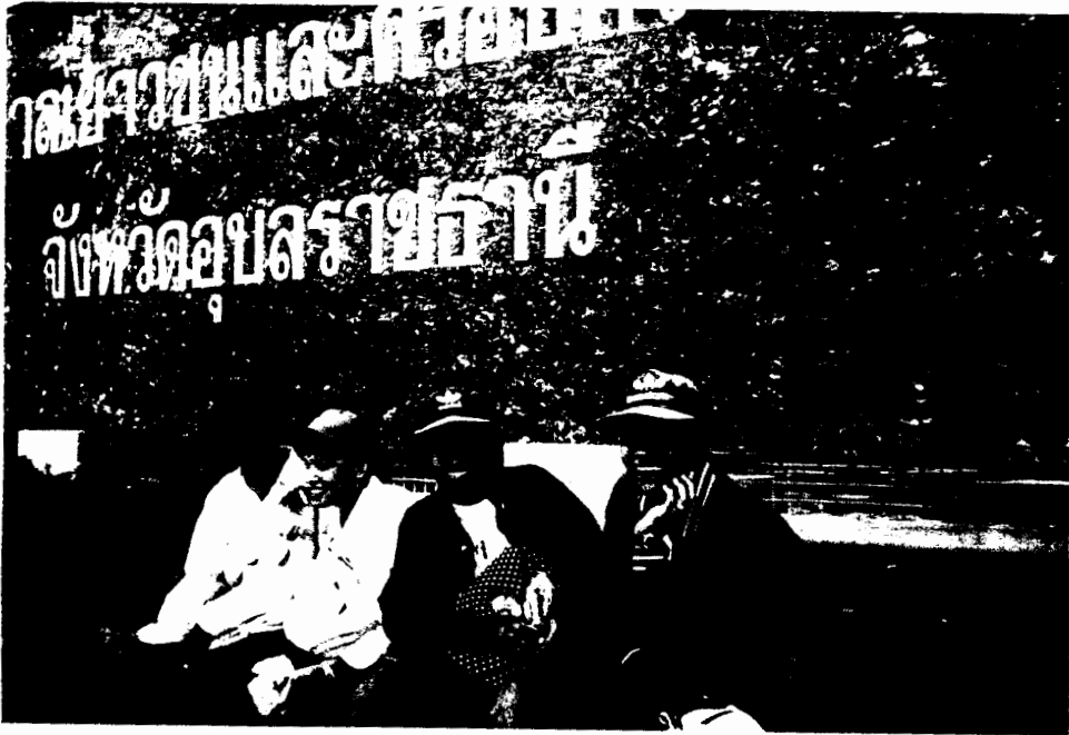
① คณะผู้ช่ายวิจัยที่จังหวัดอุบลราชธานี