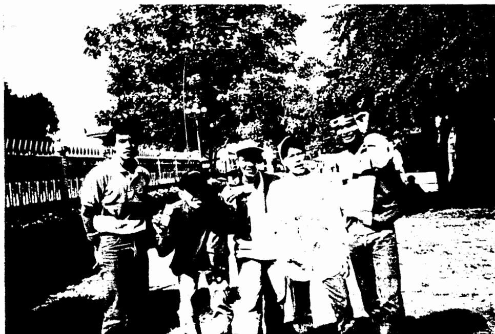
④ ที่ จ. นครราชสีมา บันทึกภาพเตรียมพร้อม ก่อนปฏิบัติหน้าที่