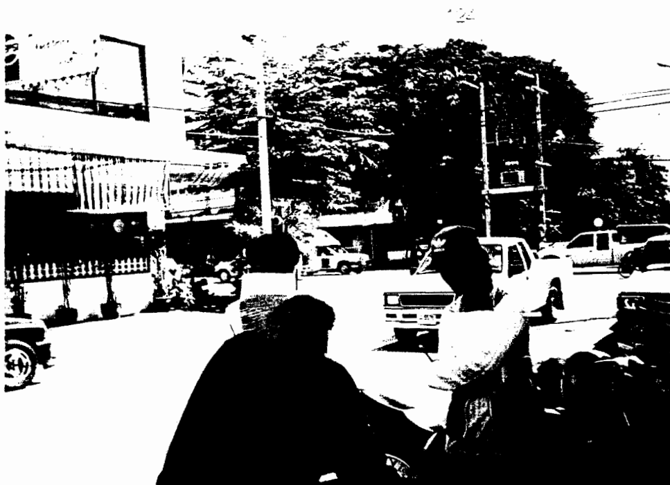
③ เก็บข้อมูลวัยรุ่นที่ย่านชุมชนใจกลาง จ.ขอนแก่น