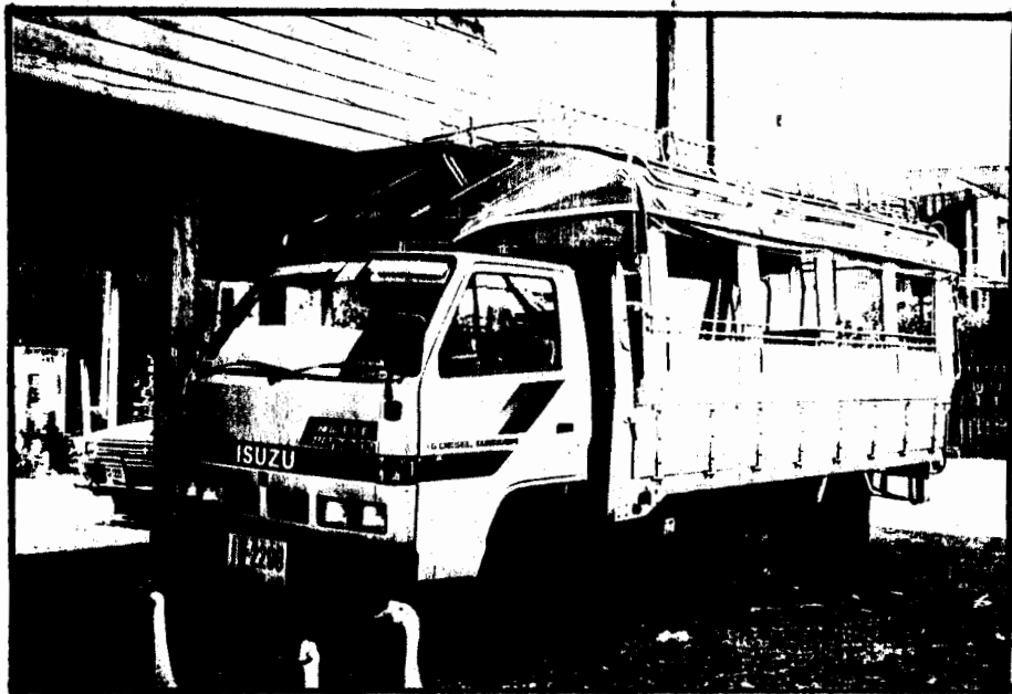
บ้านหลังใหญ่พร้อมรถยนต์ขนาดกลาง หยาดแห่งใจแรงงานจากตะวันออกกลาง ของนายพิทักษ์ สิงห์เสนา