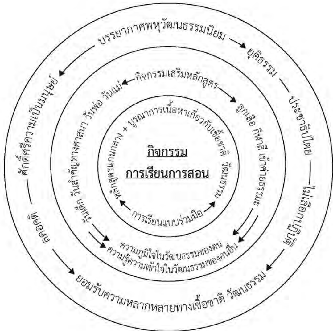
แผนภาพ ๔ รูปแบบการจัดการศึกษาพหุวัฒนธรรมในโรงเรียนประถมศึกษา

ผลจากการนำรูปแบบการจัดการศึกษาพหุวัฒนธรรม ดังแผนภาพ ๔ ไปใช้ในโรงเรียนทดลองเป็นเวลา ๑ ภาคการศึกษา คือ ภาคการศึกษาที่ ๒ ปีการศึกษา ๒๕๕๓ ได้ผลการศึกษา ดังจะนำเสนอตามลำดับต่อไปนี้