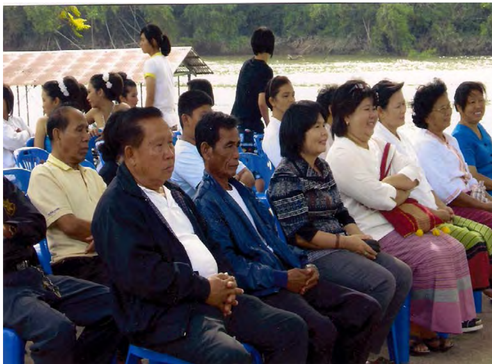
การจัดเวทีประชาคม ในชุมชนตำบลต้นตาล ทุกคนให้การต้อนรับเป็นอย่างดี