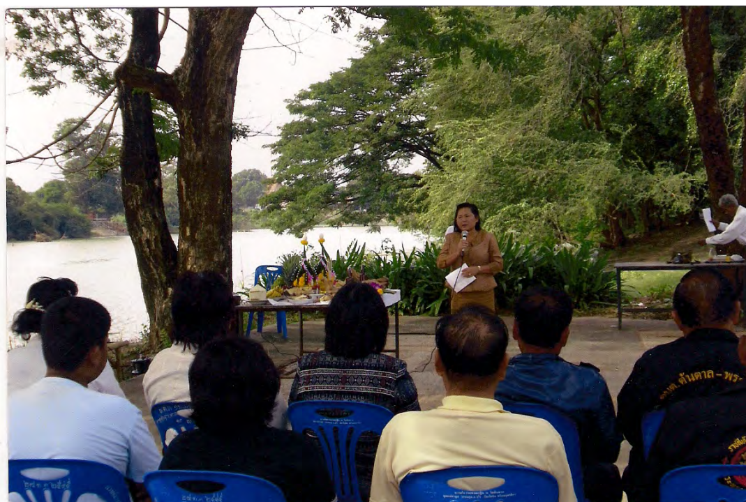
ผู้อำนวยการกลุ่มส่งเสริม ศาสนา ศิลปะและวัฒนธรรม กล่าวสรุปผลการวิจัย ฯ และขอบคุณผู้มีส่วนเกี่ยวข้องทุกท่าน