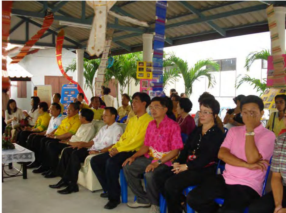
การมีส่วนร่วมของวัฒนธรรมจังหวัดสระบุรี สภาวัฒนธรรมจังหวัด สภาวัฒนธรรมอำเภอ และชุมชนตำบลต้นตาล ร่วมกิจกรรมพิธีเปิด ตลาดทำน้ำโบราณบ้านต้นตาล โดยผู้ว่าราชการจังหวัดสระบุรี เป็นประธานในพิธีเปิด