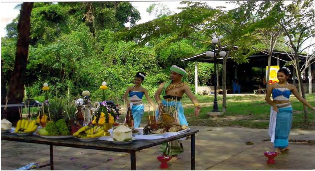
การรำรำบูชา แม่น้ำป่าสัก โดยกลุ่มเยาวชนตำบลต้นตาล ด้วยลีลาและท่าทางอ่อนช้อย งดงามเป็นอย่างนัก