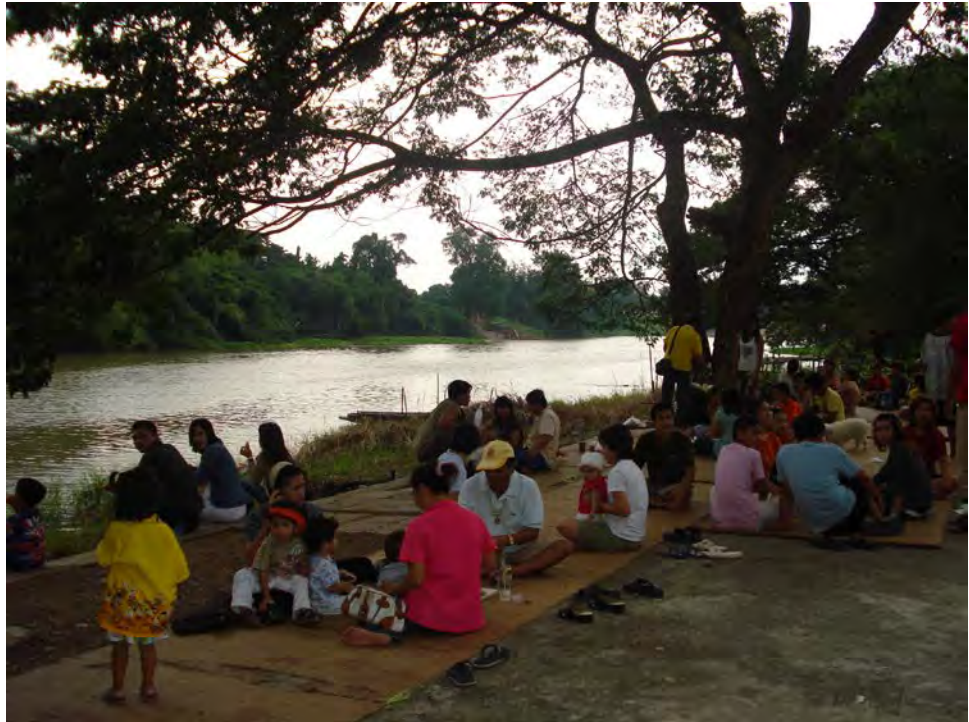
ภาพกิจกรรมการลงพื้นที่ที่ชุมชนตำบลต้นตาล พบปะพูดคุยกับชาวบ้านและกลุ่มผู้นำ สภาวัฒนธรรมตำบลต้นตาล อำเภอเสนาไห้ จังหวัดสระบุรี