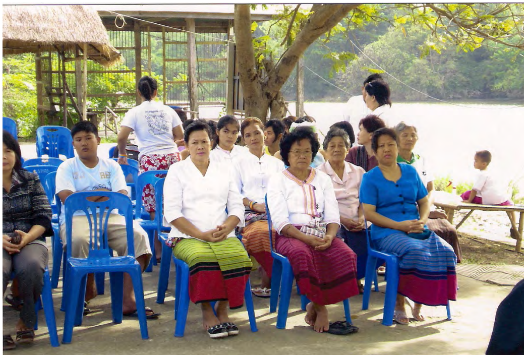
ผู้นำชุมชน และกลุ่มอาชีพ ของตำบลต้นตาล ในพิธีสืบชะตาแม่น้ำป่าสัก ณ บริเวณทำนุบ้านต้นตาล อำเภอเสนาให้