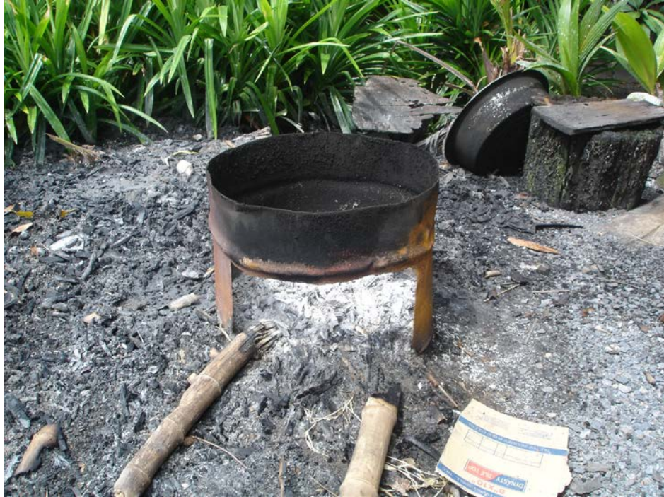
อุปกรณ์ เครื่องมือ การทำขนมจีน (ต่อ)