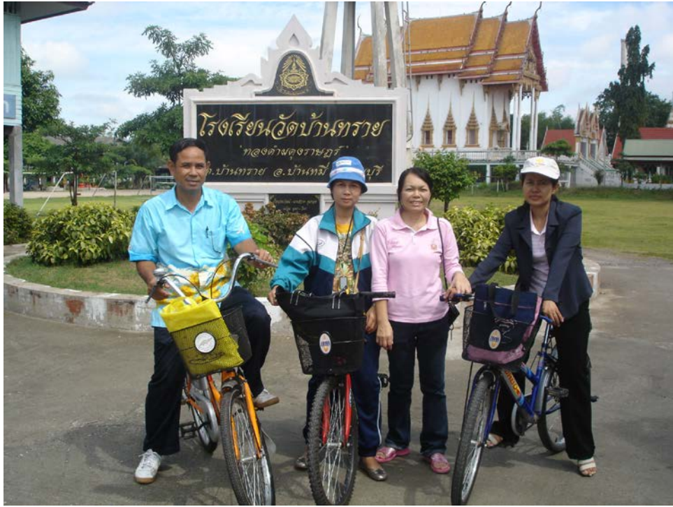
ทีมงานศึกษา ค้นคว้า งานวิจัย