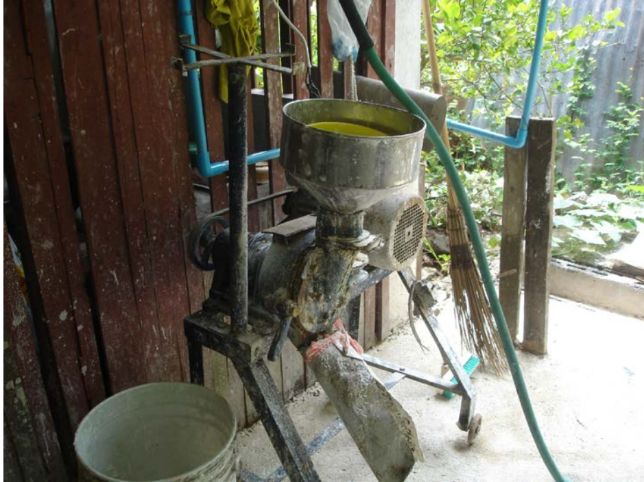
วิถีชีวิตความเป็นอยู่