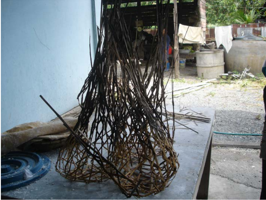
อุปกรณ์ เครื่องมือ การทำขนมจีน (ต่อ)