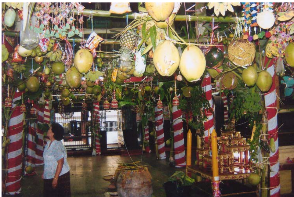
การประดับศาลาด้วยผลไม้