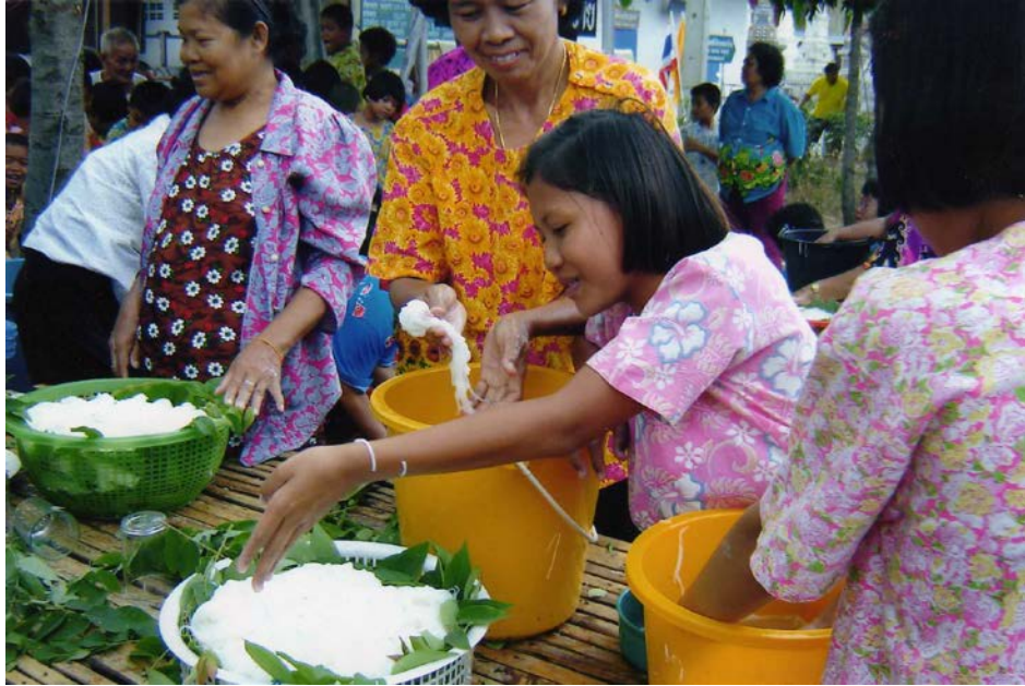
การจับเรียงเส้นขนมจีน