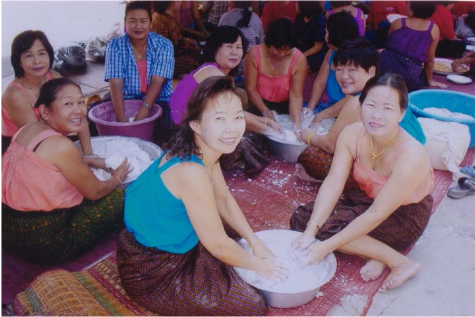
นวดแป้งข้าวปุ้น