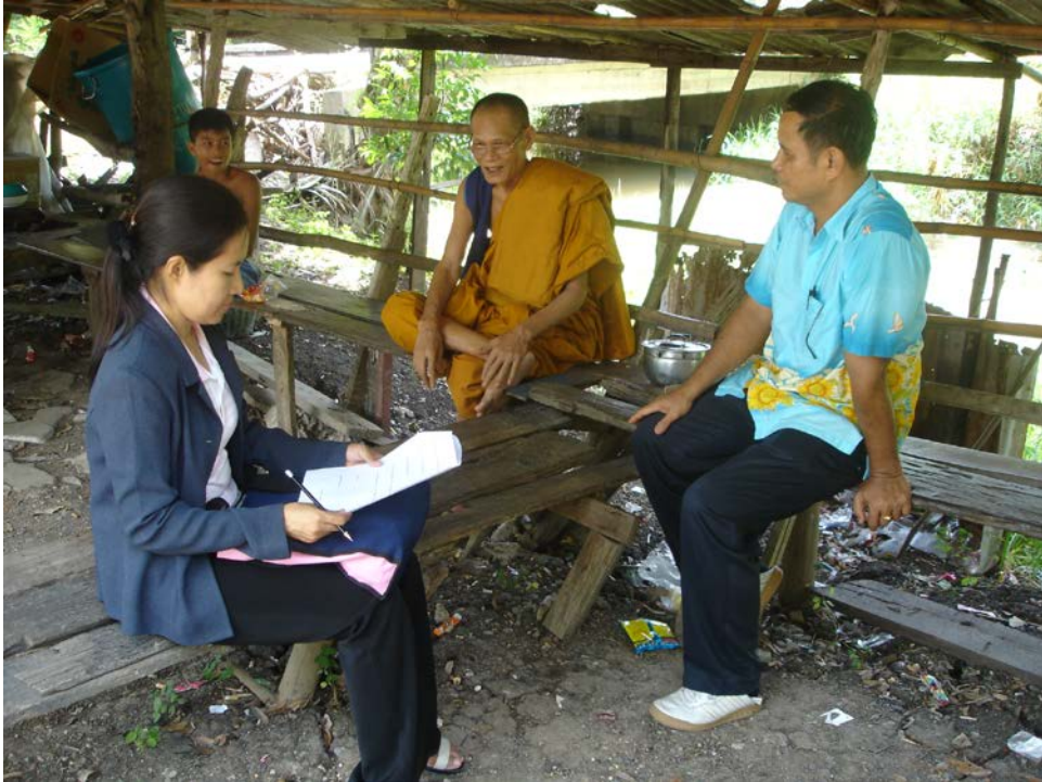
สัมภาษณ์เจ้าอาวาสวัดสุนทรภิคาราม (บ้านมะขามเอน) อุปกรณ์ เครื่องมือ การทำขนมจีน