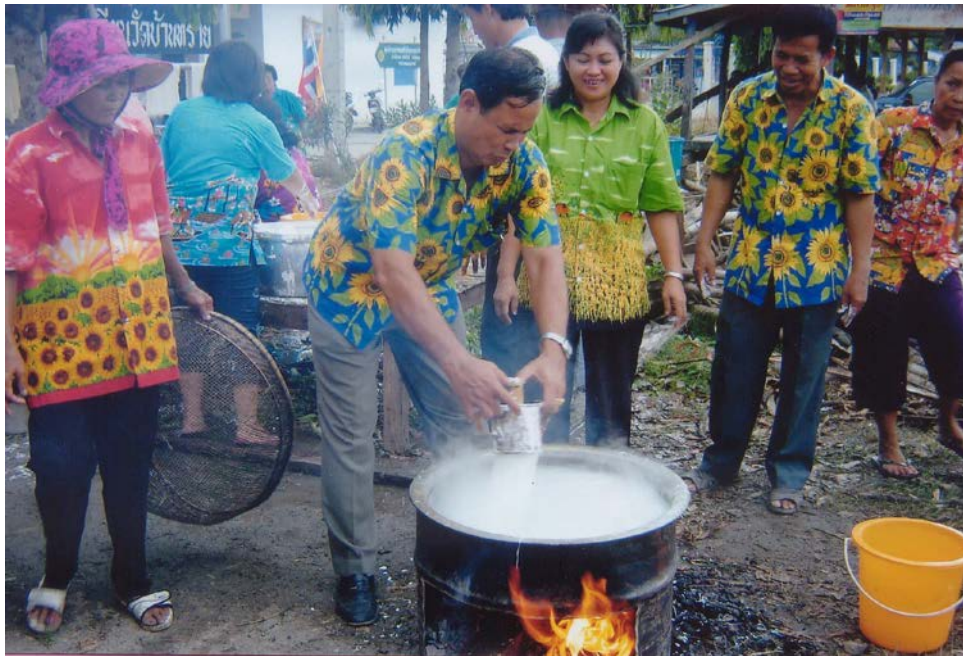
การบีบเส้นขนมจีน