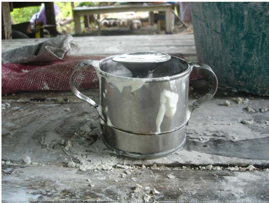
อุปกรณ์ เครื่องมือ การทำนมจืด (ต่อ)