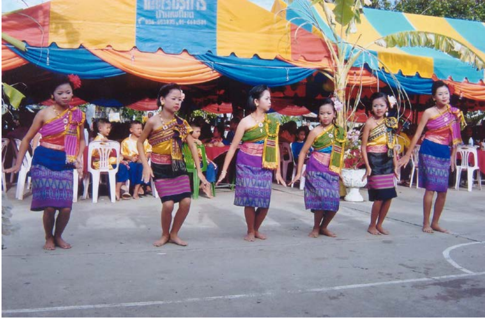
นำนักเรียนร่วมกิจกรรม