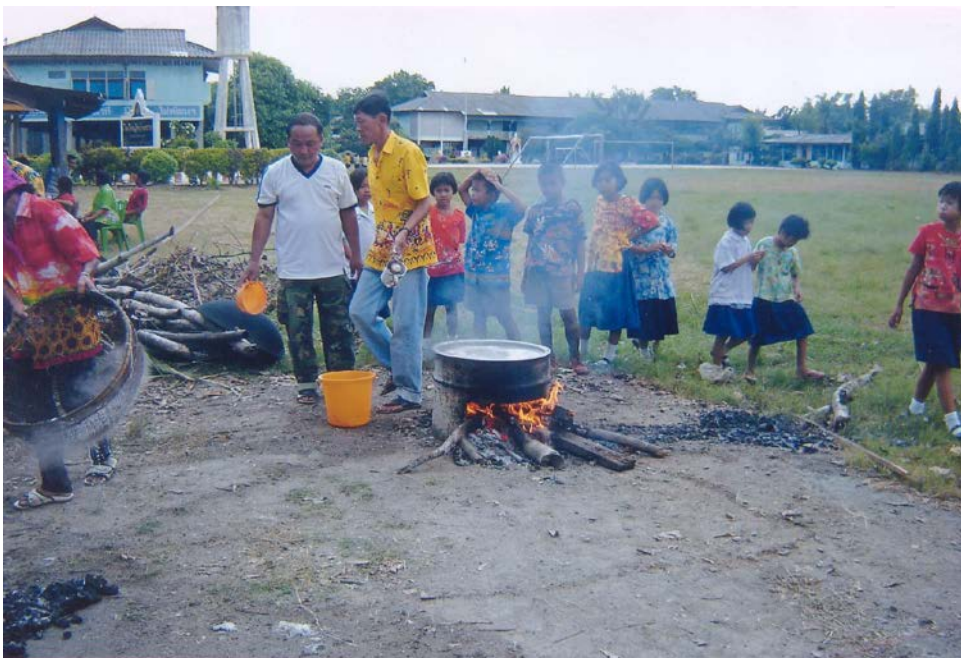
ตั้งน้ำเพื่อเตรียมบิบบเส้นข้าวปุ้น