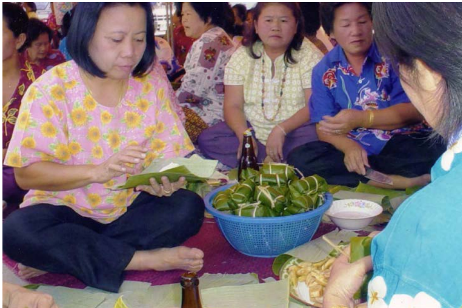
วิธีการห่อข้าวต้มมัด