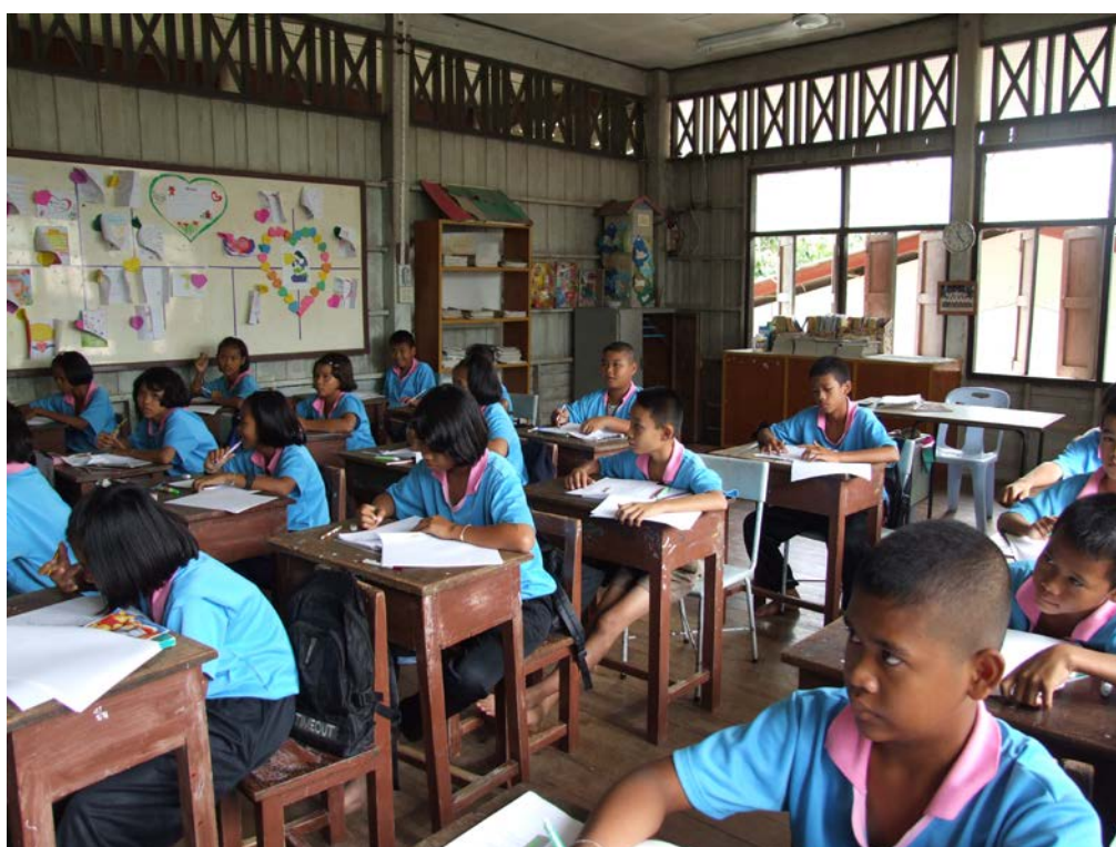
นักเรียนตอบแบบสัมภาษณ์และฟังคำอธิบาย ถึงความสำคัญของประเพณีการทำขวัญข้าว