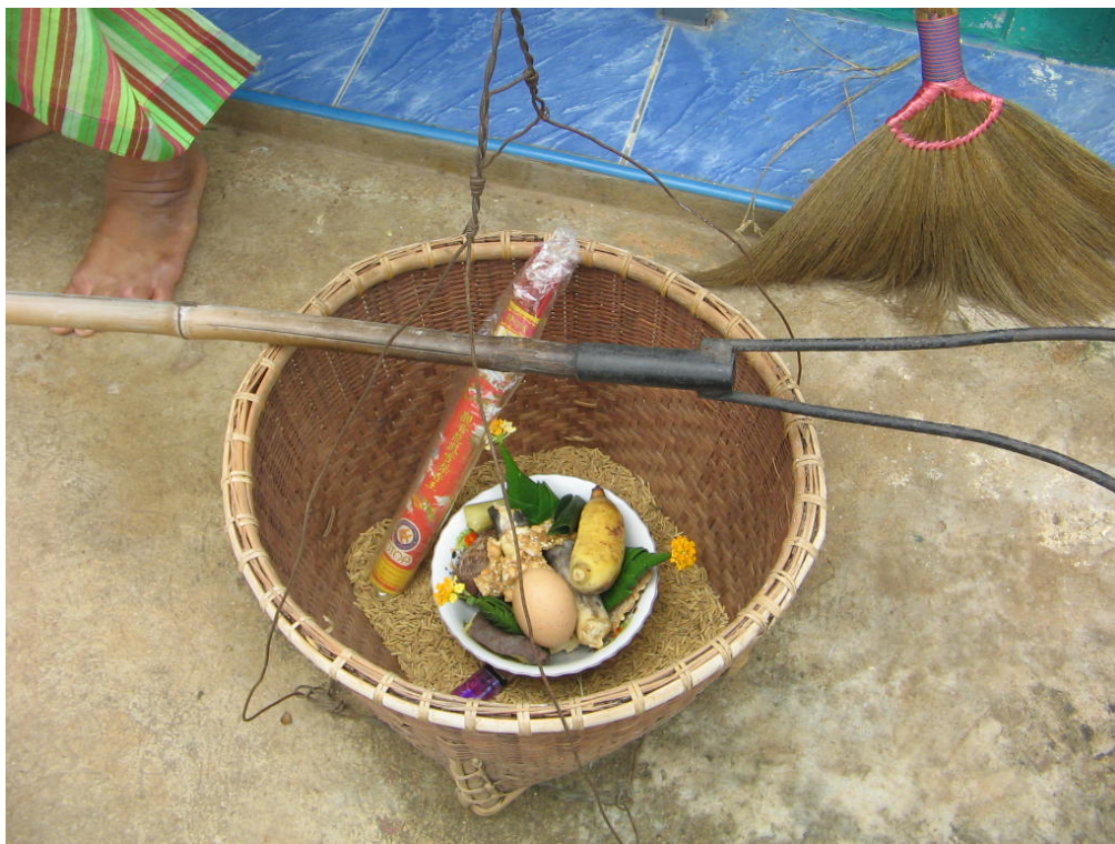
อุปกรณ์ที่ใช้ในการเชิญแม่โพสพจากที่นามาสู่ข่วงข้าว