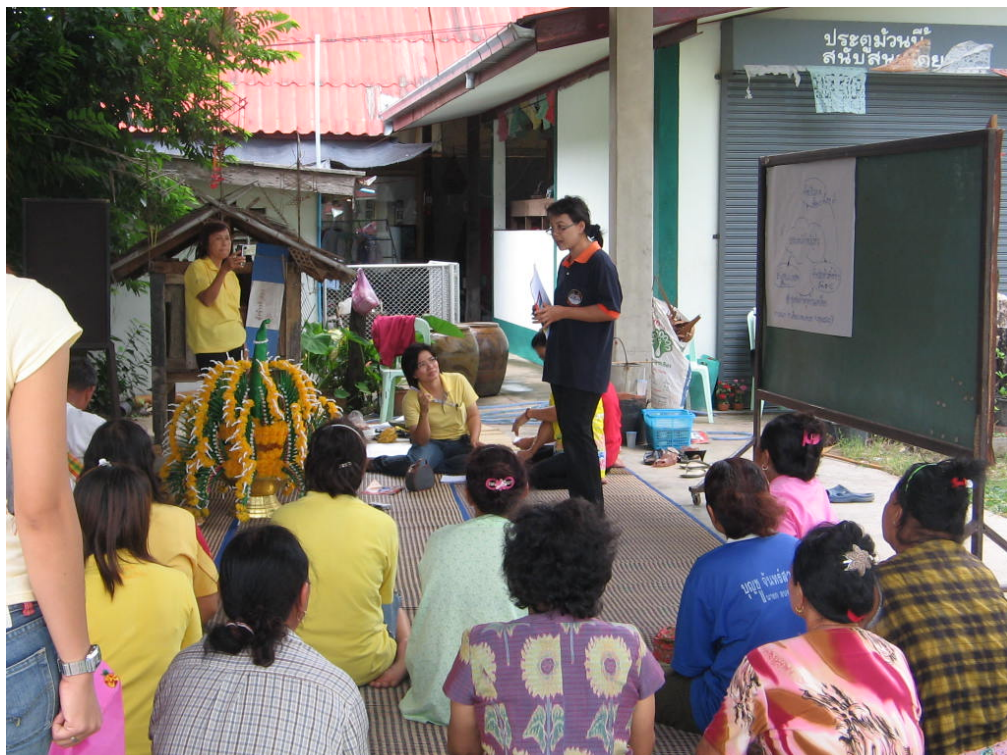
คณะทำงานชี้แจงวัตถุประสงค์การวิจัยและสร้างความเป็นกันเอง