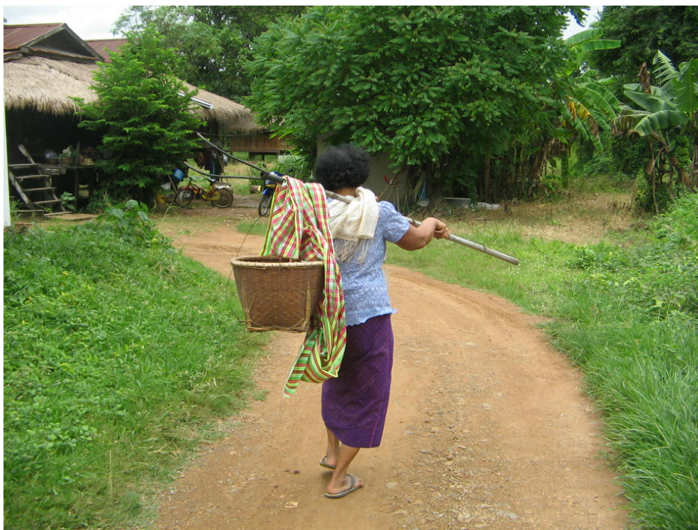
ชานนาเตรียมอุปกรณ์ใส่กระบุงเพื่อไปเชิญแม่โพสพที่นา