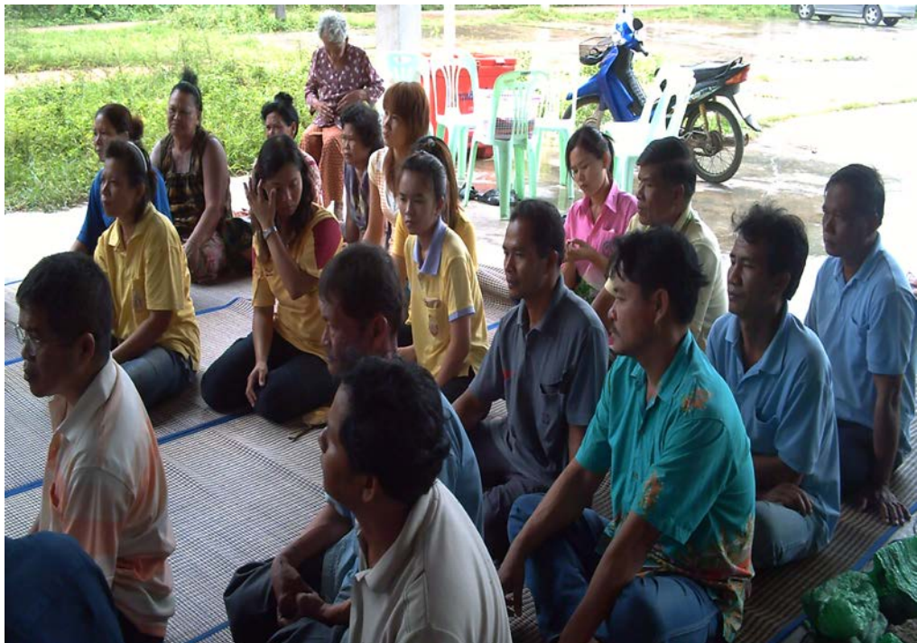
ผู้ร่วมพิธีทำขวัญข้าว