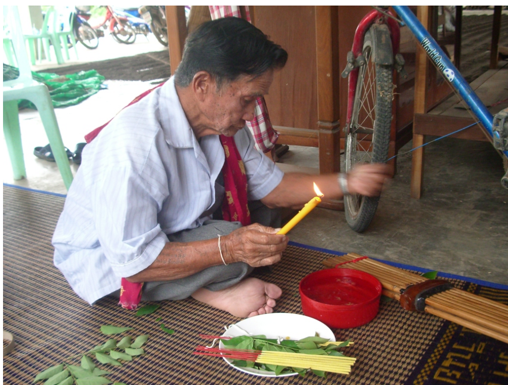
อุปกรณ์ในพิธีทำขวัญข้าว