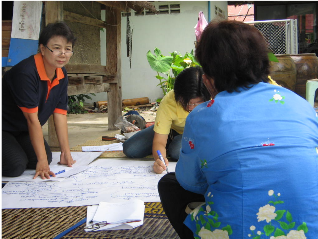
คณะทำงานสัมภาษณ์ชาวบ้านแบบเดี่ยว