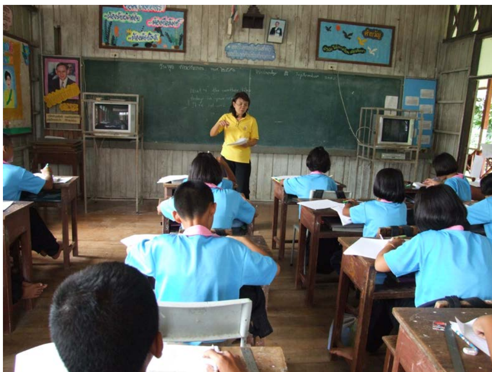
คณะทำงานชี้แจงวัตถุประสงค์และรายละเอียด ประเพณีการทำขวัญข้าวให้แก่นักเรียน