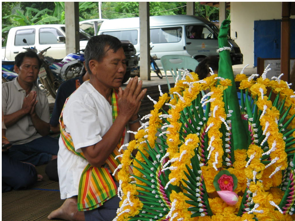
หมอทำวัณกำลังอ่านบทสวดในพิธี