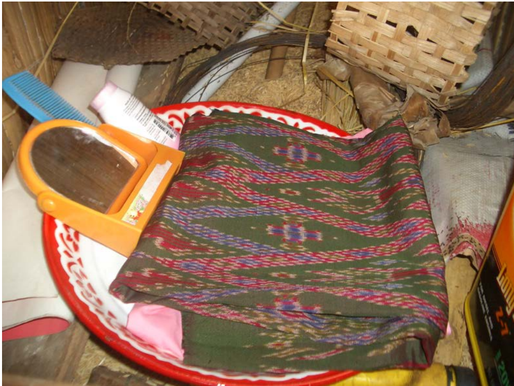
อุปกรณ์ในการทำขวัญข้าวที่ยัง ประกอบด้วยผ้าใหม่ ๑ ชุด กระจก แป้ง หวี