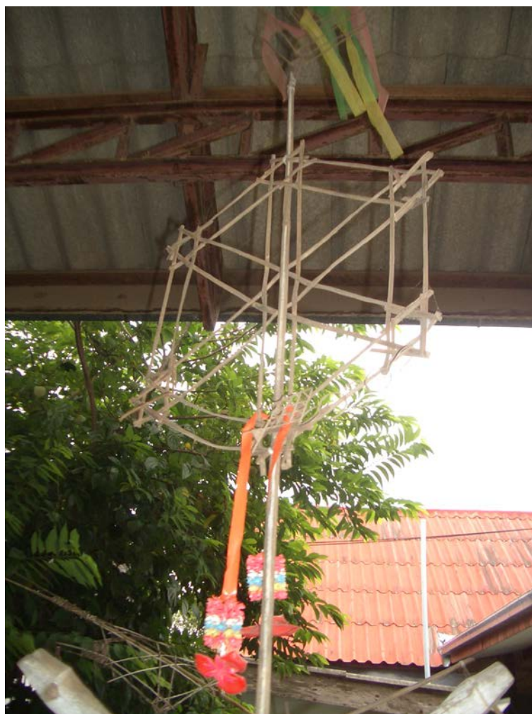
อุปกรณ์ในการทำวิญข้าว