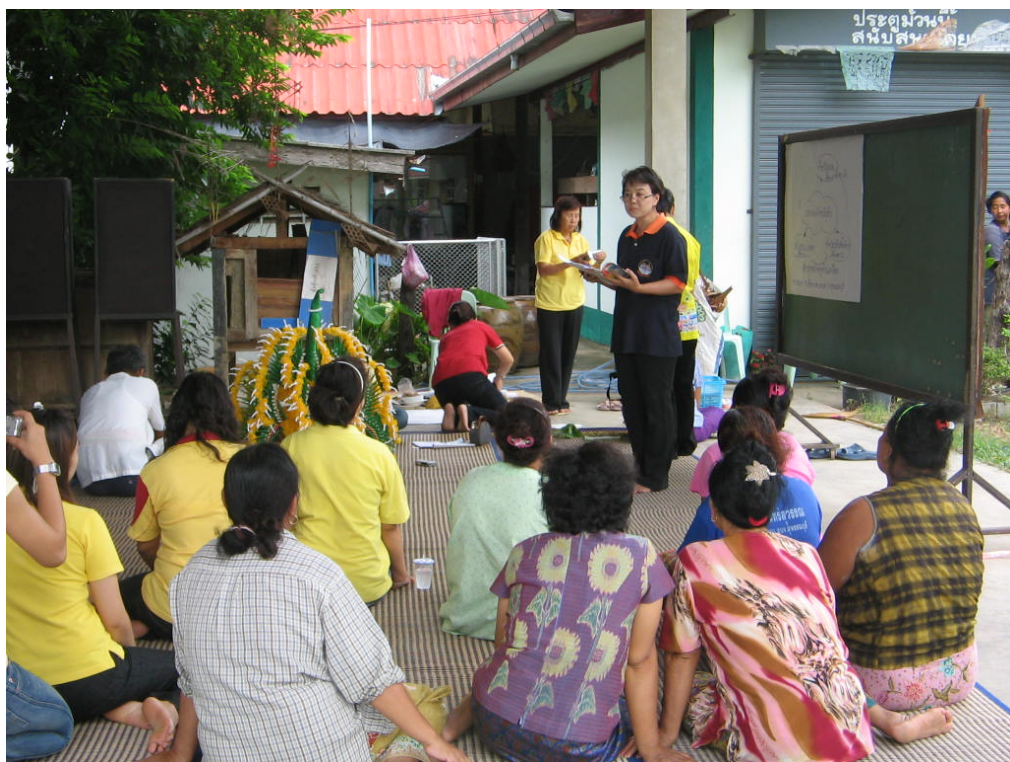
คณะทำงานสัมภาษณ์แบบกลุ่ม