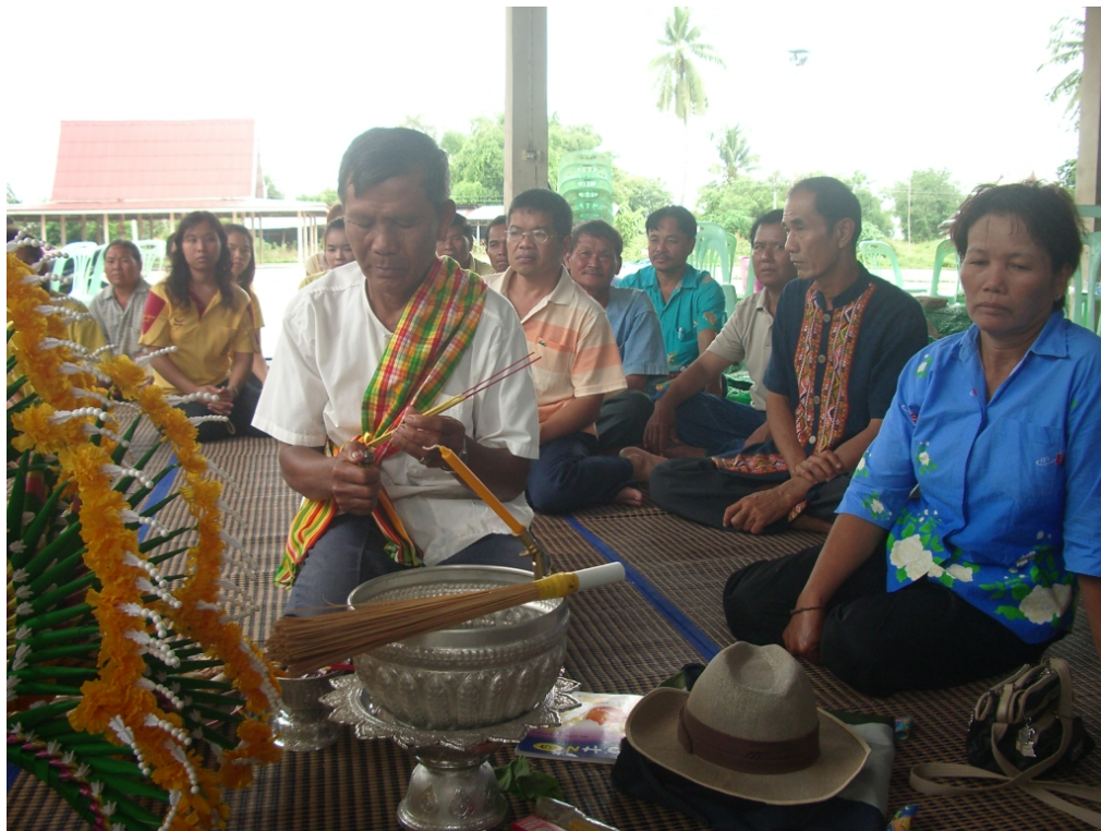
ผู้เข้าร่วมพิธีประกอบด้วย ชุมชน ผู้นำชุมชน ภาครัฐและเอกชน