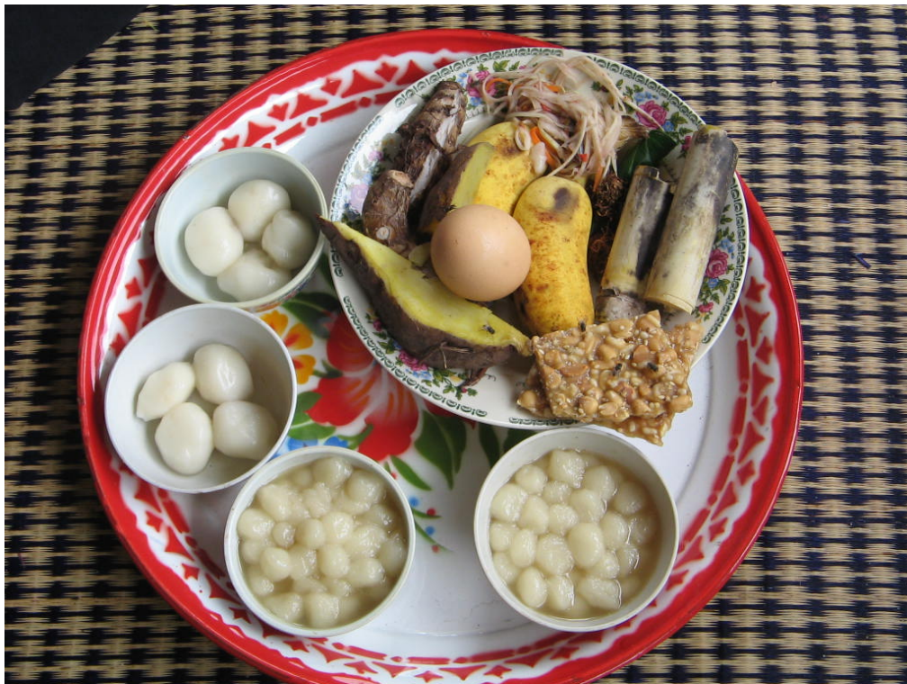
อุปกรณ์ในพิธีทำขวัญข้าว