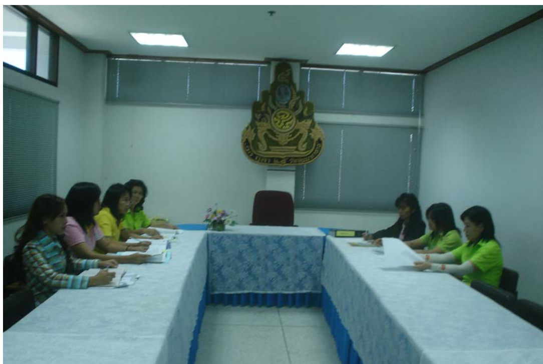
คณะทำงานประชุมปรึกษาหารือการดำเนินงานวิจัย