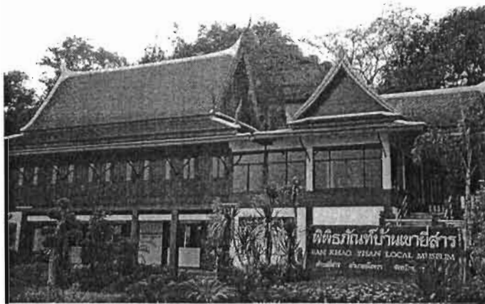
พิพิธภัณฑ์บ้านเขายี่สาร

● พิพิธภัณฑ์บ้านเขายี่สาร เป็นพิพิธภัณฑ์ท้องถิ่นที่เกิดจากความร่วมมือของ ชาวบ้านยี่สาร โดยช่วยกันรวบรวมโบราณวัตถุ ศิลปวัตถุจากวัดเขายี่สารและบริจาคสิ่งของต่าง ๆ เพื่อจัดแสดงให้ผู้สนใจได้เข้าชม พิพิธภัณฑ์ได้จัดตั้งขึ้นเมื่อ พ.ศ. 2539 การจัดแสดงใน พิพิธภัณฑ์แบ่งออกเป็นสองส่วน ส่วนแรกจะอยู่ชั้นบนของศาลาการเปรียญ แสดงเรื่องราวทาง ประวัติศาสตร์โบราณคดีของบ้านยี่สาร และการปรับตัวของชาวบ้านในสังคมที่เปลี่ยนแปลง ส่วน ที่สองอยู่ชั้นล่าง แสดงวิถีชีวิตและภูมิปัญญาของชาวบ้าน