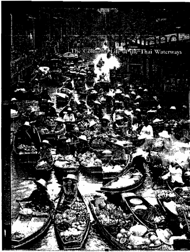
แผ่นป้ายโฆษณาตลาดน้ำท่าคา จัดทำโดยการท่องเที่ยวแห่งประเทศไทย ตัดไว้ที่บริเวณ ตลาดน้ำท่าคา