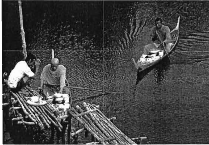
การตักบาตรทางน้ำที่ปลายโขงพาง

ตัวอย่างรายการท่องเที่ยวสำหรับนักท่องเที่ยวที่ไปเป็นหมู่คณะและผ่านบริษัทรับจัดทัวร์