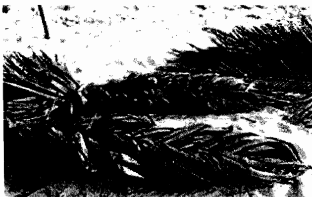
“ซั้ง” ภูมิปัญญาของชาวบ้าน 1

ในกรณีของกิจกรรมการท่องเที่ยวที่ปลายโพงพานั้น ถึงแม้ว่าการใช้ภูมิปัญญาท้องถิ่น จะไม่ได้ชัดเจนเหมือนที่ทำคาก็ตาม แต่เราก็สามารถสังเกตได้จากกิจกรรมที่มีอยู่ของปลายโพงพานจะสอดแทรกภูมิปัญญาท้องถิ่นไว้ เช่น กิจกรรมการเยี่ยมชมวิธีการทำน้ำตาลมะพร้าว ซึ่งในกิจกรรมนี้ก็ได้มีการแสดงให้เห็นถึงวิธีการนำวัตถุดิบที่จะแปรรูปเป็นน้ำตาลมะพร้าว ซึ่งในที่นี้ก็คือน้ำตาลจากงวงมะพร้าวที่ชาวบ้านจะต้องทำการเก็บในช่วงเช้า เพื่อจะได้วัตถุดิบที่มีคุณภาพที่สุดและหลังจากนั้นก็จะเป็นวิธีการเคี่ยวน้ำตาลมะพร้าว ซึ่งวิธีการทำนั้นยังคงเป็นวิธีพื้นบ้าน เป็นสิ่งที่ได้รับการสืบทอดมาตั้งแต่บรรพบุรุษ นอกจากกิจกรรมการเยี่ยมชมวิธีการทำน้ำตาลมะพร้าวแล้ว ปลายโพงพานยังนำเสนอกิจกรรมการท่องเที่ยวที่พาไปดูวิธีการดักจับสัตว์น้ำโดยใช้วิธีแบบเก่าแก่ ซึ่งก็คือการใช้ “ซั้ง” ในการดักกุ้ง ซึ่งเป็นอุปกรณ์ดักจับสัตว์น้ำโดยใช้ภูมิปัญญาชาวบ้าน