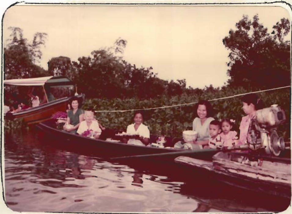
รูปที่ 1 เรือของพุทธศาสนิกชนจอดอยู่หลังแนวเขื่อน