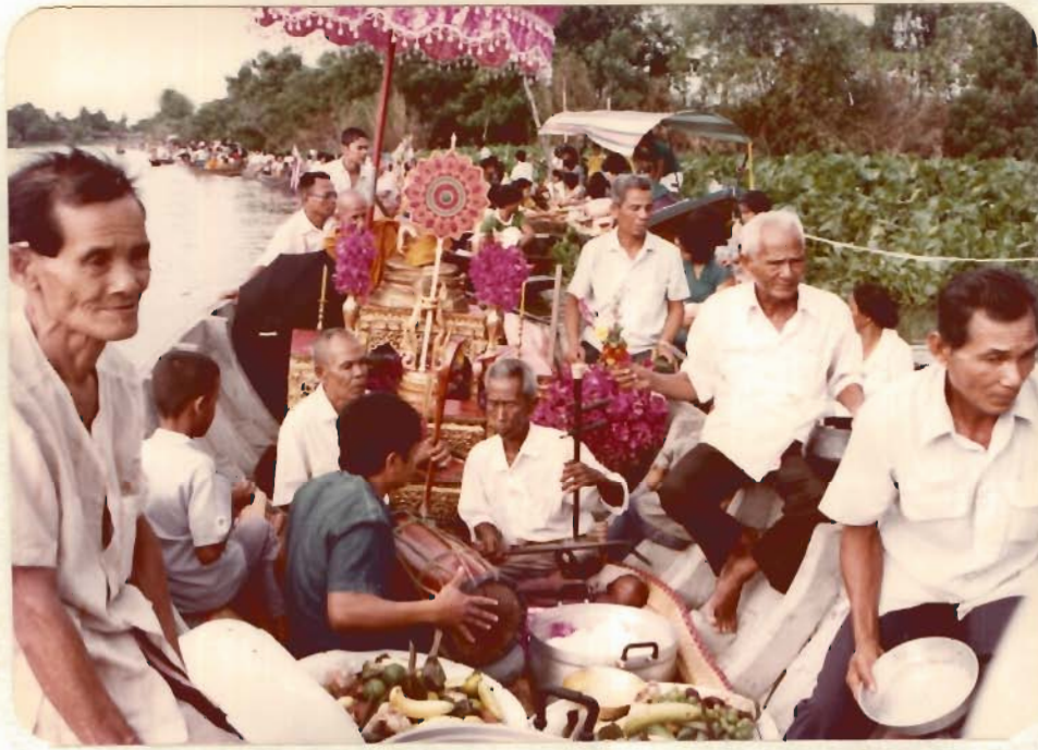
รูปที่ 6 เรือพระพุทธรูปและเจ้าอาวาส มีคนตรีประกอด้วย