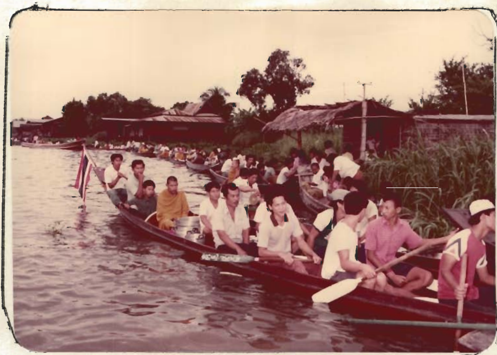
รูปที่ 2 เรือของพระภิกษุและสามเณรสาวไปทวายแนวเขื่อน