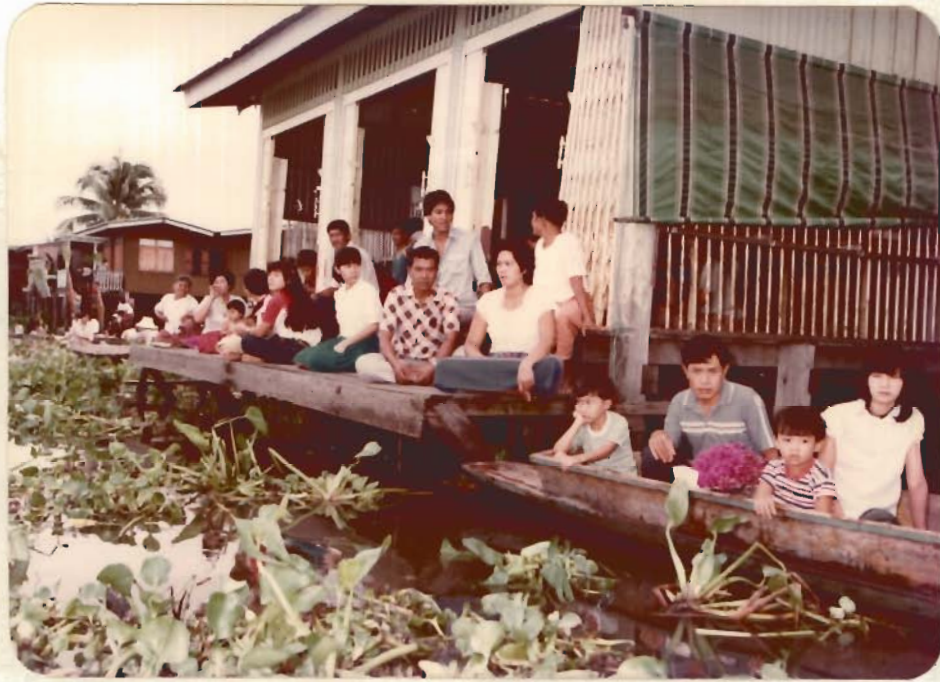
รูปที่ 3 พุทธศาสนิกชนนั่งที่ฐานบ้านเพื่อรดกัมมาทร