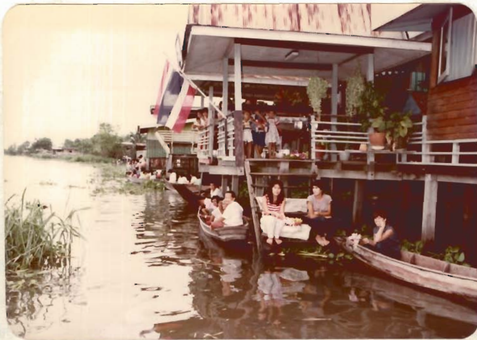
รูปที่ 4 แหนที่จะนั่งในเรือ ไร่บ้านโคกบ้านก็ได้