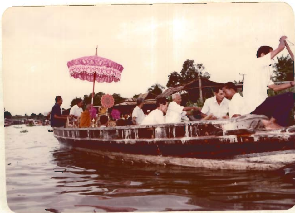
รูปที่ 7 เรือพระพุทธรูปและเจ้าอาวาส รับปีนพาคเป็นลำแรก

พายเรือหรือจุกทะเลเล่น เป็นที่สนุกสนาน สำหรับผู้ใหญ่ก็จะหาซื้อของกินหรือกับข้าวกลับไป