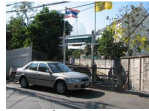
รูปถ่ายที่ ๒ ทางเข้าชุมชน ด้านถนนอิสรภาพ

การเดินทางเข้าไปในชุมชนสามารถเดินทางได้ทั้งทางบกและทางน้ำ ทางบกเมื่อก่อนนี้มีเส้นทางเดินเท้าผ่านมาทางวัดกัลยาณมิตร ปัจจุบันสามารถเดินเท้าเข้าชุมชนได้ ๓ ทาง คือ มาทางถนนอิสรภาพ ข้ามสะพานเจริญพาศน์ เข้าซอยถนนเทศบาลสาย ๒ เดินมาจนกระทั่งถึงเชิงสะพานช้าง หน้าสถานีตำรวจบุปผาราม แล้วเดินเลียบชายคลองบุปผารามเข้าชุมชน รถประจำทางที่ผ่านหน้าซอยถนนเทศบาลสาย ๒ มีหลายสาย ได้แก่ สาย ๑๕ สาย ๔๐ สาย ๕๖ สาย ๕๗ อีกทางหนึ่งมาเส้นถนนอรุณอมรินทร์ตัดใหม่ ข้ามสะพานอนุทินสวัสดิ์ จะมีทางเข้า ๒ ทาง คือด้านใต้สะพาน กับด้านตรงข้ามกับวัดกัลยาณมิตร ทางนี้ไม่มีรถประจำทางผ่าน ต้องนั่งรถประจำทางมาลงที่หน้าสถานีตำรวจบางกอกใหญ่ และเดินเท้าจากสามแยกวัดอรุณ ข้ามสะพานอนุทินสวัสดิ์ ส่วนทางน้ำเมื่อก่อนนี้ใช้ทำน้ำหน้ำมัสยิด และทำน้ำสะพานยาว แต่ปัจจุบันไม่ค่อยมีเรือวิ่งผ่านแล้ว เนื่องจากการคมนาคมทางบกมีความสะดวกกว่า ถ้าหากเดินทางมาทางน้ำ สามารถนั่งเรือหางยาวจากสะพานพุทธเข้าคลองบางกอกใหญ่และขึ้นที่ทำน้ำหน้ำมัสยิดได้ หรือลงเรือข้ามฟากจากฝั่งปากคลองตลาด มาขึ้นที่วัดกัลยาณมิตร แล้วเดินเท้ามาทางหน้าวัด และเดินข้ามถนนอรุณอมรินทร์ตัดใหม่ มาก็จะถึงชุมชนแล้ว