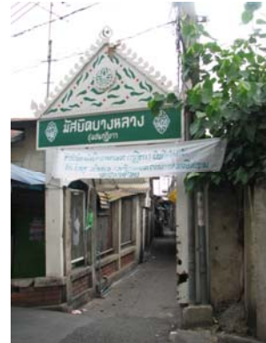
รูปถ่ายที่ ๓ ทางเข้าชุมชน ด้านถนนอรุณอมรินทร์ตัดใหม่