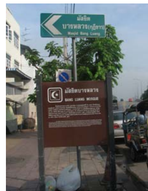
รูปถ่ายที่ ๔ ทางเข้าชุมชน ด้านถนนอรุณอมรินทร์ตัดใหม่