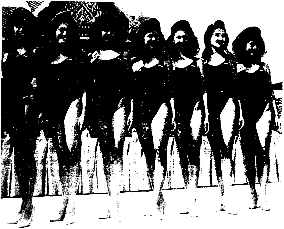
รูปที่ 9 ภาพชุดว่ายน้ำของผู้เข้าประกวดนางสาวไทย ปี 2537