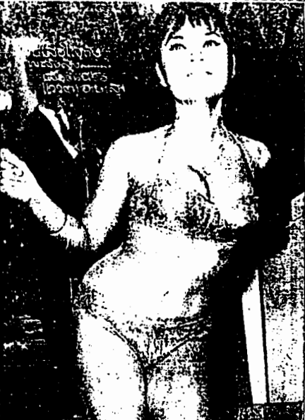
รูปที่ 7 ภาพชุดราตรี และแฟชั่นชุดว่ายน้ำของสตรียุคนี้